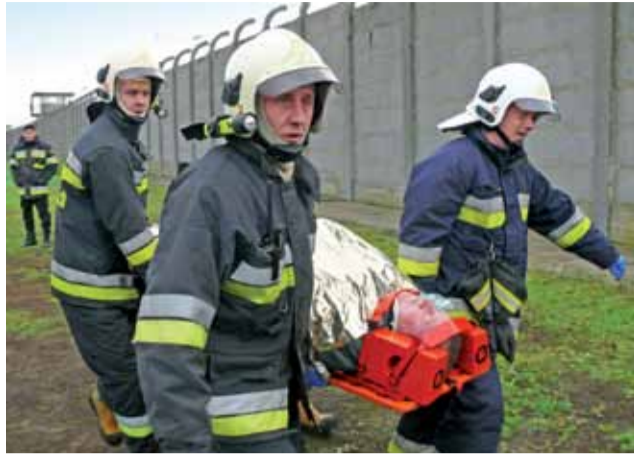
W ćwiczeniach udział wzięli strażacy, którzy nie tylko zajmowali się walką z ogniem czy uwalnianiem poszkodowanych z uszkodzonych aut, ale też opatrywali i transportowali ich do punktu zbiorczego.