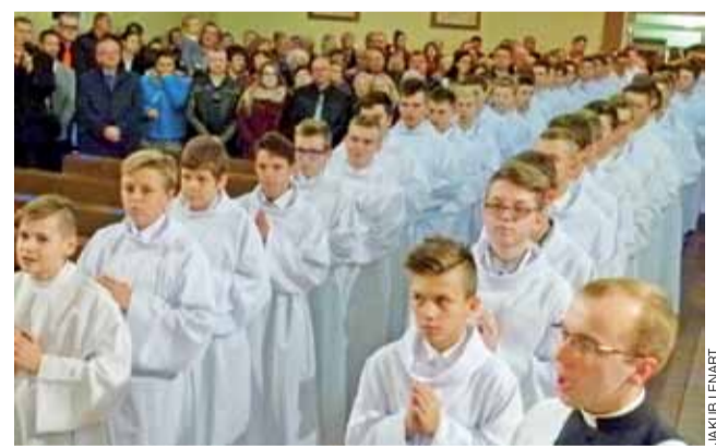
Do niedawna ministranci, teraz już w lektorskich albach.