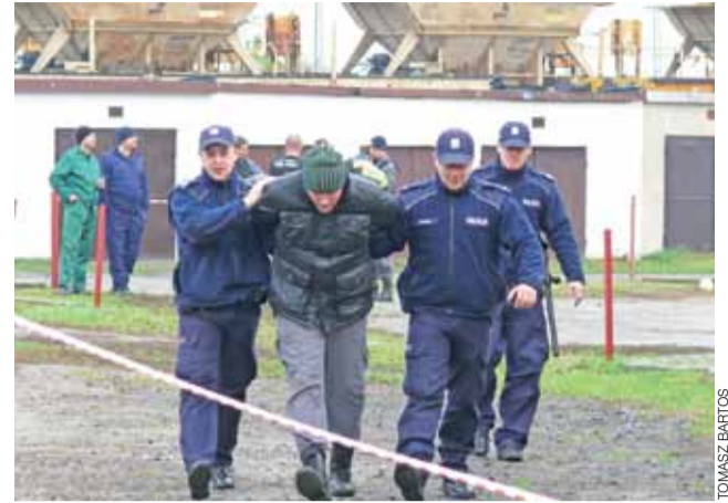
Policjanci aresztowali jedną z osób, która najpierw zakłócała porządek pod bramą Zakładu Karnego, a potem wrzuciła przez więzienny mur racę do budynku administracyjnego.

Łowicz | Spektakularne ćwiczenia w Zakładzie Karnym