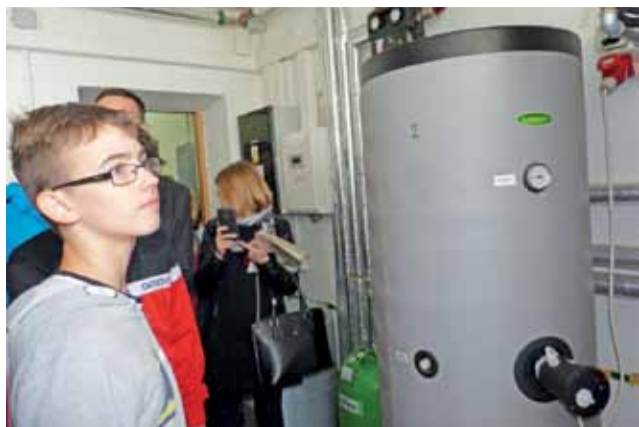
Uczestnicy Ekoforumu zwracali uwagę na instalację pompy ciepła w budynku internatu w Zduńskiej Dąbrowie.