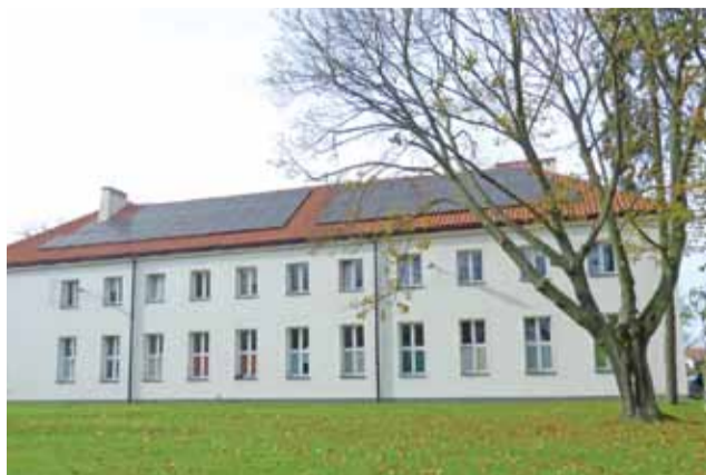
Solary na budynku internatu – jeden z przykładów stosowania OZE w Zduńskiej Dąbrowie.