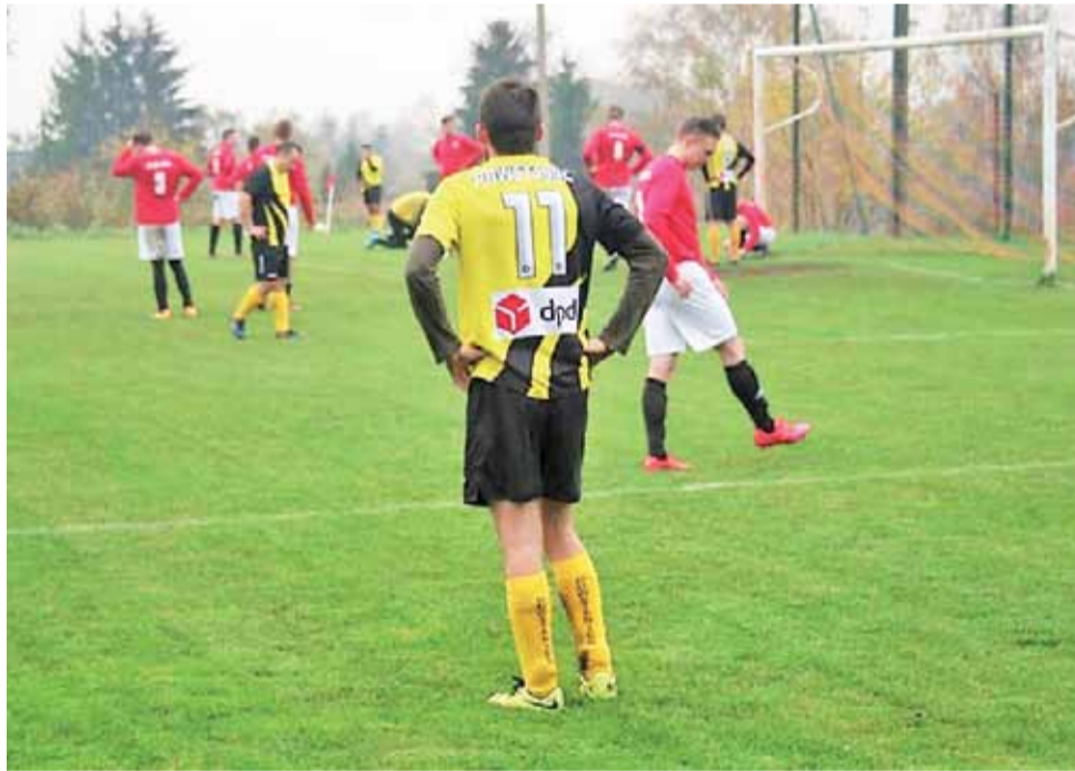
Piłkarze Powstańca Dobra wywalczyli cenny punkt w starciu z jedną z najlepiej grających i nieobliczalną ekipą Milanu Club Polonia z Łodzi.