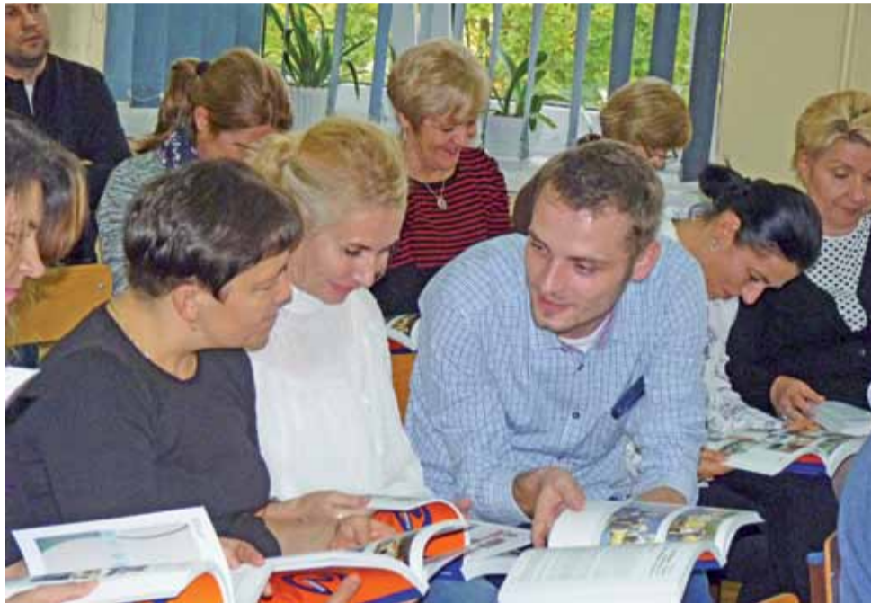
Jak bardzo książka spodobała się nauczycielom może świadczyć fakt, iż zaraz po otrzymaniu egzemplarzy z dedykacjami zaczęli ją z zaciekawieniem przeglądać i żywo wymieniać uwagi.

Autorki wydawnictwa przyznały, że pomysł jego opracowania zrodził się w niekorzystnym dla Gimnazjum nr 2 czasie, gdy było