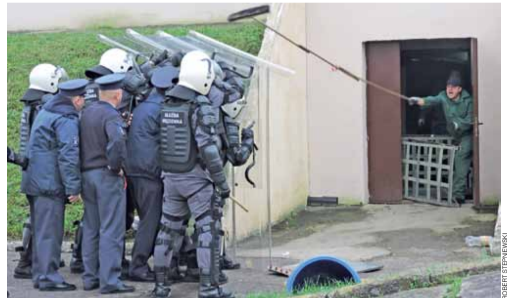
Grupa Interwencyjna SW w starciu z osadzonymi, którzy zabarykadowali się w magazynie żywności. Osadzonych w czasie ćwiczeń grali pracownicy łowickiego ZK.

Drugi ze scenariuszy ćwiczeń na terenie Zakładu Karnego dotyczył ewakuacji osób z budynku administracyjnego jednostki penitencjarniej, w którym doszło do silnego zadymienia przez świecę dymną, którą do środka wrzuciła osoba zza więziennego muru.