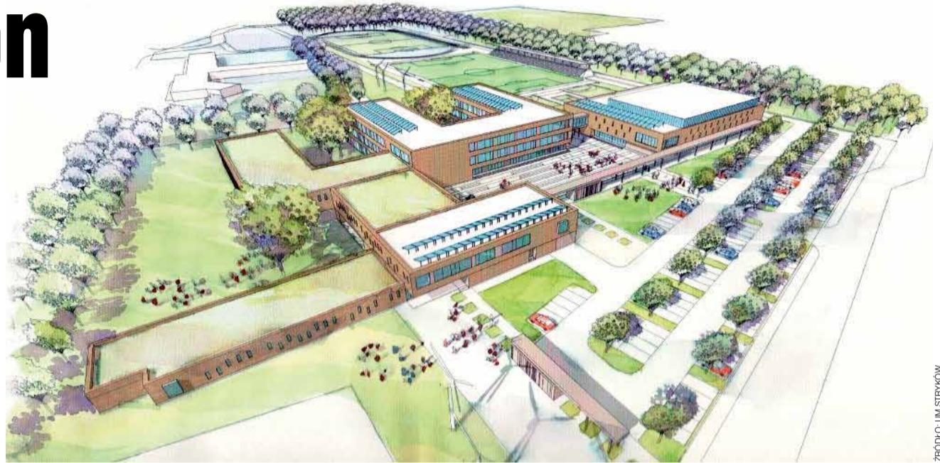
Autorem wizualizacji centrum edukacyjno-sportowego jest pracownia Radosława Guzowskiego z Warszawy.

Przed wszystkim jednak Radosław Guzowski przedstawił