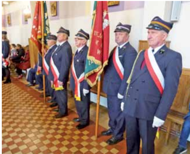
Gościnnie pojawiły się duszpasterstwa kolejarzy z Rogowa i Koluszek.