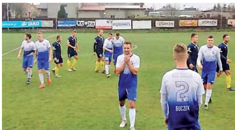
Zawodnicy Orkana Buczek cieszą się po końcowym gwizdku z wywalczonego remisu w Strykowie.

Po zmianie stron podopieczni trenera Łukasza Wijaty początkowo w pełni kontrolowali wydarzenia na boisku. W 61 min. powinno być 2:0 dla Zjednoczonych, ale sędzia dopatrywał się spalonego strykowskiego piłkarza. W kolejnych minutach niestety gospodarze po-