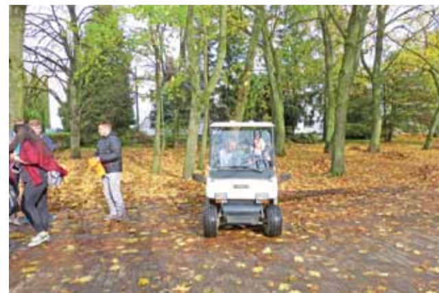
Jedną z atrakcji zwiedzania szkoły była możliwość przejażdżki pojazdem elektrycznym – Melexem.