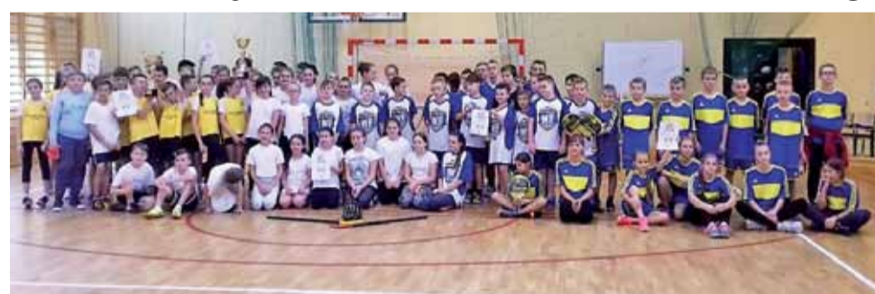
Uczestnicy Turnieju Unihokeja z pięciu szkół z terenu Gminy Stryków.

Do zawodów przystąpiły szkoły z SP 1 i SP 2 w Strykowie, SP Bratoszewice, SP Koźle i gospodarze z SP Dobra. W kategorii dziewcząt najlepsze były zawodniczki Szkoły Podstawowej nr 1 w Strykowie pod wodzą nauczyciel wychowania fizycznego Moniki Leszczyńskiej. Strykowiarki zasłużyły wywalczając 1. miejsce, wygrywając wszystkie trzy spotkania, kolejno 2:0 z Bratoszewicami, 1:0 z Dobrą i 1:0 SP 2 w Strykowie. W zmaganiach chłopców rywalizacja była bardziej zacięta, ale zwycięzca w pełni zasłużył na triumf. Po raz drugi w tym roku szkolnym triumfowali