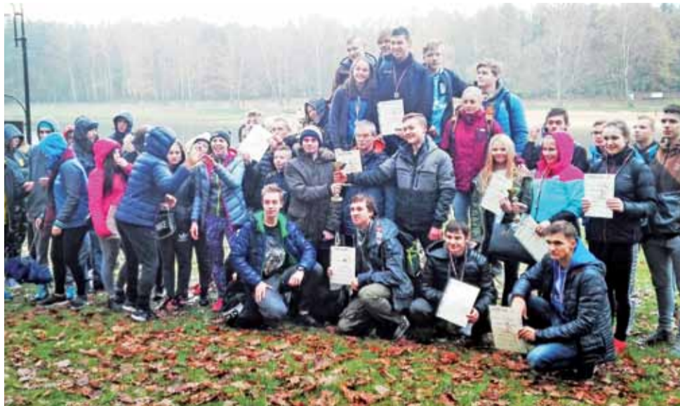
Uczestnicy II Jesiennego Biegu Przełajowego Hrabiego Dracula po raz kolejny spotkali się na trasie i pokazali, że oprócz sportowej rywalizacji potrafią świetnie się bawić.

Do udziału w zawodach zgłosiło się 8 placówek z terenu wo-