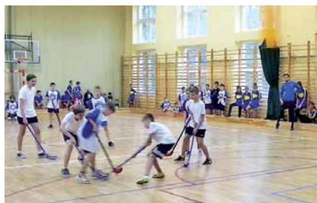
Walka na boisku mimo użycia specjalnych kijów była bezpieczna.

ze Strykowa uzyskali prawo reprezentowania gminy na zawodach szczebla powiatowego. wp