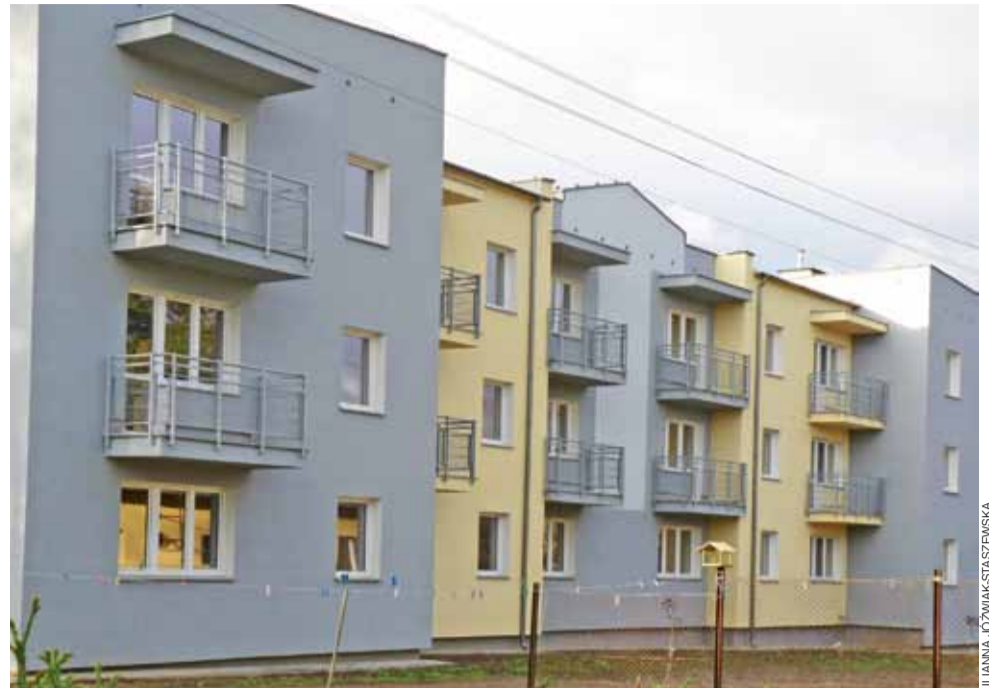
Powierzchnia mieszkań to 32-49 mkw. Każde z nich dysponuje niewielkim pomieszczeniem gospodarczo-magazynowym, a także miejscem parkingowym.

Wśród kandydatów na najemców jest dwóch wnioskodawców, którzy wychowywali się w rodzinach zastępczych. Jest również rodzina z Ukrainy z Kartą Polaka, która mieszka w Strykowie od 2 lat. Są matki samotnie wychowujące dzieci, rodziny z chorymi dziećmi i osoby niepełnosprawne.