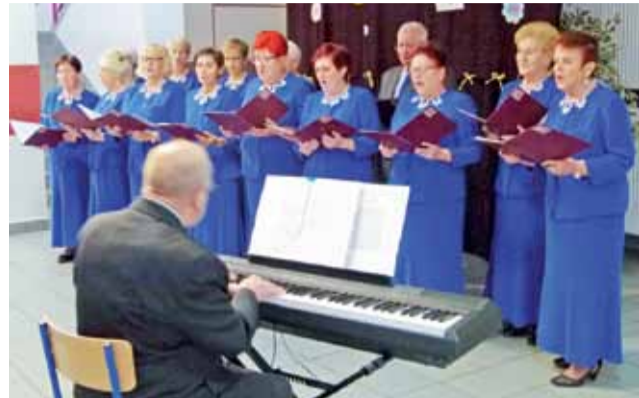
Występ chóru Słoneczny Krąg.