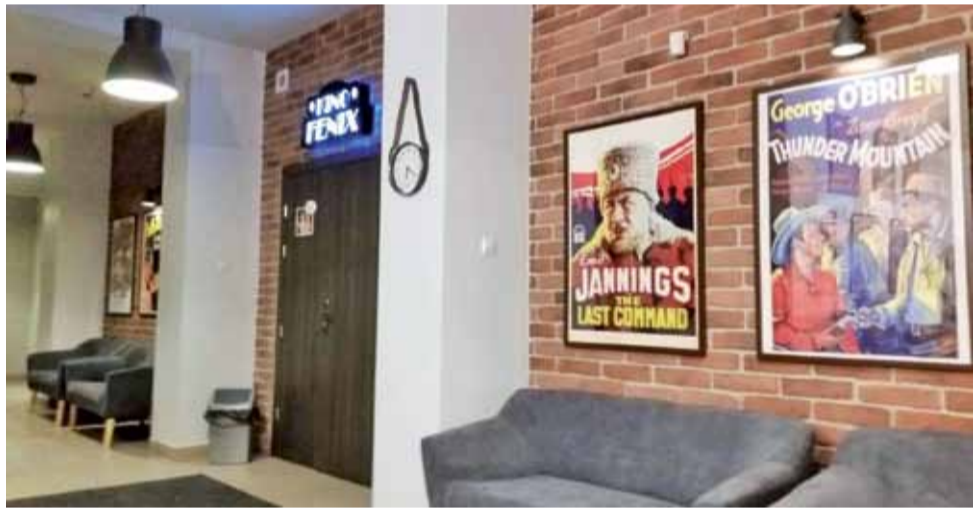
Przeszło rok temu holl i korytarz kina Fenix zyskały klimatyczną odświeżkę.

Kino powstało od podstaw w listopadzie 2006 roku. Ma 11 lat, cały czas się rozwija i zwiększa ilość widzów. W tym czasie otrzymaliśmy dwa największe wyróżnienia: Nagrodę PISF dla Kina (2014) i Nagrodę PISF dla DKF (2017), dwie nominacje do Nagrody PISF (za monografię „100 lat kina w Łowiczu” 2012) i nominację dla DKF (2015), jesteśmy scyfrzowani, sala ma klimatyzację, są bilety online, fajnie zaaranżowany, klimatyczny hol. Niebawem druga sala. Wiele pieniędzy pozyskiwanych jest ze środków zewnętrznych (konkursy PISF, MKiDN, NCK). Mamy przedstawiciela w Radzie Kin Studyjnych (reprezentuje woj. mazowieckie, łódzkie i lubelskie). Dużo się o nas mówi. I teraz wisienka na torcie: przyjęcie do europejskiej rodziny Europa Cinemas, która skupia najlepsze kina z 42 krajów. Dla mnie to spełnienie marzeń i planów zawodowych. Jak na 11 lat, to bardzo dużo. A przecież po utracie „Bzury” Łowicz miał zostać bez kina.