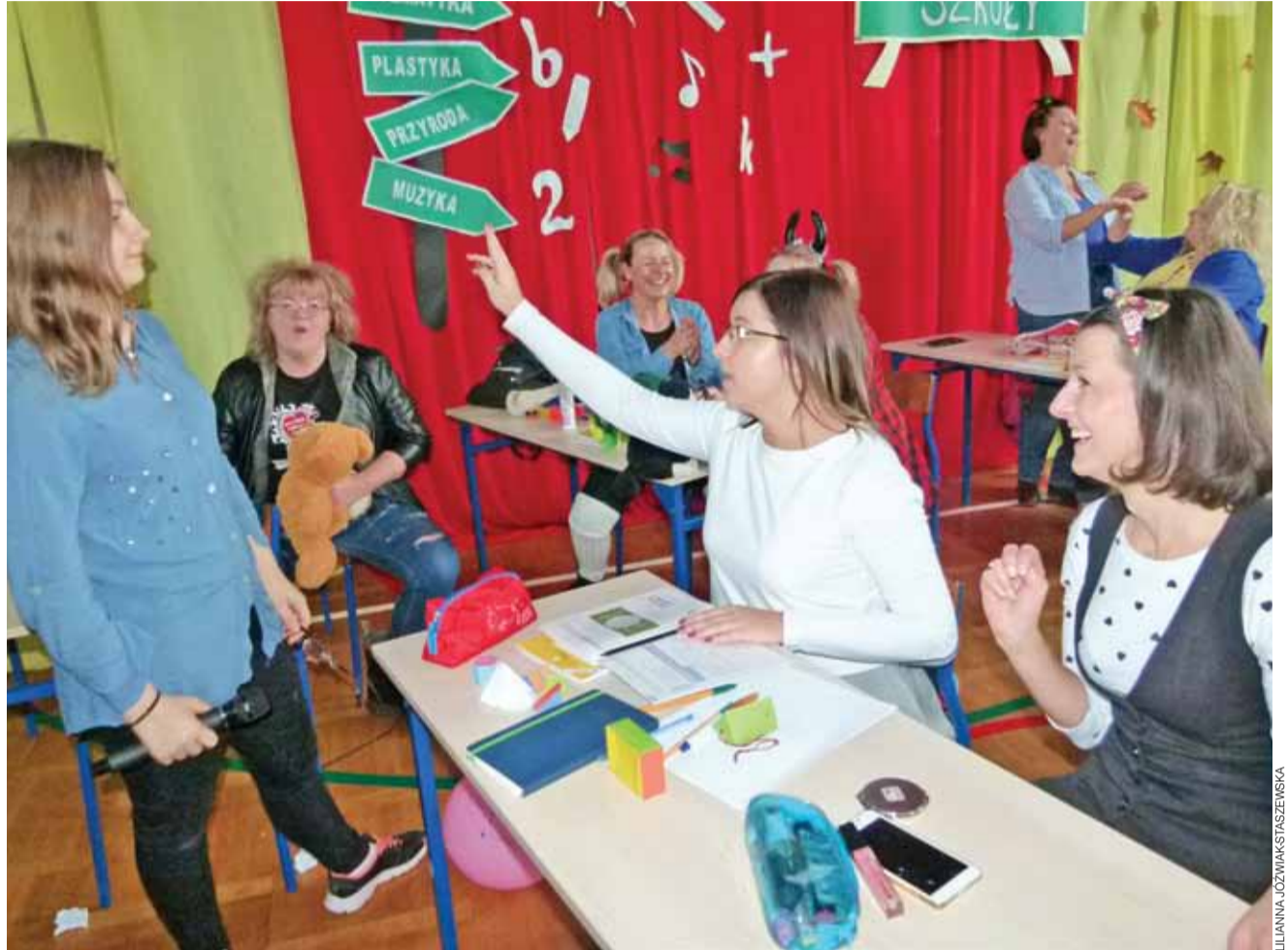
W drugiej części uroczystości okazało się, że Święto Szkoły to dzień, w którym może zdarzyć się wszystko, nawet... niegrzeczni nauczyciele i grzeczni uczniowie.

Usadzeni w ławki nauczyciele dali do wiwatu nastoletniej nauczycielce. Nad scenariuszem lekcji nie musieli się głowić, pomysły zaczerpnęły z życia i swojej codziennej pracy.