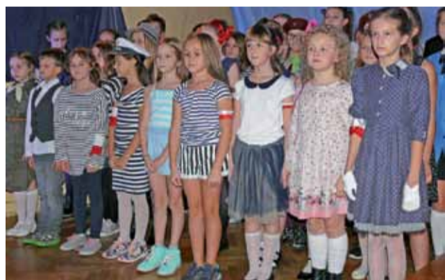
Wykonawcy programu artystycznego – uczniowie „Jedynki”.