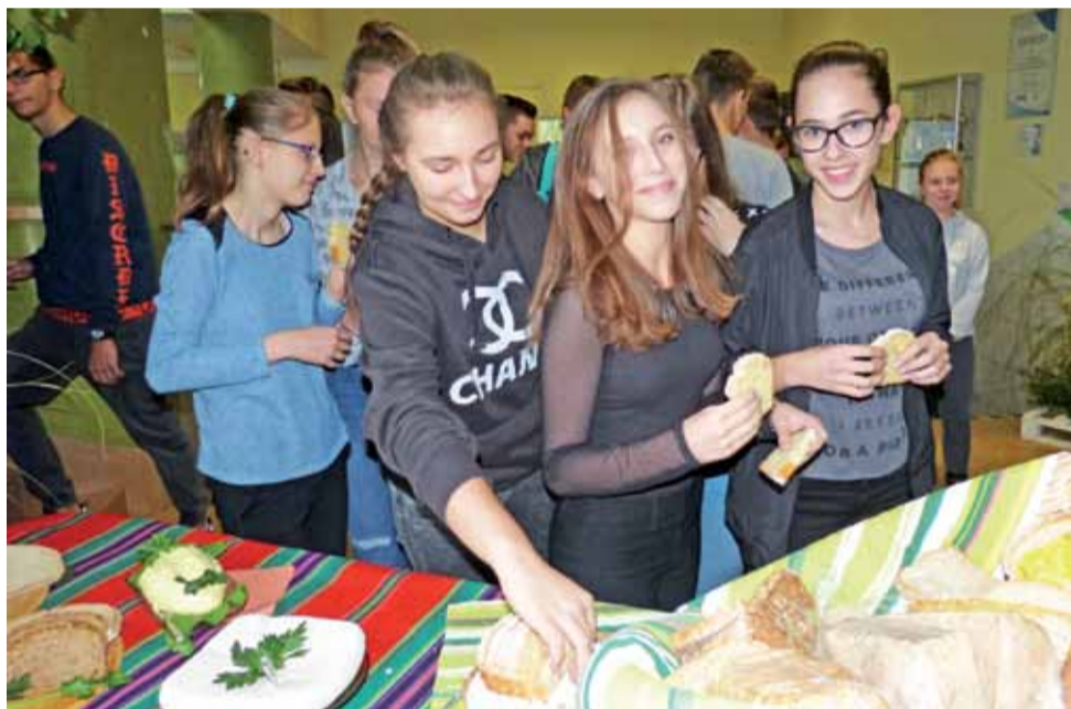
Dla gości przybyłych na Ekoforum przygotowano poczęstunek: kanapki z chleba za zakwasie, ciasto drożdżowe i inne przysmaki.

Są już rozwiązania hybrydowe – baterie, które łączą solar z fotowoltaiką.