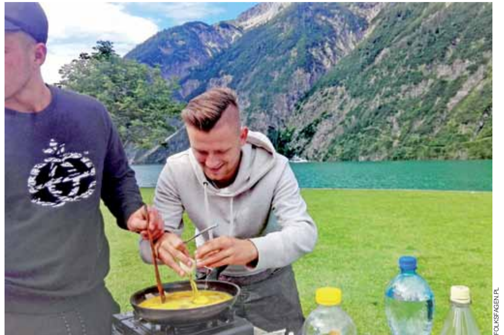
Jajecznica w pięknej scenerii. Tyrol – kraj związkowy w zachodniej Austrii.

Klub Pracownia | Pierwsze spotkanie łowickich podróżników