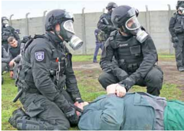
Członkowie Grupy Interwencyjnej Służby Więziennej przy jednym z więźniów poszkodowanych w zderzeniu konwoju z cysterną.