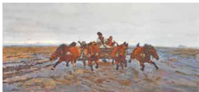
„Czwórka”, 1880 r.; – to jedna z obrazów na wystawie.

Wystawa jest czynna jeszcze do 19 listopada, obowiązują na nią bilety za 5 zł. tm