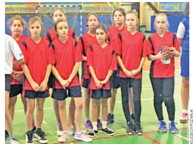
Uczennice SP Niesułków podczas Mistrzostw Powiatu Zgierskiego musiały radzić sobie w ostabionym składzie.

Rywalizacja odbyła się w dniach 16-17 listopada w zgierskiej Hali MOSiR. Mistrzyni Gminy Stryków z Niesułkowa miały znacznie utrudnione zadanie. Plaga choroby dotknęła aż trzy zawodniczki pierwszego składu, w tym najlepszą bramkarkę gminnych mistrzostw, co znacznie obniżyło szanse podopiecznych nauczyciela wychowania fizycznego na korzystny wynik. Mimo absencji kluczowych szczyptornistek niesułkowie nie okazały się słabsze na słowa uznania. Co prawda nie udało się wyjść z grupy, ale do szczęścia i gry w strefie medalo-