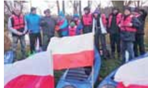
IV Kajakowy Spyw Niepodległości – Bzura 2017.

11 listopada Szkolny Klub Turystyki Kajakowej przy Zespole Szkół Centrum Kształcenia Rolniczego w Zduńskiej Dąbrowie zorganizował IV Kajakowy Spyw Niepodległości – Bzura 2017 na odcinku Strugienice – Łowicz. Uczestniczyło w nim kilkunastu mieszkańców gminy Zduny. Wszyscy mieli do kajaków przywiązane biało-czerwone flagi. Spyw odbywał się w przyjaznej atmosferze, a silny nurt rzeki, po-