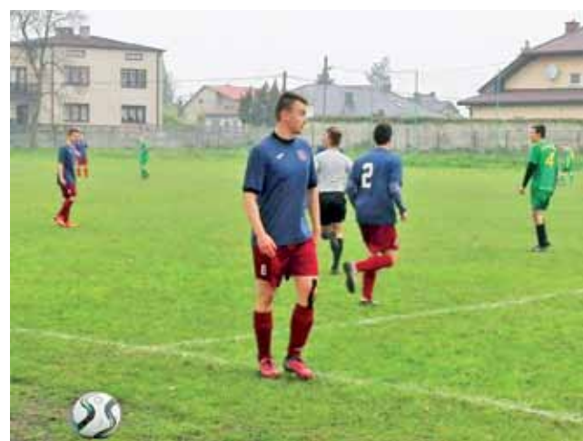
Iskra (granatowe koszulki) nie miała po ostatnim meczu wesołej miny.