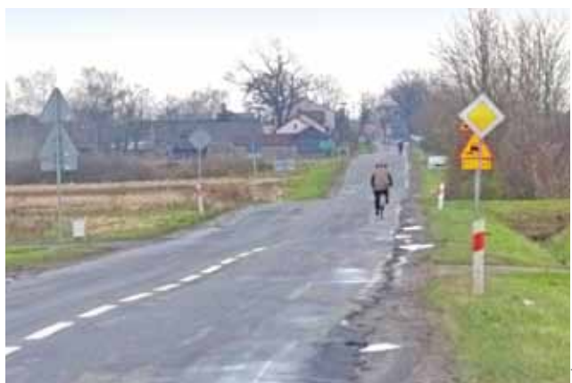
Tu doszło do śmiertelnego wypadku. Droga wojewódzka 703 w Piotrowicach. Stan nawierzchni i pobocza pozostawia wiele do życzenia.