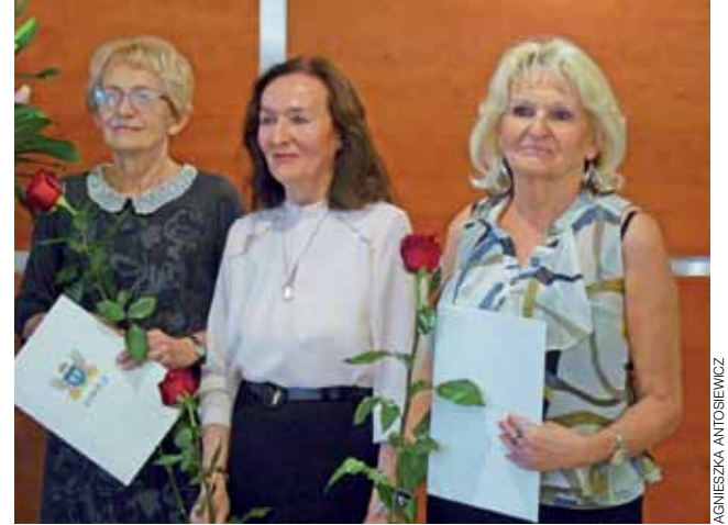
Listy gratulacyjne odbierają najbardziej aktywne osoby w ŁUTW.

Szkiełka | 10-lecie Łowickiego Uniwersytetu Trzeciego Wieku