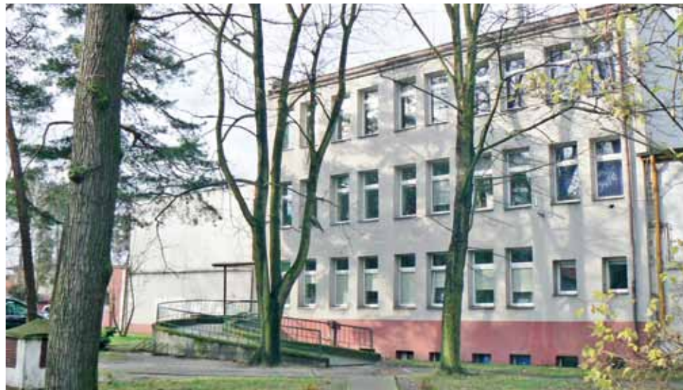
Centrum Zdrowia w Głownie. Tutaj przyszedł na świat pijany noworodek, urodzony przez 34-letnią mieszkankę pow. zgierskiego.

– Później, w wyniku zaistniałych okoliczności i pewnych faktów dotyczących mamy, my również musieliśmy wykonać pewne obowiązujące nas procedury u dziecka – mówiła nie wdając się