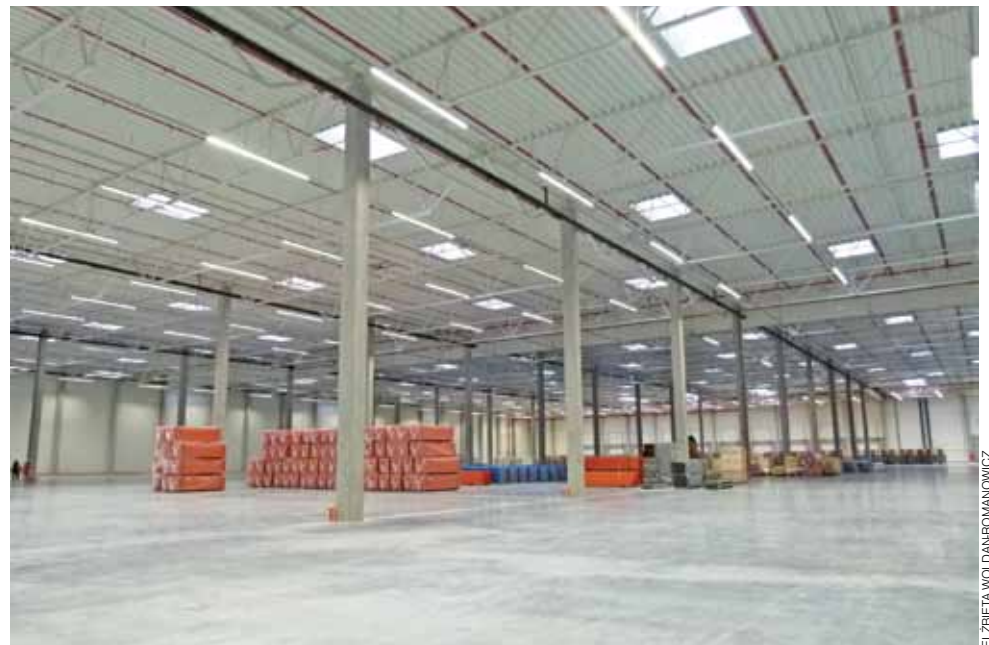
Ta powierzchnia robi wrażenie. Nowy magazyn to aż 5 hektarów pod dachem.

W ciągu zaledwie 120 dni w podstrykowskiej Kielminie, na terenie położonym w sąsiedztwie drogi krajowej nr 71, w odległości kilku kilometrów od pierwszego centralnego magazynu Castoramy w tym regionie, powstała nowa, zadaszona hala o powierzchni 50 tys. m 2 , czyli 5 hektarów.