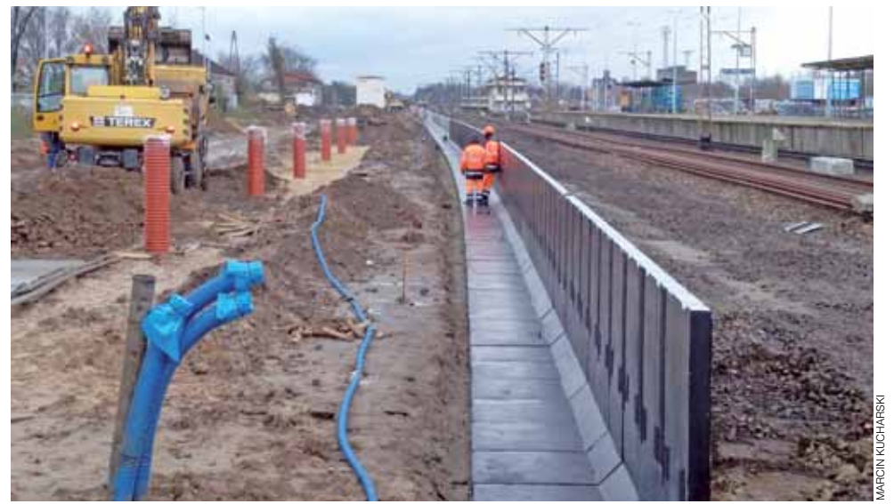
W tym miejscu powstanie peron 1.