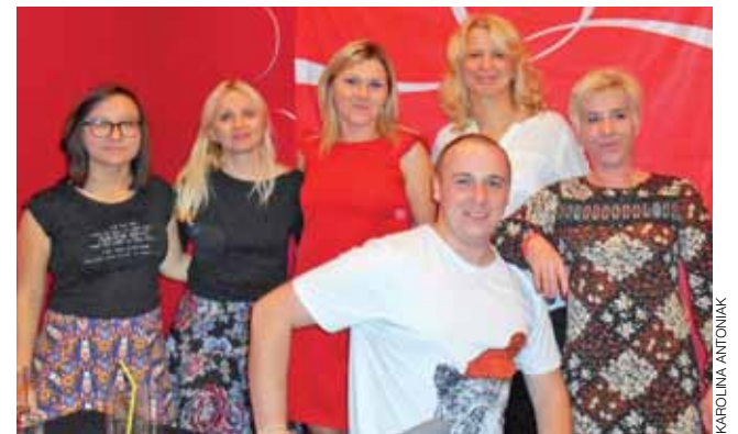
Pamiątkowe zdjęcie części tegorocznej ekipy Szlachetnej Paczki.