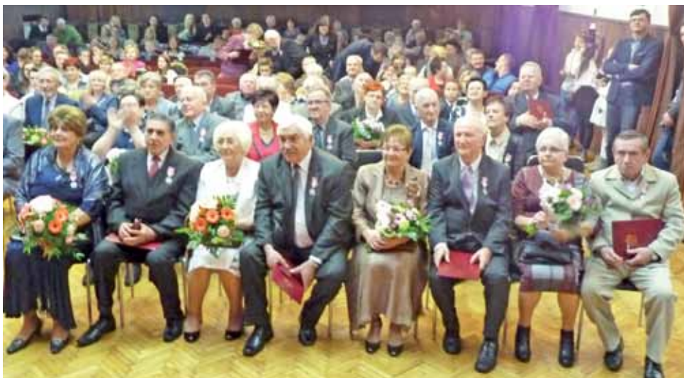
W tym roku medale otrzymała rekordowa liczba aż 25 par.