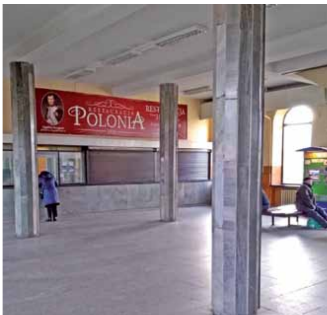
Remont jest planowany, tylko nie wiadomo kiedy się rozpocznie.