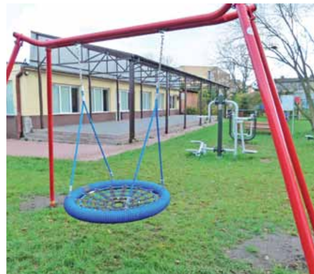
Bratoszewicki plac zabaw wzbogacił się m.in. o lubiane przez najmłodszych bocianie gniazdo.

Dzięki pozyskiwanym z zewnątrz oraz tym będącym co roku do dyspozycji sołectwa pieniądze, a następnie realizowanymi wspólnymi siłami mieszkańców i druhowi lokalnej OSP projektom, plac zabaw, jak również cała działka sołecka w Kielminie, stają się coraz bardziej zagospodarowane i – jak mówi sołtys Marek Perek – to na pewno jeszcze nie wszystko. Mieszkańcy w ubiegłym roku własnymi siłami zbudowali altanę i utwardzili ją kostką brukową. W trakcie urzędowania jest plac fitness – w tym roku za 6 tys. zł pozyskane z budżetu gminy zakupiono 2 urządzenia do ćwiczeń. Do celowo będzie tu od 6 do 8 takich urządzeń. Natomiast sam plac zabaw miały się wzbogacić jeszcze chociażby o stożek linowy do wspinaczki. IJS