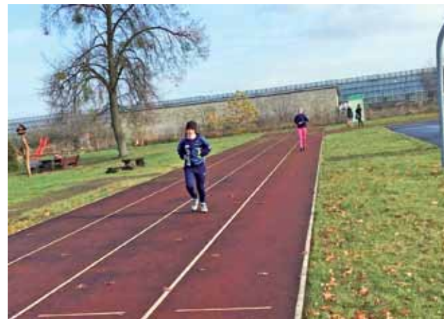
Kolarze ze Strykowskiej Szkółki odbywali testy biegowe na bieżni przy Szkole Podstawowej w Bratoszewicach.

Młodzi kolarze musieli zmierzyć się ze zwisem na drażku, sprintem na 50 m oraz biegiem na 600 m. Wszystkie wyniki uzyskane przez uczestników Szkółki zostaną przesłane do Narodowej Bazy Talentów, gdzie specjaliści w późniejszych latach będą mieli wgląd i możliwość sprawdzenia progresu zawodników oraz określenia ich potencjału sportowego w kolejnych latach. Dzięki temu żaden wielki sportowy talent nie zostanie pominięty. wp