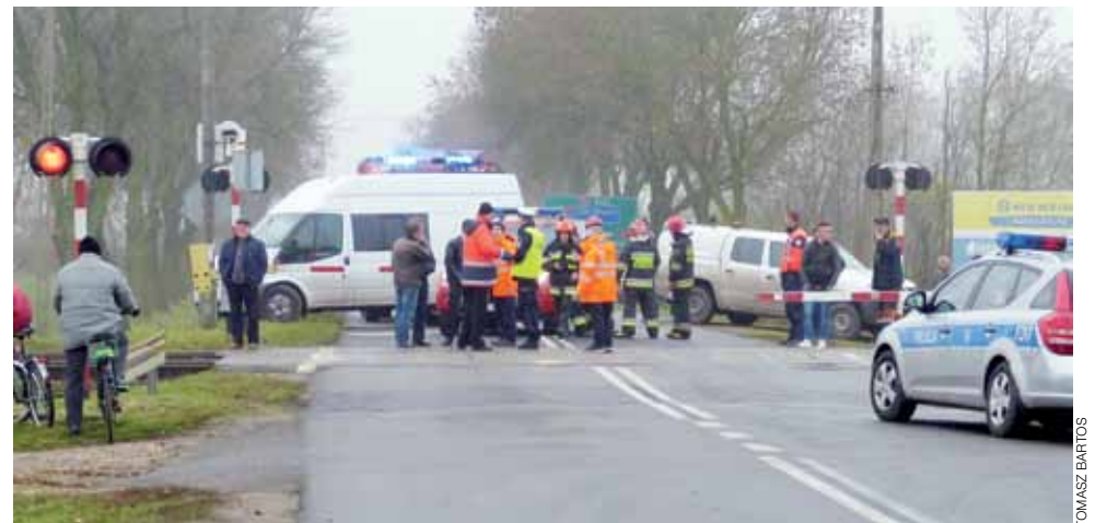
Wypadek na przejeździe w ul. Płockiej sprawił, że został on na około 2 godziny wyłączony z użytkowania. Tyle potrzebowały służby, aby zabezpieczyć ślady i sprawdzić czy wszystkie urządzenia zabezpieczające są sprawne.

Dlatego apeluje do wszystkich, którzy wiedzą o przypadkach znęcania się nad zwierzętami, aby zgłaszały je do policjantów, dzielnicowych lub jej stowarzyszenia. Mogą to robić anonimowo, jeśli czegoś się obawiają. Ważne jednak, aby działać wcześniej, nim dojdzie do tragedii, takiej jak ta opisana w tym artykule. aa