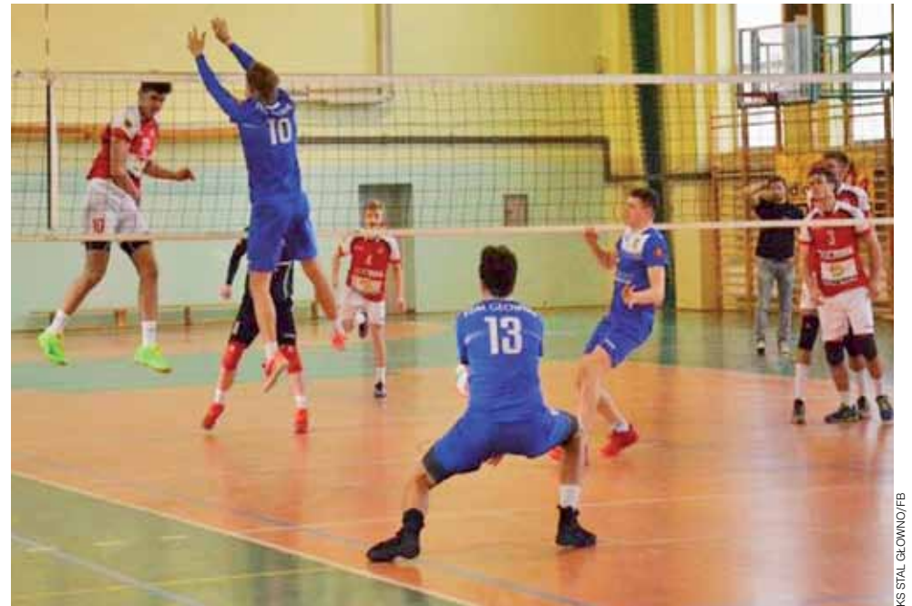
Siatkarze Stali Głowno (niebieskie stroje) nie są jeszcze na tyle doświadczoną drużyną, by walczyć o czołowe miejsca w III lidze. Podopieczni trenera Moszczyńskiego są jednak na tyle zdeterminowani, że to kwestia czasu.