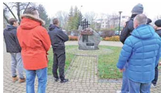
Więźniowie pod pomnikiem na skwerze Solidarności.