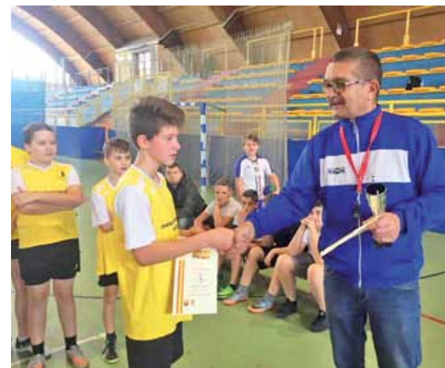
Reprezentanci Szkoły Podstawowej z Dobrej odbierają pamiątkowy dyplom za zajęcie 4. miejsca w powiecie.

Po piłce nożnej, unihokeju i piłce ręcznej uczniowie szkół z gminy Stryków szykują się do kolejnej imprezy. Najbliższa odbędzie się w Zespole Szkół nr 1 w Strykowie, przy ul. Targowej, gdzie odbędzie się Międzyszkolny Turniej Tenisa Stołowego. wp