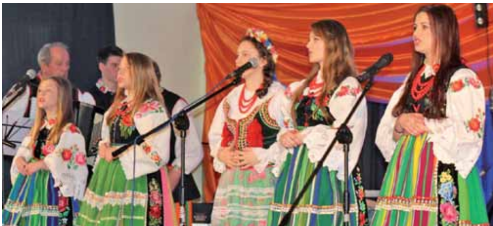
Zespół Mąkolic z kapelą. Występ na Gminnym Dniu Kobiet 2017r.

Żadne źródła historyczne, etnograficzne czy antropologiczne, z którymi miała do czynienia, nie potwierdzają tezy, jaką, jej zdaniem, zbyt niefrasobliwie, snuje autor artykułu.