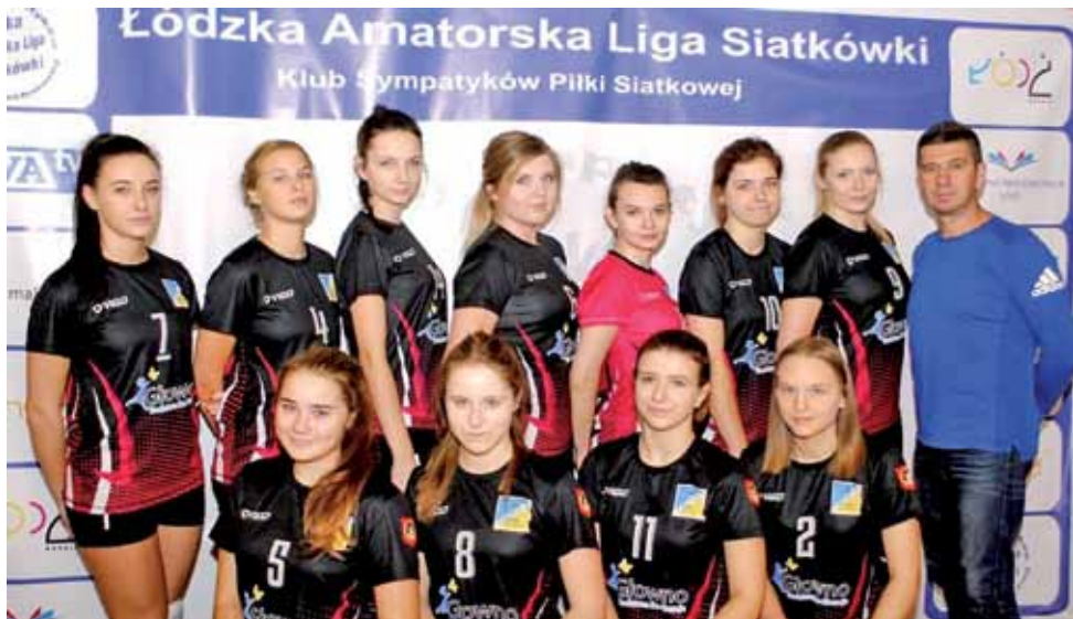
Zespół głowieńskich siatkarek Stali od początku sezonu lideruje w tabeli I Ligi ŁALS Kobiet.

Siatkówka | 6. kolejka I Ligi ŁALS Kobiet