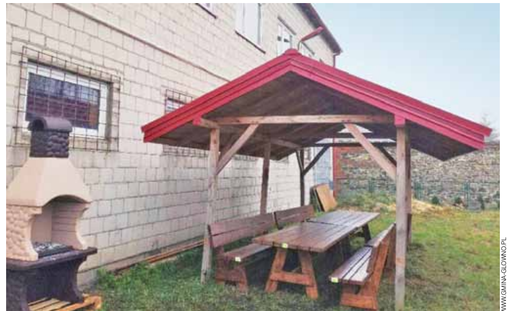
Nowy grill, stoły i ławki. Tak, dzięki marszałkowskiemu grantowi oraz wsparciu gminy, zmienił się teren przy strażnicy OSP w Mąkolicach.

Garnki zakupione do kuchni na pewno zostaną wykorzystane przy organizacji różnych imprez, na przykład zabawy sylwestrowej w strażnicy, jaką planuje przygotować lokalne Koło Gospodyń Wiejskich. Z podobnego wsparcia grantowego w tym roku skorzystało także sołectwo Boczek Do-