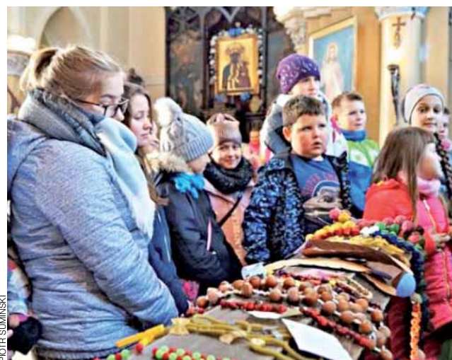
Dzieci biorące udział w konkursie na najładniejszy różaniec przy swoich dziełach.

Do głosowania na pracę plastyczną wykonaną przez dzieci z grupy „Biedronki” w ramach Programu Akademia Aquafresh „Akcja Uśmiech Dziecka” zachęca przedszkole Słoneczko w Łowiczu. Przedszkole liczy, że zdobędzie np. tablicę multimedialną, zestawy zabawek, książek, gier itp. Głosować można do 30 listopada na stronie www.akademia-aquafresh.pl po wyszukaniu hasła „Łowicz”. ewr