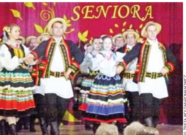
Na ludową nutę. Zespół Kalina w suicie tańców lubelskich.

– Niech jesień życia będzie najlepszym czasem do realizacji niespełnionych dotąd marzeń i zamierzeń oraz właściwego wykorzystania życiowej wiedzy i mądrości. (...) Jesteście widocznymi w naszej gminie. Dzięki wam, waszej pracy, Domaniewice nabierają kolorów