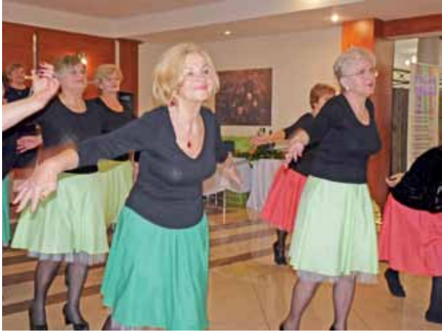
Grupa taneczna z gracją zaprezentowała rumbę, cha-chę i walca angielskiego.