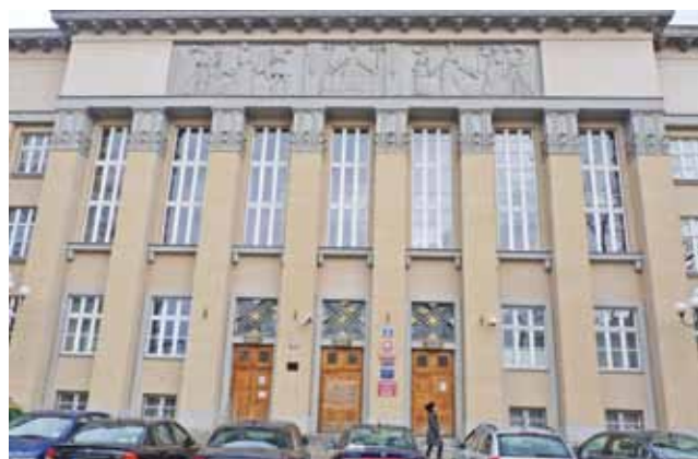
Rozprawa toczyła się w Sądzie Okręgowym od 9 października.