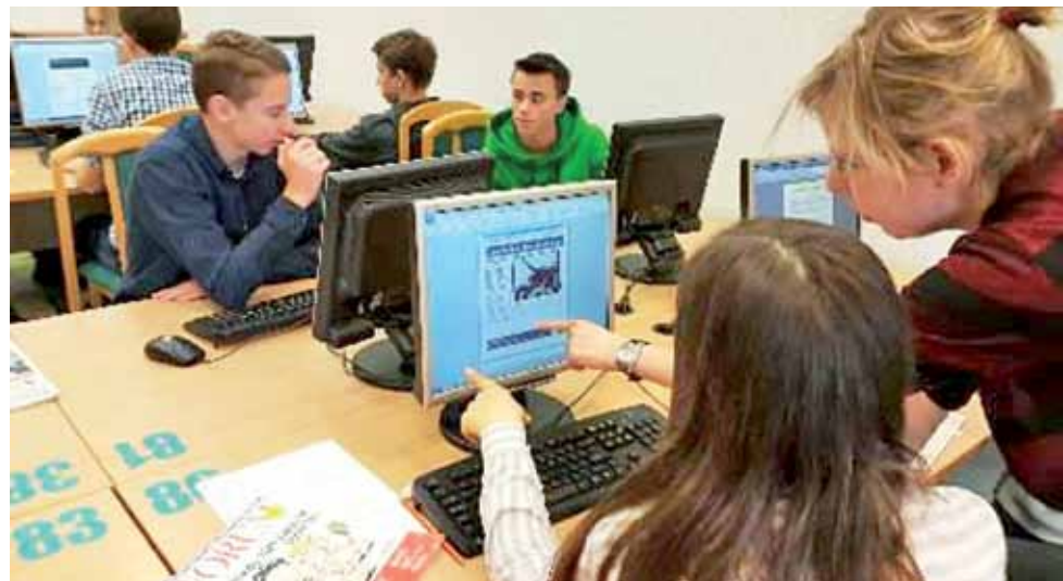
Ciekawe zajęcia w ramach Akademii Licealisty. Uczestnicy warsztatów w programie graficznym tworzyli pierwszą stronę gazety.

Uczniowie za udział w warsztatach zdobyli tego dnia podpisy w swoich Indeksach Licealisty. oprac. ewr