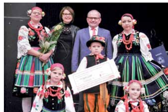
Reprezentacja Kiernożan, gminy i łódzkiego Sejmiku z symbolicznym czekiem.

Prosimy o zamieszczenie i podpisanie klauzuli: „Wyrażam zgodę na przetwarzanie moich danych osobowych zawartych w mojej ofercie pracy dla potrzeb niezbędnych do realizacji procesu rekrutacji (zgodnie z ustawą z dnia 29.08.1997 o ochronie danych osobowych, Dz.U. z 1997r. Nr 133 poz. 883)”.