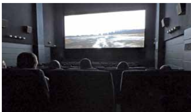
Grupa przychodzi na seanse popołudniowe, gdy kino jest pustawe. Wieczorem przychodzić nie mogą, bo spóźniliby się na apel.

Proponuję takie filmy, które będą prowadziły więźnia do uświadomienia pragnień i potrzeb, a także akceptacji siebie oraz innych.