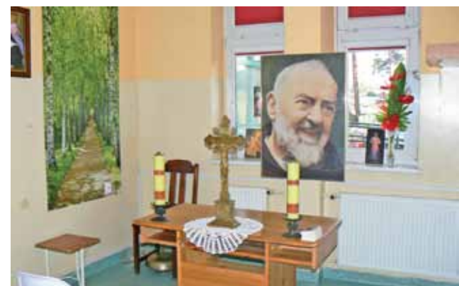
Szpitalna kaplica. Z jednego pomieszczenia na internie udało się wygospodarować miejsce, na którym bardzo zależało pacjentom.