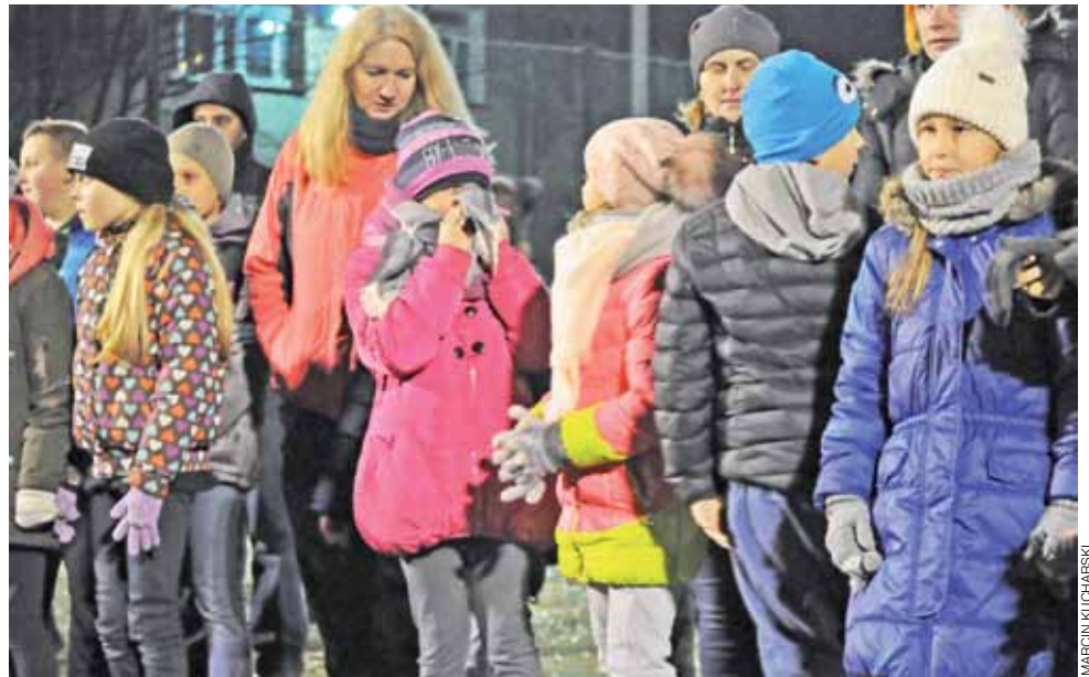
Mimo chłodu impreza odbyła się na Orliku na Korabce.

Zapraszamy do obejrzenia filmu na www.lowicznanin.info .