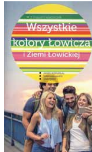
Okładka przewodnika wydanego przez Urząd Miejski w Łowiczu.

Z kolei Joanna Grudzińska została „księżną łowicką” tylko z woli cara Aleksandra I, choć była tylko zwyczajną polską szlach-