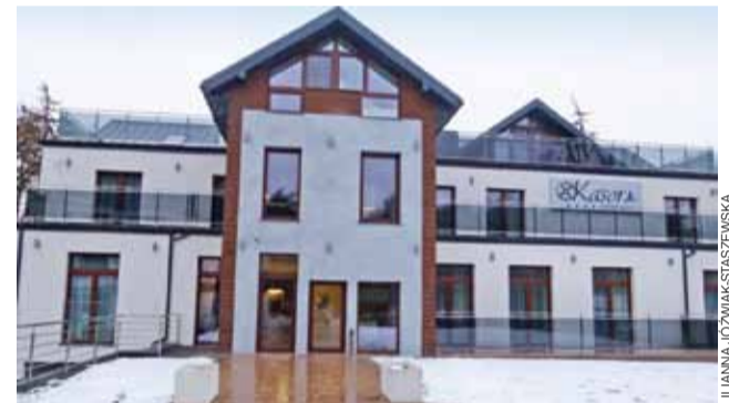
Część hotelowa nowego obiektu. Czy ktoś jeszcze pamięta, że w tym miejscu mieścił się stary ośrodek policyjny?

Woda w zbiorniku na Moszczenicy jest obecnie spuszczone. Zbiornik będzie oczyszczany. W maju przyszłego roku planowane jest uruchomienie na nim pływającej kawiarni. Ostatnia dostawa pontonów już jest na miejscu. W planach jest również umożliwienie korzystania gościom z zewnątrz z tradycyjnych kajaków i rowerów wodnych, ale i nowości w tej okolicy – nart wodnych. Nie zabraknie placu zabaw dla dzieci, a w przyszłości – parku linowego. ■