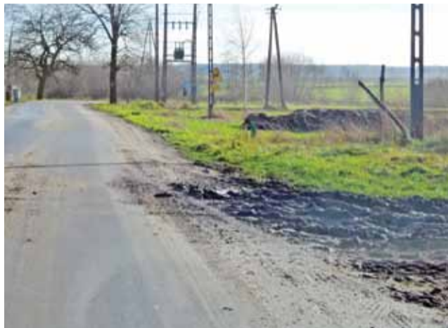
Nowa droga Mąkolice – Wola Mąkolska. W bardzo wielu miejscach przy wyjazdach z pól asfalt zanieczyszczony jest błotem. Stan na 11 grudnia.