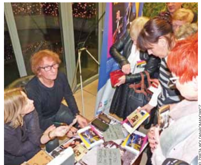
Promocja książki. Zainteresowanie bogato ilustrowaną publikacją, poświęconą zespołowi Trzeci Oddech Kaczuchy, było w Głownie niemałe. Przed i po koncercie po książkę z autografem ustawiała się kolejka.