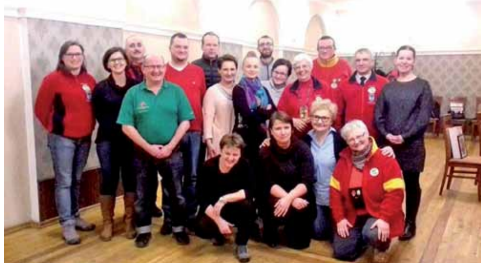
Wspólne zdjęcie na zakończenie egzaminu, nowi przewodnicy w towarzystwie swoich starszych kolegów.

Dotychczas w kole przy oddziale PTTK było nieco ponad 20 przewodników, z czego 10 zajmowało się oprowadzaniem grup. Szymański podkreśla bowiem, że mimo zdanego egzaminu część osób nie jest w stanie przełamać się, aby oprowadzać turystów, część zaś nie podejmuje pracy, ze względu na pracę zawodową i ro-