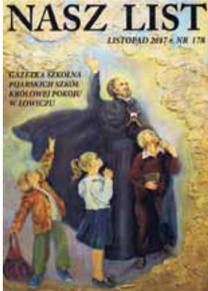
Okladka jubileuszowego wydania szkolnej gazetki.

Wydrukowano 500 egzemplarzy. Otrzymali je wszyscy zaangażowani uczniowie, nauczyciele,