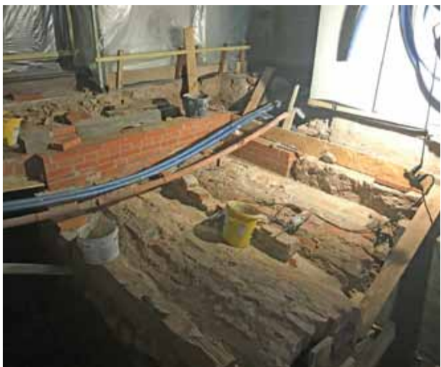
Stan prac w części nawy północnej przed przerwą, spowodowaną koniecznością czekania na usunięcie wilgoci.

Ostatni etap dużej, rozpoczętej w 2015 roku inwestycji diecezji łowickiej, dotyczy prac pod południową nawę bazyliki – pisaliśmy już o nich kilka miesięcy temu. Wcześniej zakończone zostały już podobne działania w nawie północnej. Część północna to przede wszystkim krypty, w południowej będzie można w przyszłości spa-