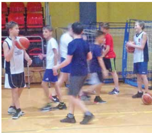
Kolejna edycja SMOK-a rusza w lutym 2018 r.