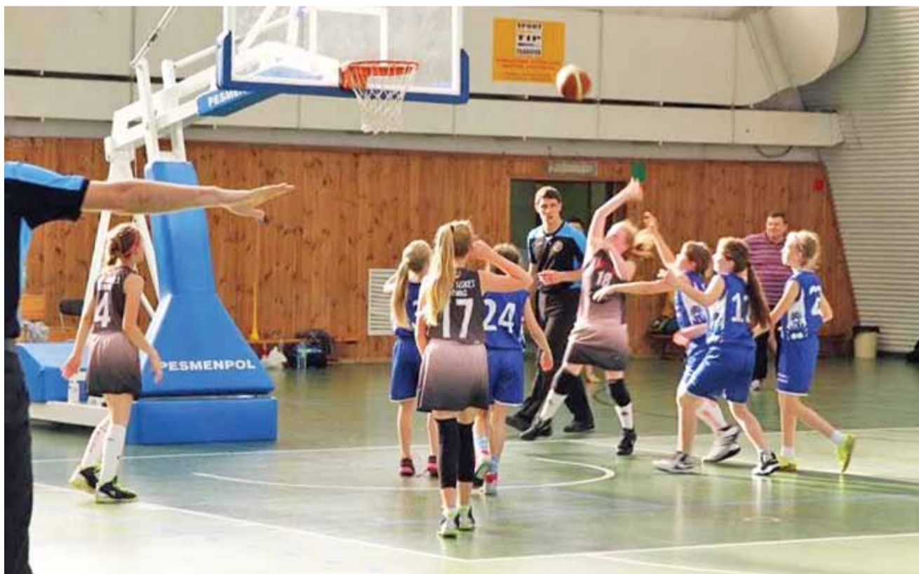
Młode koszykarki Alles Basket Głowno (szare stroje) zakończyły pierwszą część sezonu Wojewódzkiej Ligi Koszykówki do lat 16.