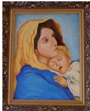
Matka Boska Wędrująca bywa też często nazywana „Cygańską”.