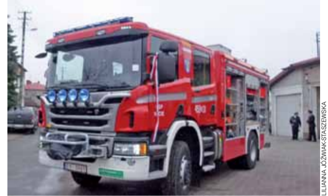
Nowy ciężki samochód ratowniczo-gaśniczy dla jednostki OSP Wicie kosztował 934.800 zł. Scania zastąpi wysłużone IVECO.

niczego Ubezpieczenia Społecznego. Nie sposób nie wspomnieć, że środki na ten zakup pojawiły się również z pomocą Komendanta Głównego PSP. Senator wyraził nadzieję, że pojazd poprawi bezpieczeństwo mieszkańców oraz bezpieczeństwo służby wszystkich strażaków. – Jest to super sprzęt i chcielibyśmy, aby był dobrze używany, ale nie często używany, bo im mniej wyjazdów, tym mniej ludzkich nieszczęść – dodał.