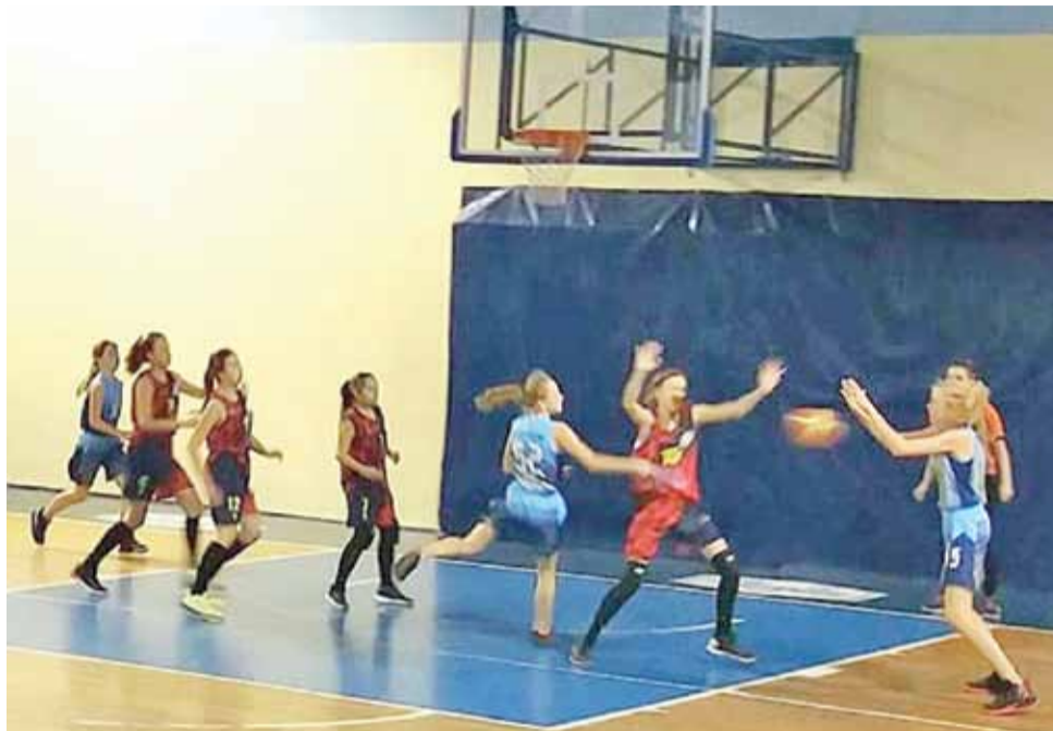
Strykowskie koszykarki (niebieskie stroje) były blisko wygranej, ale ostatecznie przegrały po raz piąty.

Pojedynek z pabianiczkami odbył się w niedzielę, 17 grudnia w sali gimnastycznej przy Szkole Podstawowej w Dąbrówce Dużej. Gospodynie wyszły na boisko zmotywowane i od początku naciskały na PTK. Strykowskie koszykarki nie ustrzegły się jednak drobnych błędów i w pierwszej kwarcie nieznacznie prze-