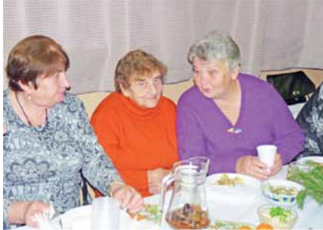
Wigilia parafialna na Korabce to dobra okazja do rozmów.

Zmarła 18 lipca 2015 roku w wieku 86 lat. 22 lipca została pochowana na cmentarzu parafii św. Marcina w Strykowie. tm