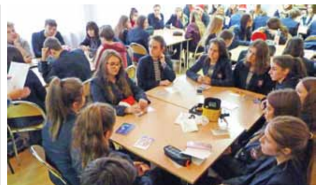
Licealiści za moment zaczęli pisać kartki do chorych dzieci.