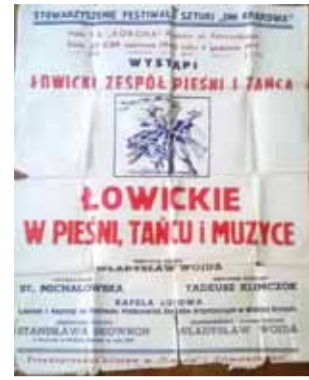
Sukces zespołu i solistki był podkreślany także na plakatach zapowiadających występy w Polsce także rok później.