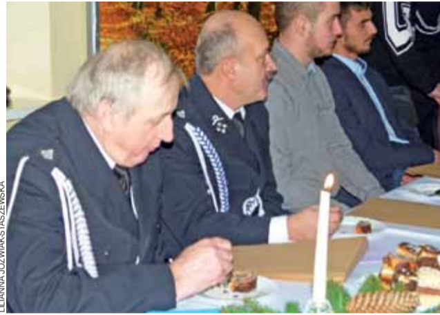
Spotkanie opłatkowe Zarządu Gminnego Związku OSP to już tradycja.

Strażacy myślą też m.in. o organizacji imprez integracyjnych i spotkań. Będą szukać nowych źródeł pozyskiwania środków na ten cel. Pod uwagę brane są m.in. granty z LGD Ziemia Łowicka. ljs