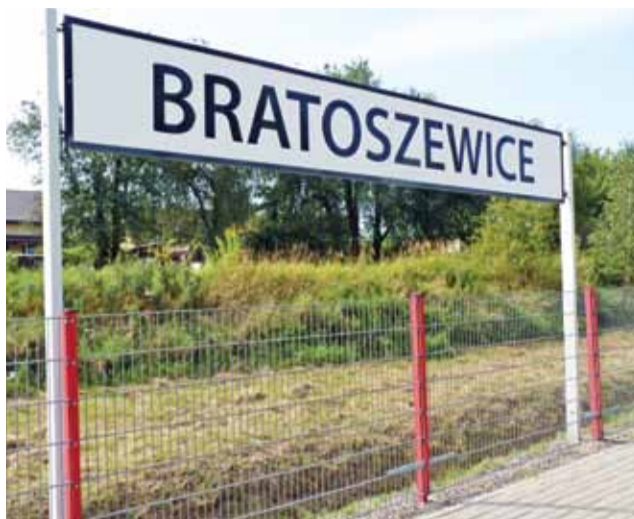
W Bratoszowicach w tym roku wiele się dzieje. Wspomagana przez gminę inwestycja w ul. Kolejową stała się tematem ożywionej dyskusji komisji budżetu, która zebrała się 23 listopada.

Ponadto, jak wyjaśniła naczelniczka Grażyna Popczyńska, ostatni