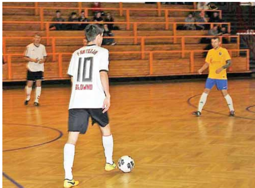
Zawodnicy Fantazji Głowno tym razem nie mieli powodów do zadowolenia.

Po raz piątą w tym sezonie nie powiodło się z kolei zawodnikom z Głowna. Fantazja uległa wysoko Kancelarii Bosh Centrum Tor-Rem z Bełchowa, która do tej