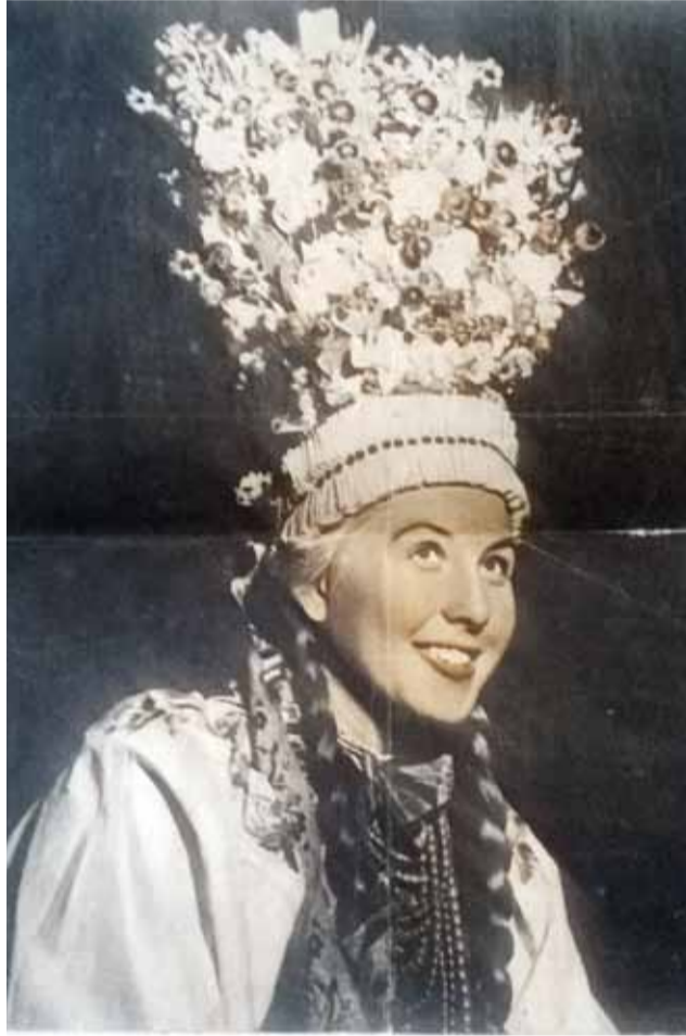
W Walii wystąpiła jako panna młoda w weselu łowickim, w pięknym czepcu.

Jak odczytaliśmy właśnie z ówczesnej prasy, 3-tysięczne miasteczko Llangollen w czasie trwania festiwalu żyło innym życiem, ponieważ na imprezę przyjeżdżało około 1,5 tysiąca członków różnych grup i nie mniej osób zasiadało na widowni. Występy od-