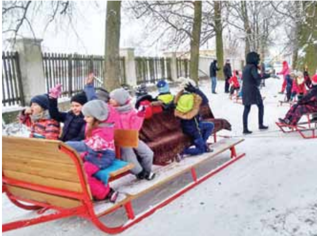
Zimą Stajnia u Kowala zaprasza na kuligi. Mogą wziąć w nich udział zarówno dzieci jak i dorośli. Droga wiedzie przez Puszcę Bolimowską.