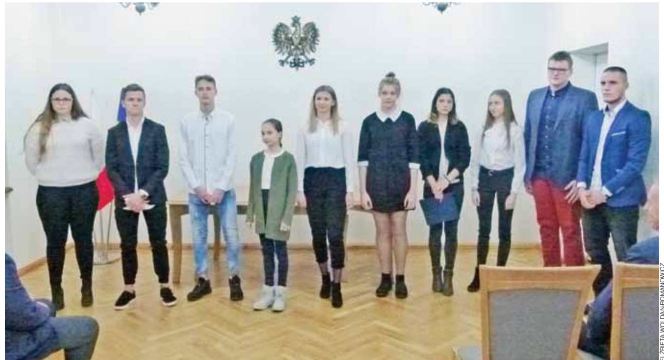
Mistrzowie rodem z Głowna. Znakomici sportowcy, odnoszący sukcesy w różnych dyscyplinach, zostali docenieni przez władze miejskie.

Spotkanie zakończyło się poczęstunkiem, na który zaproszono uczestników po zakończeniu oficjalnej części uroczystości. ewr