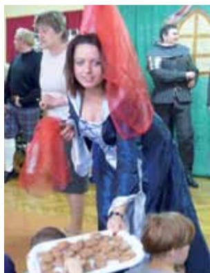
Po zakończeniu przedstawienia wróżki częstowały widzów pierniczkami.

Wszyscy zgodnie podkreślali, że próby to forma dobrej zabawy