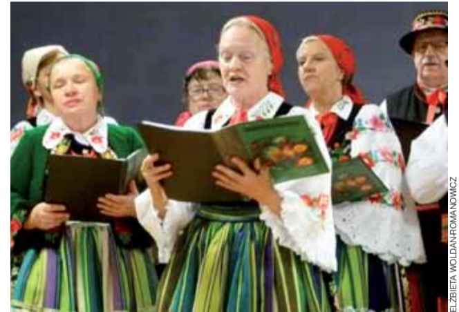
Kolędowanie na ludową nutę. Zespół śpiewaczy Ksiazki wystąpił na gminnej wigilii w Bielawach.

Po występie Ksiazków uczestnicy gminnej wigilii podzielili się opłatkiem i zasiedli do tradycyjnej wieczerzy. Na stole nie brakło zupy grzybowej, pierogów i kroketów, kompotu z suszu, smażonych ryb, kilku rodzajów przystawek, sałatek i ciast. ewr