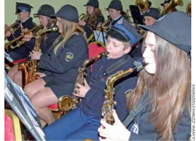
Dziecięco-młodzieżowa orkiestra dęta to chluba OSP Wicie. Muzycy swoim graniem uprzyjemnili sobotnie spotkanie w remizie.