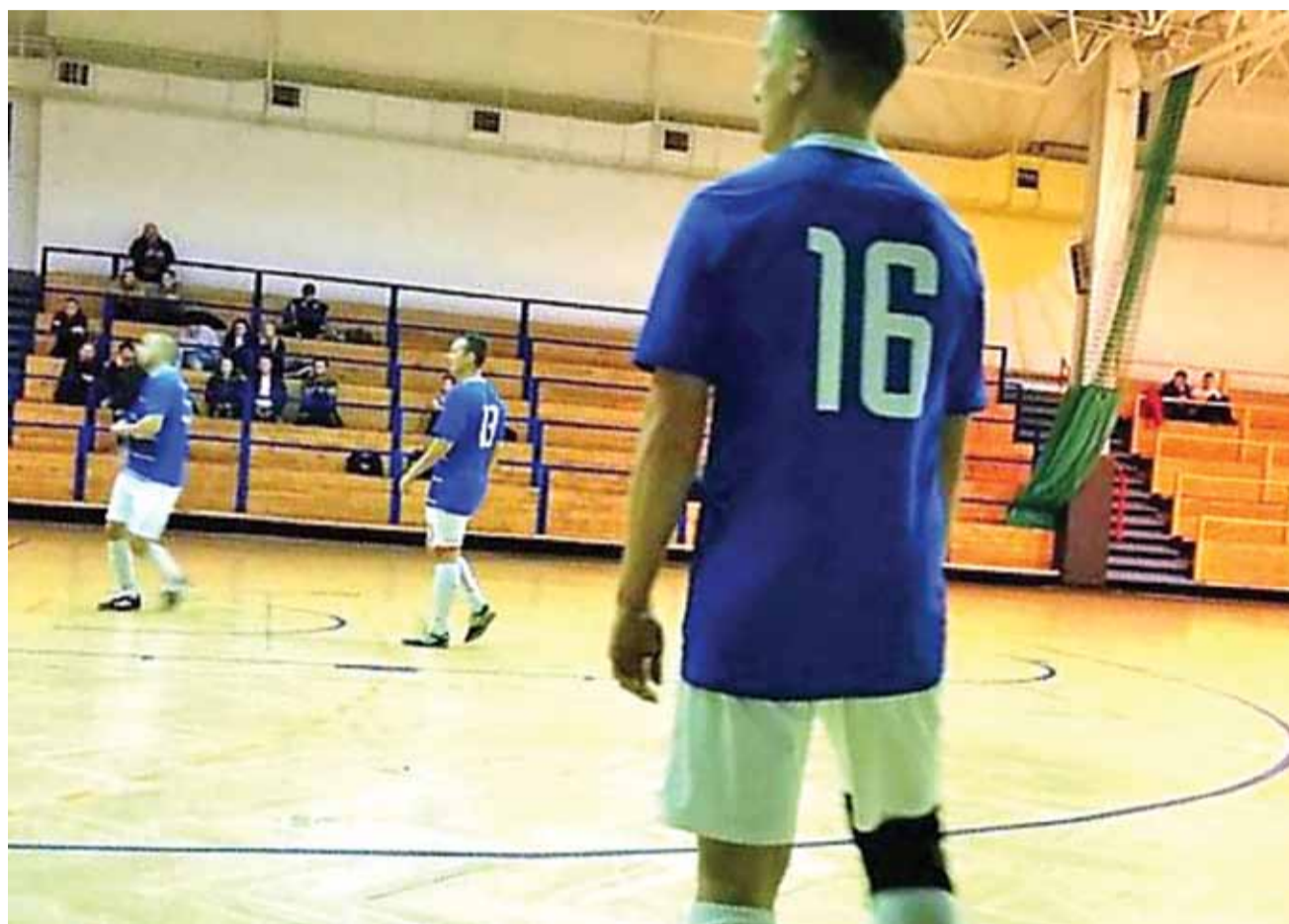
Błękitni Dmosin są na dobrej drodze do awansu w rozgrywkach III Zina Łowickiej Ligi Futsal.