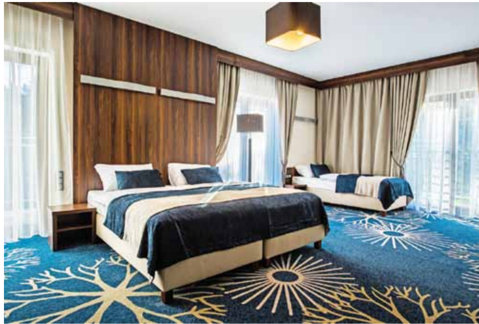
Część hotelowa złożona jest z 17 apartamentów, w tym 2 rodzinnych.