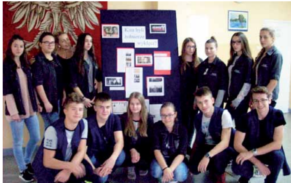
Uczniowie uczestniczący w projekcie edukacyjnym w Kiernozi.

Co będą robili uczniowie w ramach projektu? Otóż w czwartek, 14 grudnia, o godz. 11.00, w szkole odbył się apel poświęcony losom żołnierzy wyklętych. – To apel filmowo-poetycki. Część uczniów przygotowała około 15-20 minutową prezentację z podkładem muzycznym – coś w rodzaju filmu na ten temat, zaśpiewają utwór Mako-