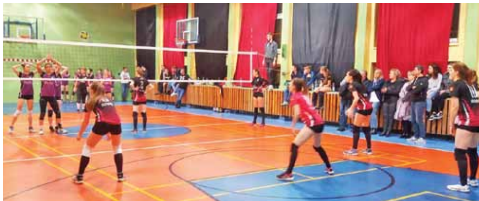
Głownianki (czarno-czerwone stroje) po raz pierwszy zagrały w hali Gimnazjum Miejskiego.

Na szczęście głownianki nie przejęły się niepowodzeniem i w czwartej partii zagrały niemal