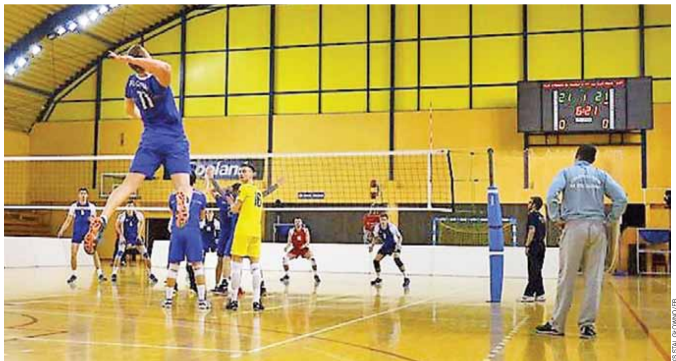
Efektowne ataki siatkarzy Stali nie wystarczyły do odniesienia zwycięstwa w Spale. Głównianie zawodnicy mogą jednak być zadowoleni ze swojej postawy, bowiem rozegrali dobre zawody.

W tabeli III Ligi prowadzi ULKS MOSiR Sieradz, który w minionej kolejce doznał pierwszej porażki po dramatycznej i pasjonującej walce z LUMKS Kasztelan Rozprza 2:3. W rozgrywkach nie ma zatem niepokonanych drużyn,