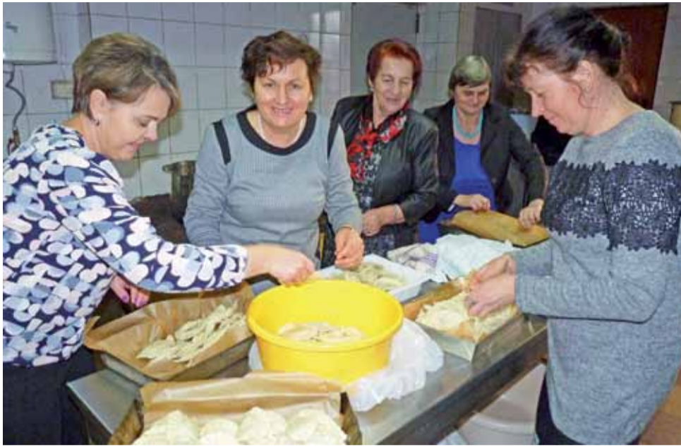
Na chwilę przed rozpoczęciem spotkania w Oszkowicach praca w kuchni wre. Panie z miejscowego koła przygotowują pierogi do rozgrzania.

– Nasza opowieść łączy w sobie elementy tradycyjne i współczesne. Ja i moje przyjaciółki wcielamy się w pasterzy, którzy będą strzec żłobka, nawet przy użyciu pistoletów. Będzie trochę zabaw-