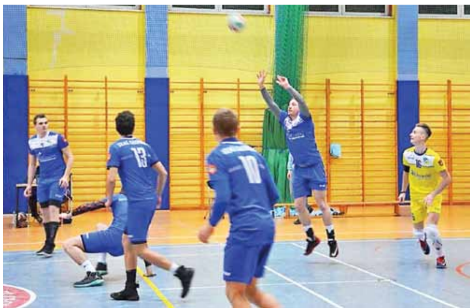
Drużyna z Główna w obecnych rozgrywkach jest mistrzem w wygrywaniu pierwszego seta.

ale jest zespół bez żadnego zwycięstwa. Na ostatniej pozycji z dorobkiem zaledwie 1 pkt. plasuje się MUKS Juwenia Rawa Mazowiecka. I to właśnie z tym zespołem Stal zagra w następnej kolejce w piątek, 5 stycznia u siebie w Hali Sportowo-Widowskiej przy ul. Andersa 37 w Głównie. Podopieczni trenera Marcina Moszczyńskiego są faworytem tego meczu, bowiem z dorobkiem 13 pkt. plasują się na dobrym 6. miejscu. wp