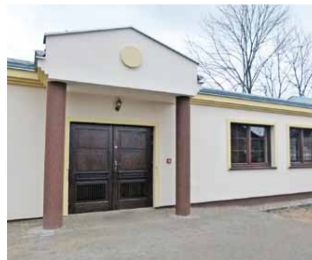
Nowy budynek nawiązuje nieco w stylistyce do wyglądu pałacu.