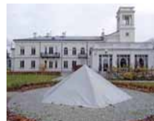
Fontanna zabezpieczona przed zimą.

Fontanna nie jest zabytkowa, została jednak w 2014 roku odrestaurowana (na podstawie rycin oraz zapisów) na wzór tej, której