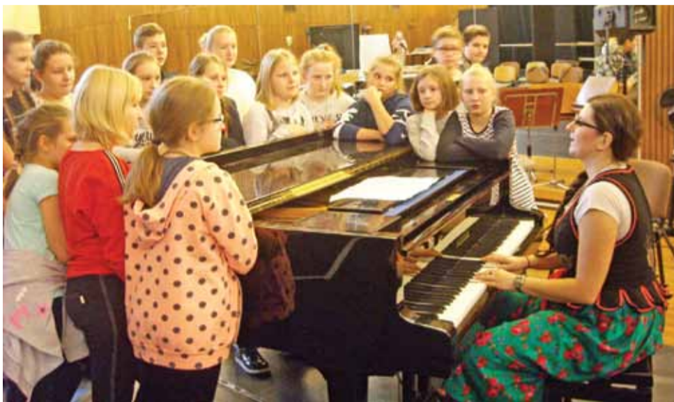
Lekcja śpiewu operowego. Zajęcia wokalne dla Szkolnego Koła Artystycznego z Popowa w ramach warsztatów w Teatrze Wielkim w Łodzi.

Nagromadzone przez lata pracy z młodzieżą doświadczenia i refleksje posłużyły nauczycielkom do opracowania programu pracy koła dla uczniów klas IV-VII