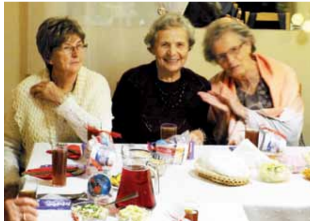
Uczestnicy spotkania złożyli sobie życzenia łamiąc się opłatkiem i zasiedli do stołu zastawionego wigilijnymi potrawami