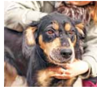
Lucky. Pies – narrator filmowej opowieści o remontowych potrzebach przytuliska w Głównie.

W ubiegłym tygodniu Towarzystwo Przyjaciół Zwierząt „Arkadia” w Głównie zainicjowało zbiórkę pieniędzy na budowę murowanego budynku i boksów dla psów przebywających w miejskim przytulisku na ul. Piaskowej.