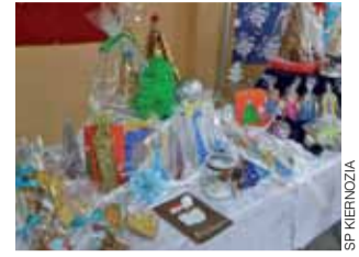
Kiermasze w holu stają się szkolną tradycją.

Pod hasłem „Ciasteczkowy zawrót głowy” uczniowie i rodzice związani ze Szkołą Podstawową w Kiernozi przygotowali świąteczny kiermasz.