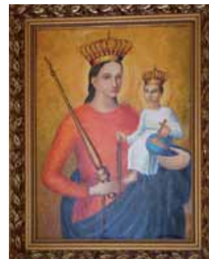
Jednym z ulubionych obrazów malarza jest Matka Boska Kocierzewska.

A wszystko zaczęło się jakieś 15 lat temu, kiedy postanowił odnowić swoją własną skrzynię. Teraz wykonuje je już na zamówienie, ostatnio dla jednej rodziny pomalował ich aż trzy.