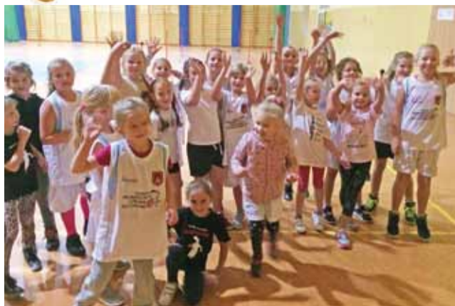
Dziewczęta i chłopcy ze szkół podstawowych chętnie biorą udział w bezpłatnych zajęciach koszykówki