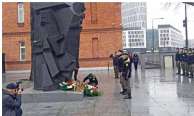
Kadeci udali się pod pomnik upamiętniający żołnierzy poległych w misjach i operacjach wojskowych.

W czasie pobytu kadetów z Bratoszewic w Sali Tradycji odbyło się uroczyste przekazanie przez pod-