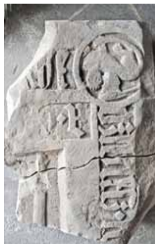
Fragment późnogotyckiej płyty nagrobkowej – jedno z najciekawszych odkryć w tej części podziemi katedry.

Na ten moment wykonane zostały już zabezpieczone ściany i stropy w kryptach i na korytarzu. Wykonane zostały przygotowania do położenia posadzki, ale zanim pracownicy do tego przystąpią, konieczne jest osuszenie i wentylacja podziemi – z tego powodu prace zostały wstrzymane, cały czas działają natomiast osuszające urządzenia. Panująca wewnątrz wilgoć jest utrudnieniem,