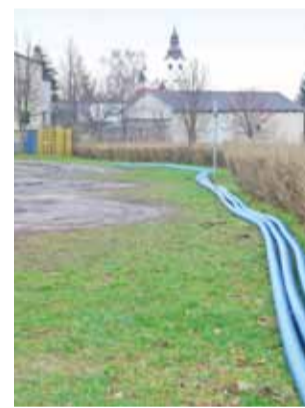
Inwestycja na ulicy Legionów