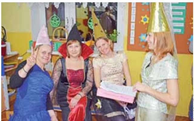
Za kulisami podczas generalnej próby, dzień przed przedstawieniem. Jak widać – panowały dobre nastroje.

W dniu imienin świętego Mikołaja – który notabene po przedstawieniu osobiście pojawił się w przedszkolu z prezentami – wszystko było dopięte na ostatni guzik. Dzieci wpatrywały się w scenę (a właściwie po prostu wydzieleny z sali kawałek podłogi) z prawdziwym zainteresowaniem, w skupieniu, momentami jakby faktycznie zaszarowane. Tylko momentami niektórym wyrwało się na głos: „To moja mama!”, „Teraz mój tata!”.