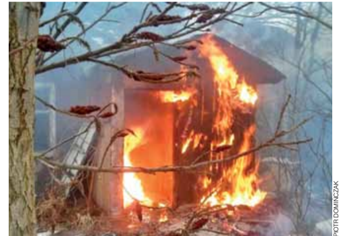
Pożar bardzo szybko się rozprzestrzenił. Człowiek spał właśnie w miejscu, w którym wybuchł największy ogień. Prawdopodobnie zginąłby, gdyby pomoc nadeszła kilka minut później.