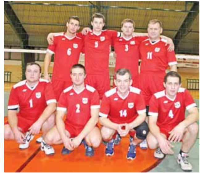
Ekipa z LKS Retki ma w tym roku szansę na mistrzowski tytuł