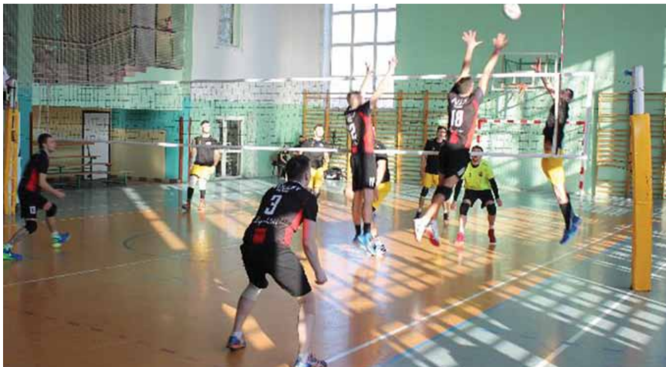
Przegany mecz Volley Team Żychlin z gospodarzem 9. kolejki - Volleyball Głowno wynikiem 3:0.