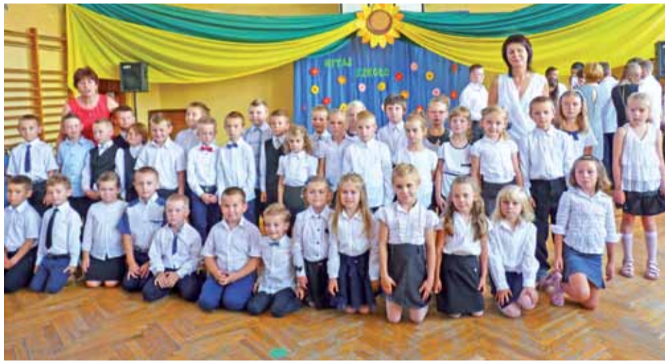
W najlepszej sytuacji jest gmina Pacyna, bowiem tam w roku szkolnym 2015/2016 naukę w I klasie zaczęło 39 dzieci, większość to 7-latkowie. Aż 39 rodziców w ubiegłym roku przyniosło odroczenia, co oznacza, że w tym roku uda się utworzyć dwie pierwsze klasy.

Wstępnie szacujemy, że być może uda się nam utworzyć jedną pierwszą klasę w jednej szkole, do której będą chodzić dzieci z trzech obwodów.