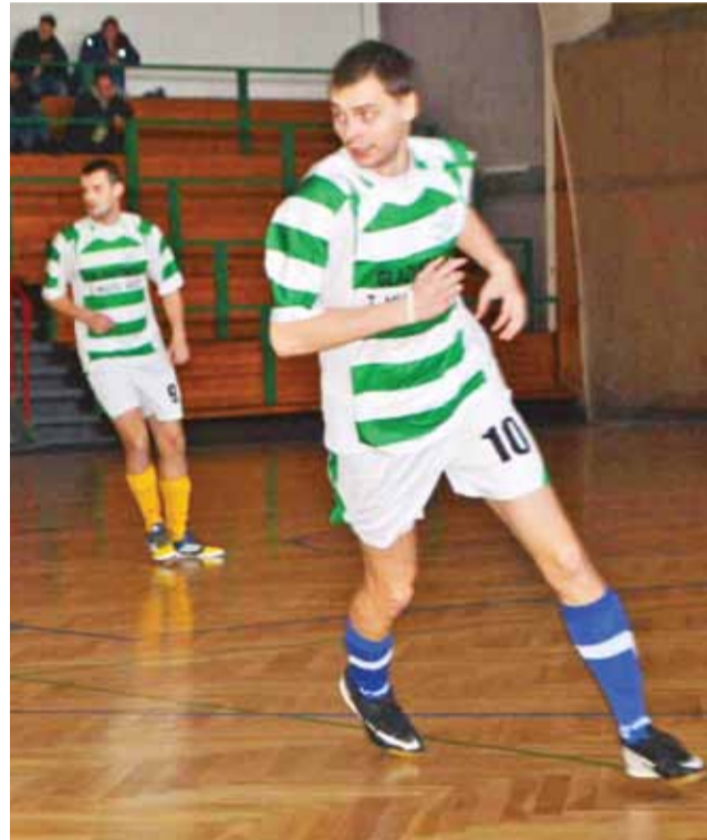
Sobotnie spotkanie ligi futsalu Gladiatorzy z Miasta Noży kontra Bez Nazwy Łowicz, wygrane dla drużyny z Żychlina 4:3.