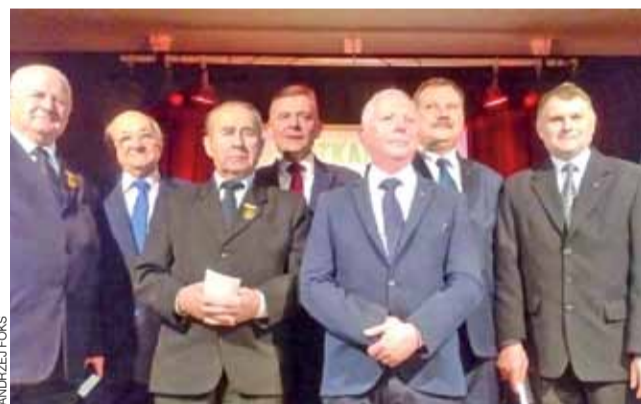
Organizatorzy spotkania oraz odznaczeni działacze ludowi na scenie Gminnego Domu Kultury w Zdunach.

Próby dociekania, dlaczego tak się stało, pozostały bez echa, podobnie jak pytania o to, co przemawiało za zmianą dotychczasowego zarządu. Co do pytania o wynik finansowy Stadniny Koni Walewice za rok 2015, to ANR odpowiada, że będzie on znany dopiero po zatwierdzeniu sprawozdania finansowego przez biegłego rewidenta, a więc za kilka miesięcy. ■