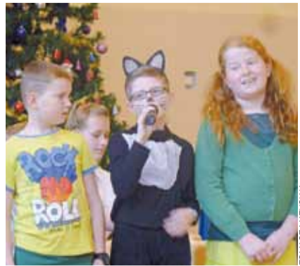
Opowieść o niesfornym Jasiu , jego siostrze Małgosi, kocie i innych członkach rodziny była jednym z elementów programu artystycznego.