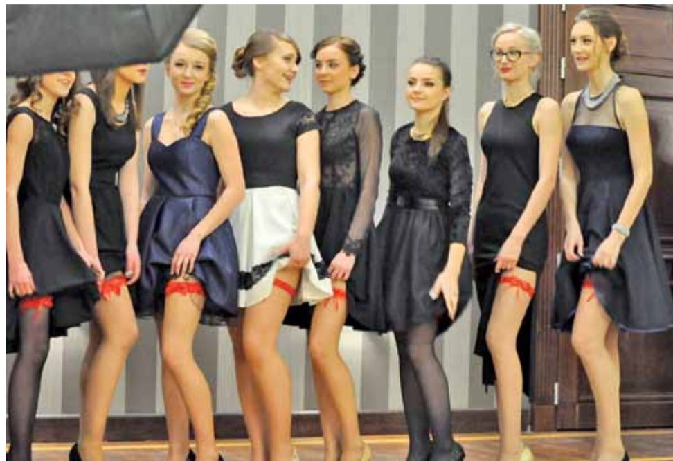
Dziewczyny z klasy III d w czasie sesji zdjęciowej towarzyszącej studniówce, prezentują czerwone podwiązki.