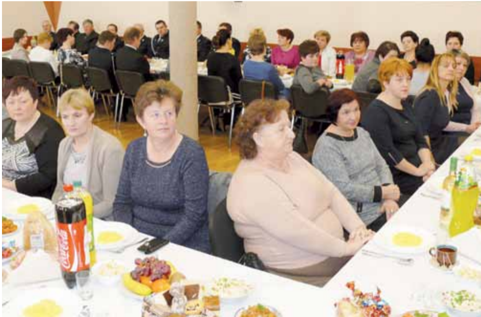
W noworocznym spotkaniu w bibliotece udział wzięło około 70 osób, głównie pań z KGW z terenu gminy Kocierzew Południowy.

Do Kocierzewa z całej gminy zjechały przedstawicielki wszystkich działających na jej terytorium 14 kół. Za stołami wraz z zaproszonymi gośćmi: przedstawicielkami OSP, przedstawicielkami organizacji z gmin: Chańsko, Zduny, Kiernozia, Nieborów i Bielawy, zasiadło prawie 70 osób. W spotkaniu udział wzięły także prze-