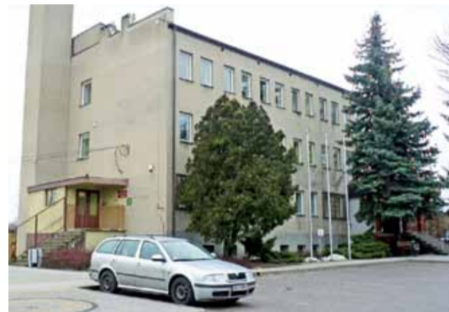
Wkrótce rozpocznie się długo przygotowywany kompleksowy remont budynku Urzędu Gminy Żychlin wraz z termomodernizacją, remontem wewnątrz pomieszczeń oraz fotowoltaiką.

Eksperti już się wypowiedzieli i wskazali, co należy jeszcze uzupełnić – mówiła podczas komisji 25 stycznia Edyta Ledzion, przygotowująca wnioski unijne. – Ponieważ zależy nam na czasie, przyjmujemy dokument w dotychczasowej postaci, a w międzyczasie będziemy go korygować, co ostatecznie też rada będzie musiała przyjąć. Bez tego dokumentu nasz wniosek o unijne dofinansowanie odpadłby już na wstępie z powodu braków formalnych.