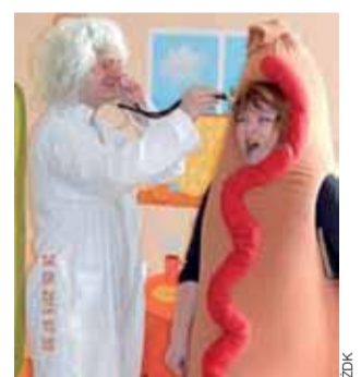
Widowisko teatralne w domu kultury pt. „Mniam, mniam” o zdrowym odżywianiu obejrzały uczniowie klas IV-VI.

W humorystyczny sposób opowiadali, dlaczego ważne jest zdrowe odżywianie, jakie konsekwencje niesie ze sobą nieprzestrzeganie zasad prawidłowego żywienia i stosowanie używek. dag