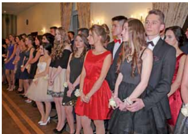
Uczniowie klasy IIIc czekają na rozpoczęcie części uroczystości na którą składał się program artystyczny, życzenia i podziękowania.