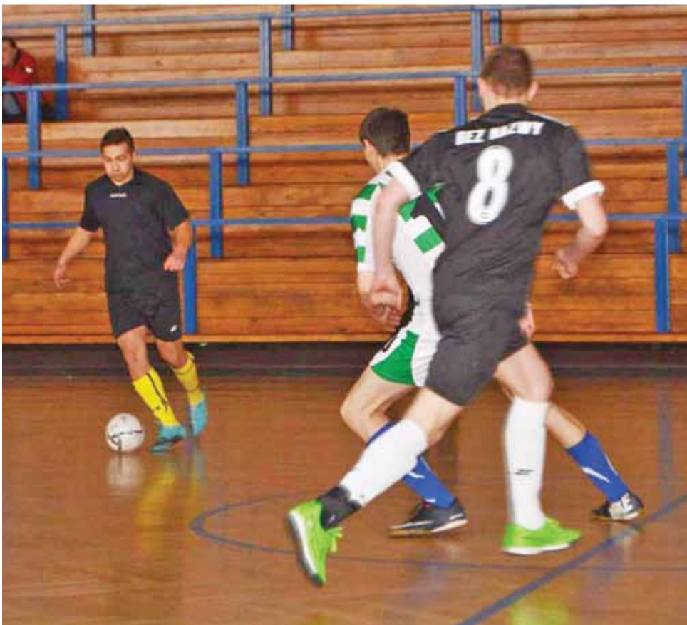
Walka o każdą piłkę w spotkaniu 9. kolejki łowickiej ligi futsalu pomiędzy Gladiatorami a Bez Nazwy Łowicz.