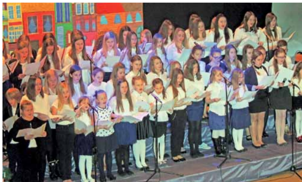
Połączone chóry Allegro i Con Fuoco podczas koncertu noworocznego w Żychlińskim Domu Kultury.

Projekt będzie realizowany do końca czerwca. Teraz podopieczni MOS wraz z wychowawcami opracowują budżet projektu, planują, co mogą zakupić za pieniądze z grantu. W ramach projektu przewidziano też warsztaty fotograficzne, podczas których profesjonalści będą uczyć jak robić zdjęcia, by były one ciekawe. Tak więc wkrótce podopieczni MOS będą wędrować po mieście z aparatem fotograficznym i będą utrwalali miejsca i najciekawsze wydarzenia. – Najlepsze fotografie wywołamy i zrobimy wystawę. Chcielibyśmy, aby obejrzało ją wielu mieszkańców Żychlina – dodaje dyrektor ośrodka. dag