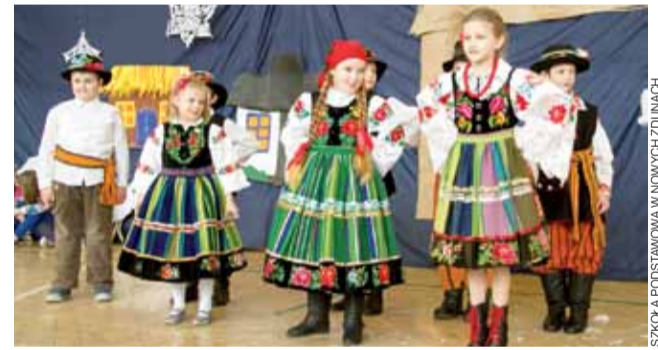
Uczniowie klasy II A śpiewali i tańczyli po łowicku.