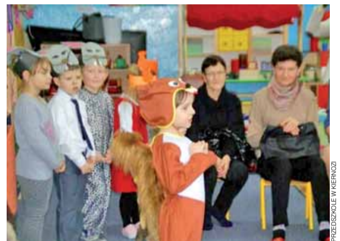
Przedszkolaki chętnie występowały przed babciami i dziadkami.

Zaproszeni na spotkania seniorzy mieli okazję podziwiać swoje wnuczka w krótkich programach artystycznych. Na scenie pojawiały się księżniczki, motylki, pszczołki, niedźwiadki, wiewiórki, zajączki i inne zwierzęta. Każdy z przedszkolaków miał przygotowaną niespodziankę – był to okolicznościowy