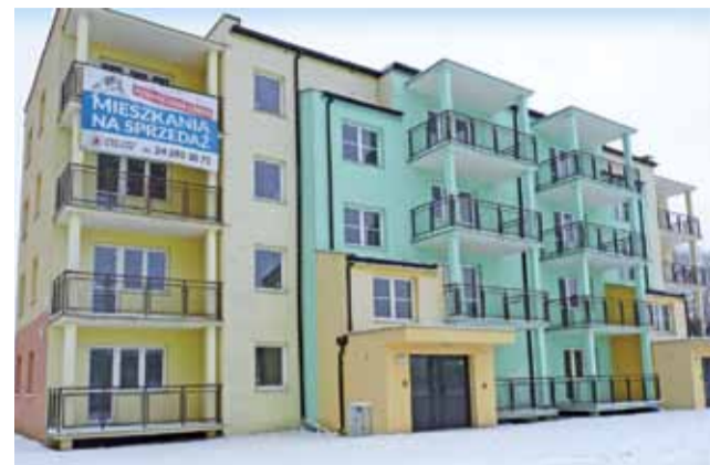
Po półtora roku w bloku po dawnym TBS sprzedano dopiero 2 mieszkania w stanie deweloperskim, a kolejne 3 wylicytowano w przetargu. Póki co, na razie nikt w bloku nie mieszka fot.

Do tej pory Urząd Gminy w Żychlinie sprzedał dwa mieszkania o powierzchni 67,85 metra kwadratowego za kwotę 156.110 zł