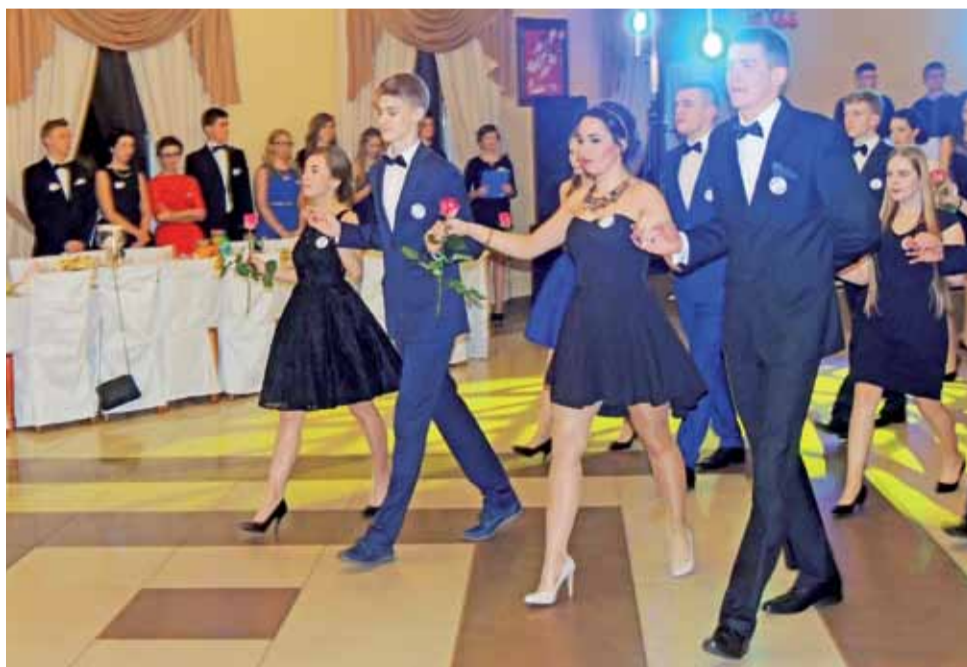
Polonez pokazowy w wykonaniu uczniów LO im. Bohaterów Września 1939 roku.