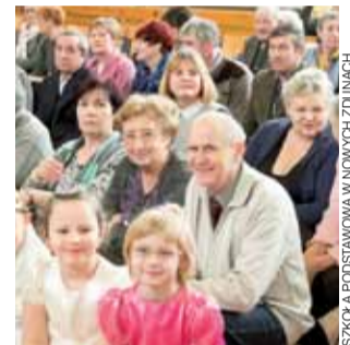
Na widowni zasiedli dziadkowie i babcie, w pierwszym rzędzie dzieci biorące udział w występach.

Po jasełkach przed gośćmi występowały dzieci z grup przedszkolnych, które zaśpiewały piosenki o babci i dziadku, następnie dzieci z „zerówek” tańczyły m.in. rock and roll’a. Uczniowie klas I-III recytowali wiersze i śpiewali piosenki, a także tańczyli. I A wykonała menueta, I B – trójaka,