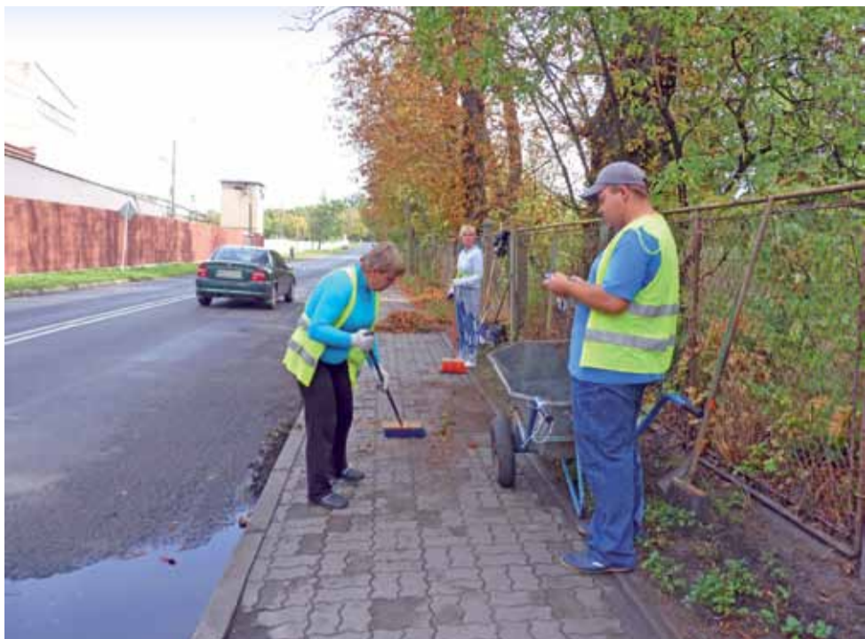
W 2015 roku w ramach różnych form zatrudnienia przez UG Żychlin pracowało – 128 osób. W 2016 roku gmina planuje zatrudnienie 150 osób.

Powiat kutnowski | Stopa bezrobocia spada z każdym rokiem