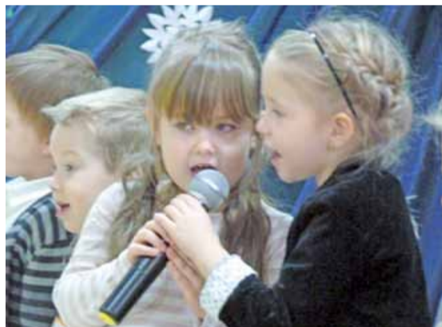
Wnukowie i wnuczki śpiewali zarówno chórem, w duetach, jak i solo.

Potem prezentowały się klasy I-III szkoły podstawowej, prezentując adekwatne do okazji wierszyki i piosenki, śpiewane solo, jak i chórem. Za program artystyczny odpowiedzialne były wychowawczynie poszczególnych grup i klas. Po tej części uroczystości nadeszła chwila,