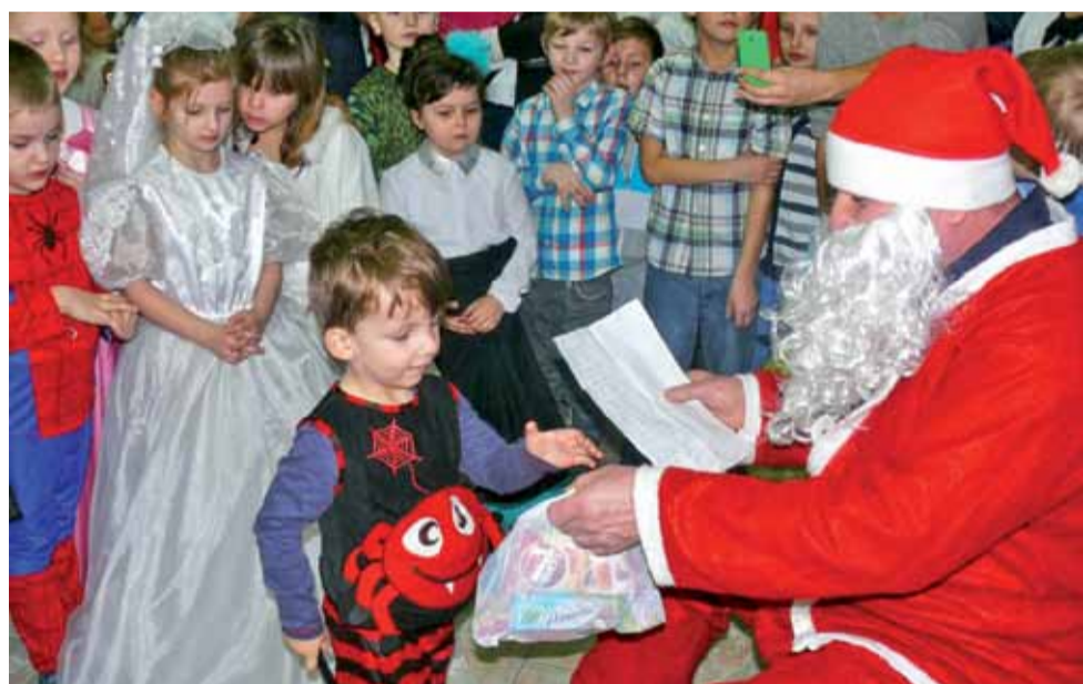
Do dzieci ze Szczytu przyszedł Mikołaj i rozdawał paczki, ku radości maluchów.