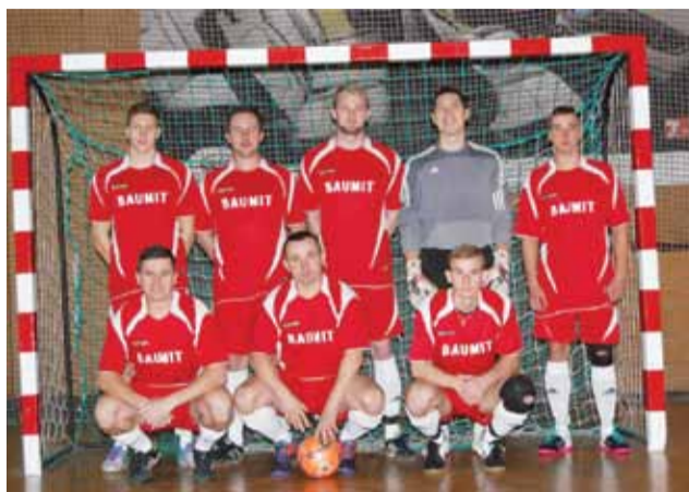
Baumit stracił gola w ostatniej minucie i przegrał 0:1