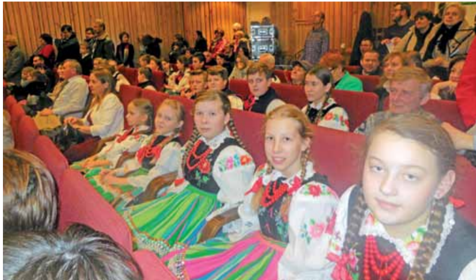
Koderki w oczekiwaniu na wyniki festiwalu w Teresińskim Ośrodku Kultury.

W tym roku było wyjątkowo dużo formacji ludowych i zespołów. Jury starało się wybrać tych,