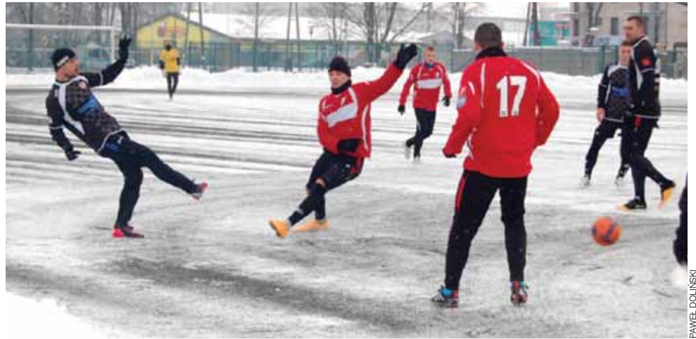
Gdy na placu gry w barwach Pelikana pojawili się młodzi gracze, ŁKS zdecydowanie przejął inicjatywę i zdobył w 10 minut aż trzy bramki.