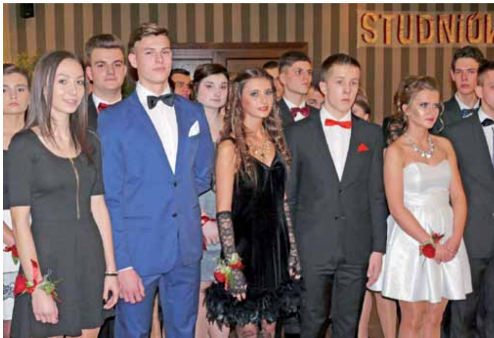
Uczniowie klasy IIIb.