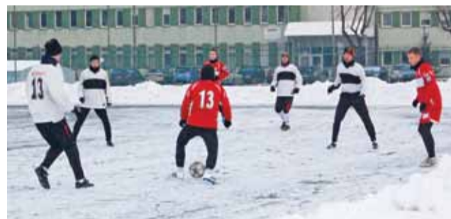
W meczu z Mszczonówianką swoje umiejętności mogli pokazać przede wszystkim gracze ofensywni.