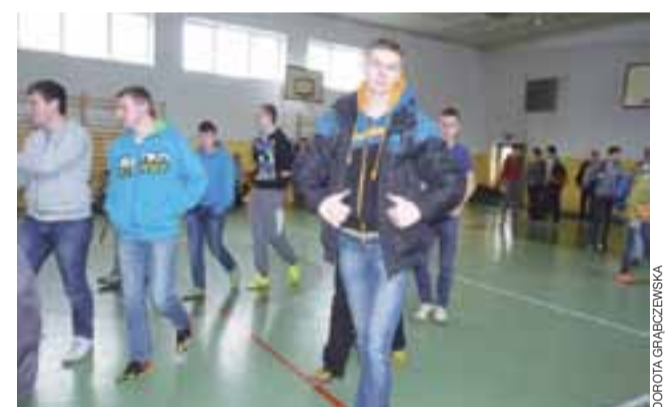
Uczniowie z ZS w Żychlinie wysłuchali wykładu na temat przyczyn agresji i brutalizacji życia wśród nastolatków. Dowiedzieli się, że uśmiech często łagodzi stresowe sytuacje.