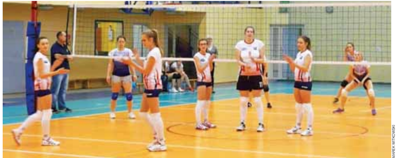
Spotkanie 12. kolejki Ekstraklasy ZS Żychlin kontra Staszic Kutno, zakończone wygraną siatkarek z Żychlina 2:0.

■ Staszic Kutno – ZS Żychlin 0:2 (9:25, 8:25)