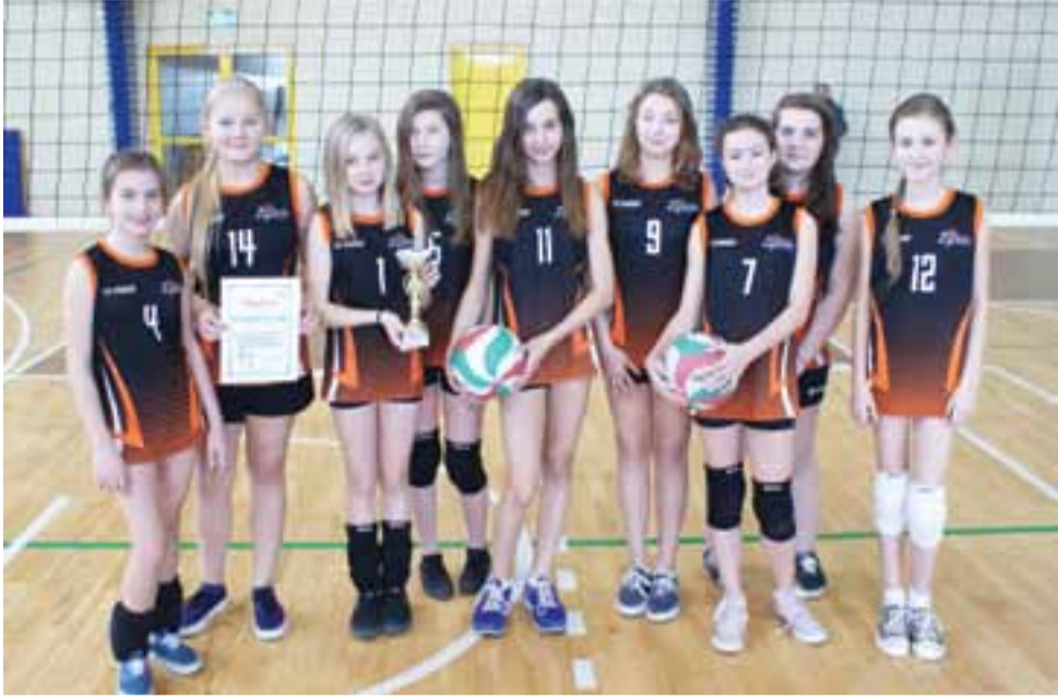
Representacja dziewcząt SP Nr 2 Żychlin podczas Finału Mistrzostw Powiatu w mini piłce siatkowej.