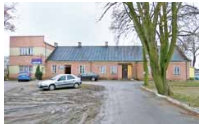
W ramach rewitalizacji centrum Zdun wyburzony będzie widoczny w tle parterowy budynek. Pomiędzy Urzędem Gminy a Domem Kultury powstaną parkingi, nowe ścieżki i zieleń.