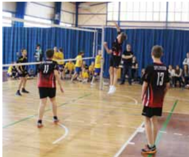
Jeden z wtorkowych meczów siatkarskich reprezentacji chłopców.

Nowy Łowiczanie Tygodnik Ziemi Łowickiej członek Stowarzyszenia Gazet Lokalnych