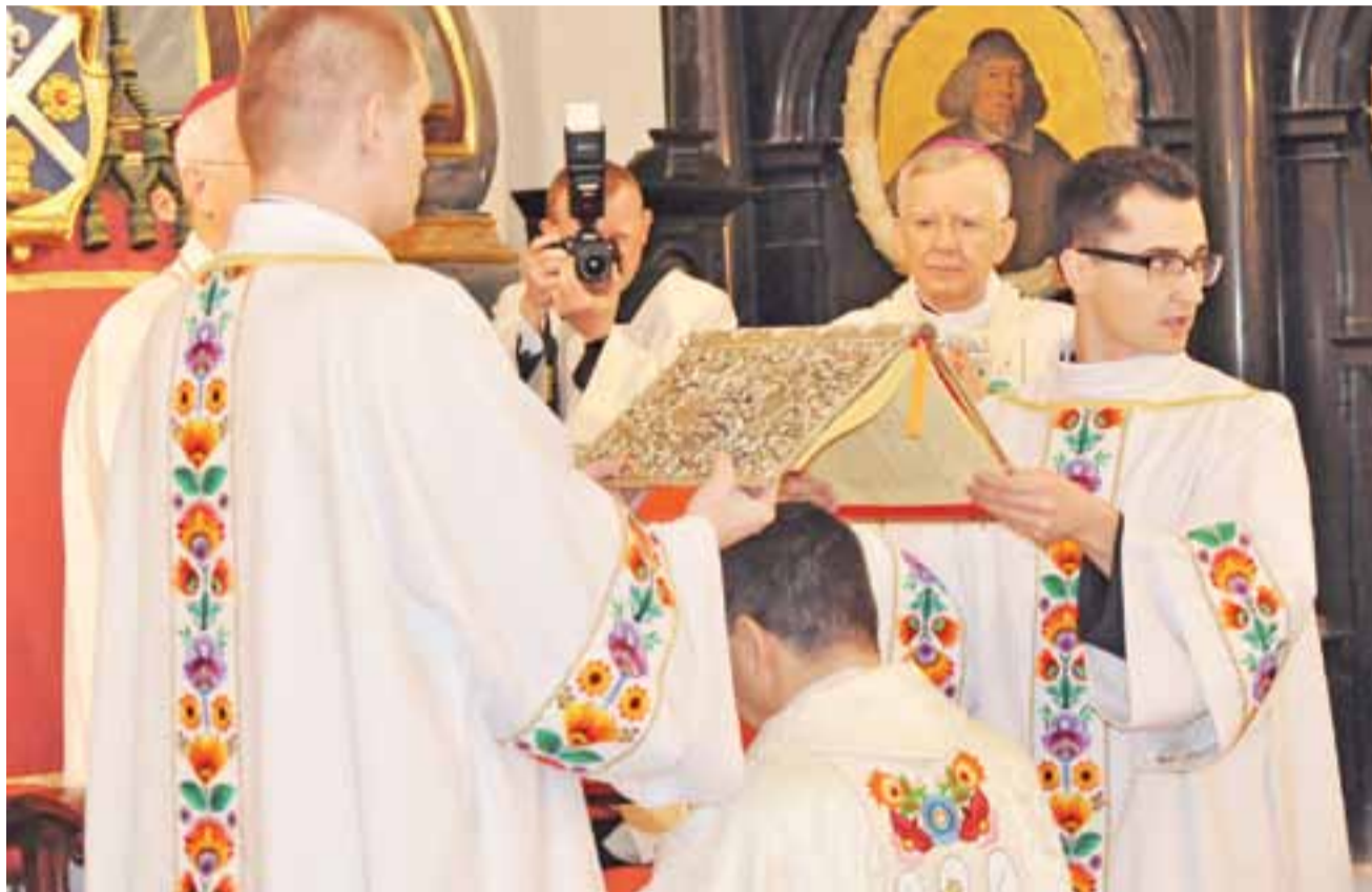
Księga Ewangelii jest trzymana nad głową biskupa nominata przez cały czas trwania modlitwy konsekracji.