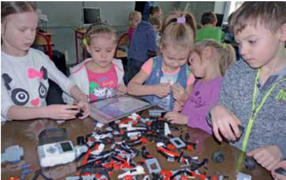
Na zajęciach z robotyki w ZS zastaliśmy uczniów z SP 1 z klasy Ib.