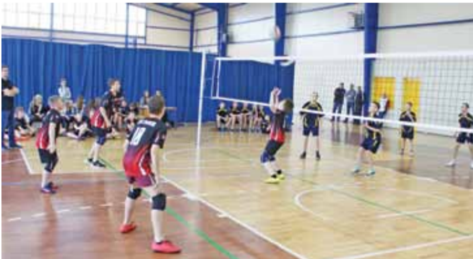
Mecz rozgrywek finałowych na szczeblu powiatowym chłopców.