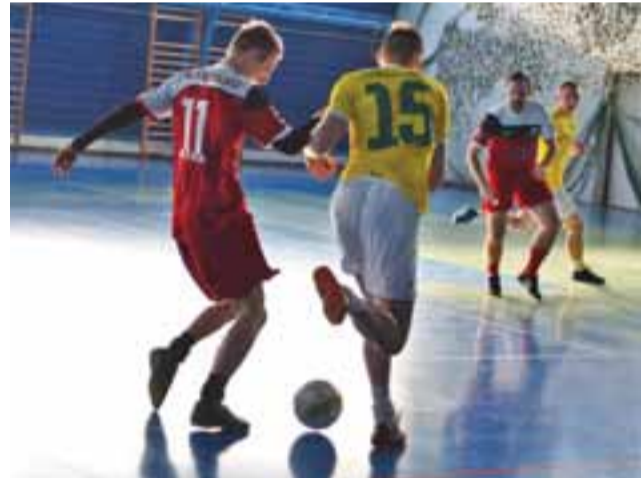
Mecz GKS Bedno kontra Szopen Sanniki podczas II Turnieju Piłki Nożnej o Puchar Burmistrza Miasta i Gminy Gąbin.

Półfinały: ■ Unia Czerarno – Tłuchovia Tłuchowo 0:0 k 2:0 ■ GKS Bedno – Skra Drobin 2:1 Mecz o III miejsce: ■ Skra Drobin – Tłuchovia 3:1 Finał: ■ Unia Czerarno – GKS Bedno 0:0 k 5:4