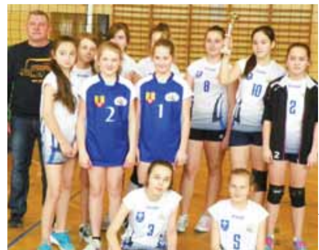
Mistrzyni powiatu łowickiego z SP Domaniewice.