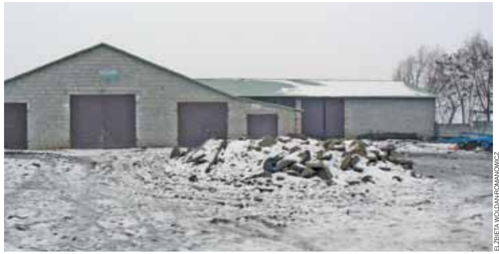
Investycja. Na budowę i wyposażenie tej obory poszły pieniądze z kredytów.

Później mundurowi założyli 64-latek sprawę o groźby karalne, pobicie i atak widłami. Kobieta twierdzi, że nic takiego nie miało miejsca. W procesie nie uczestniczyła osobiście, kilkakrotnie