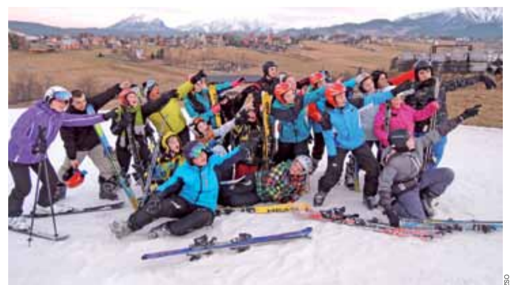
Uczestnicy zimowisk z Pacyny na stoku w Murzasichlu.

– Szusowaliśmy na stokach Budzowy Wierch i Czerwień i stacji narciarskiej Rusiński, do których dojeżdżaliśmy z Białego Dunajca