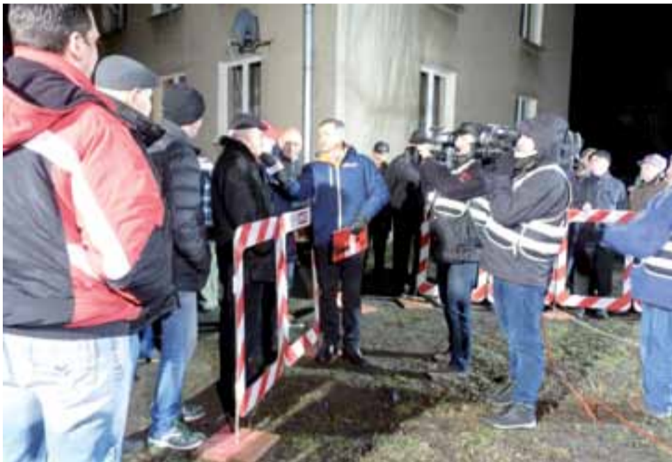
Telewizja TVP info przyjechała do Żychlina na zaproszenie panów Małowiejskich, którzy nie zgadzają się z usytuowaniem śmietnika koło bloku Narutowicza 85c.

– Jeśli śmietnik zostałby przesunięty, to mieszkańcy następnego