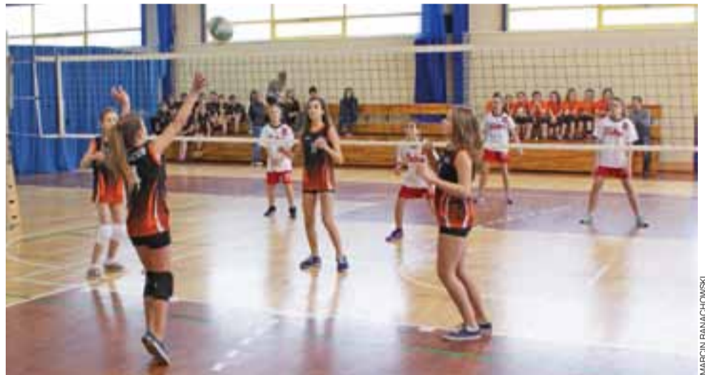
Wygrany 2:1 mecz dziewcząt z SP Nr 2 Żychlin z rywalkami z SP Nr 9 Kutno.