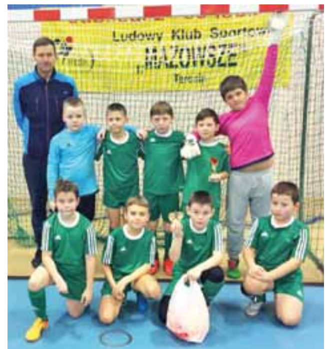
Młodzi gracze bardzo cieszyli się z wygranej w turnieju w Teresinie.