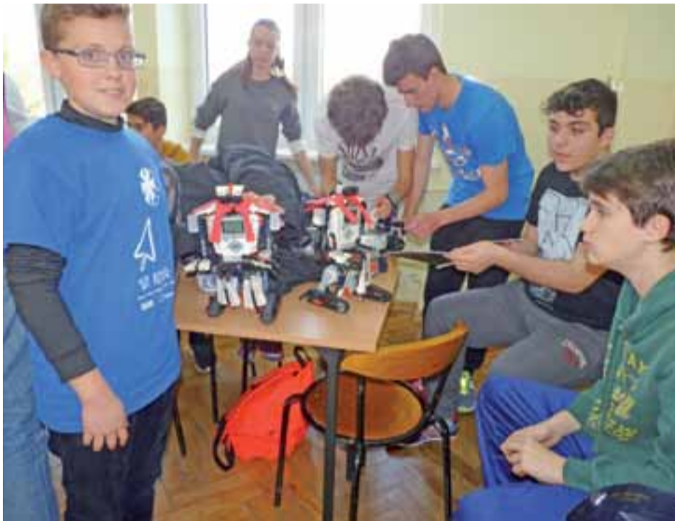
Uczniowie z każdego z krajów partnerskich na zajęciach Klubów Robotyki wykonują roboty z klocków Lego.

Pierwszego dnia pobytu, w poniedziałek, 8 lutego, zajęcia warsz-