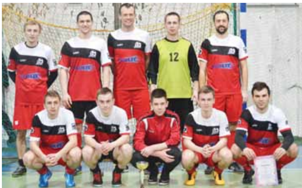
Zespół GKS Bedno biorący udział w turnieju piłkarskim w Gąbinie.