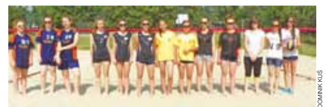
Gimnazjalne pary dziewcząt na boiskach I LO w Łowiczu.

■ Garbarnia Kraków – Warta Poznań 3:2 (2:2); br.: 1:0 – Patryk Serafin (2), 1:1 – Łukasz Szałowski (9), 2:1 – Patryk Serafin (11), 2:2 – Łukasz Białożyty (30), 3:2 – Marcin Siedlarz (83).