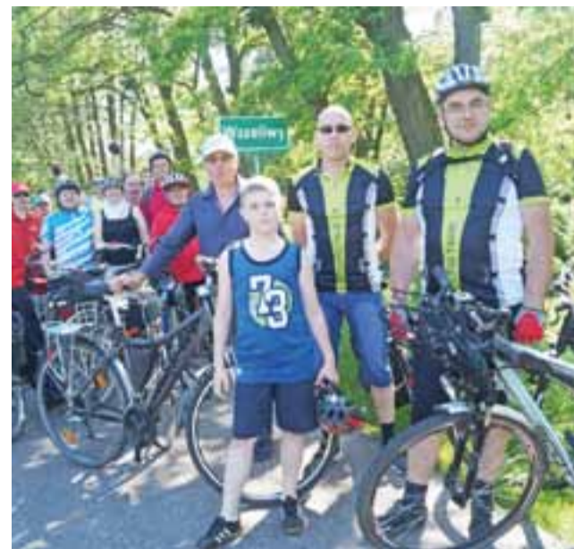
Uczestnicy rajdu „Szlakiem Zrzutowisk na Ziemi Łowickiej”