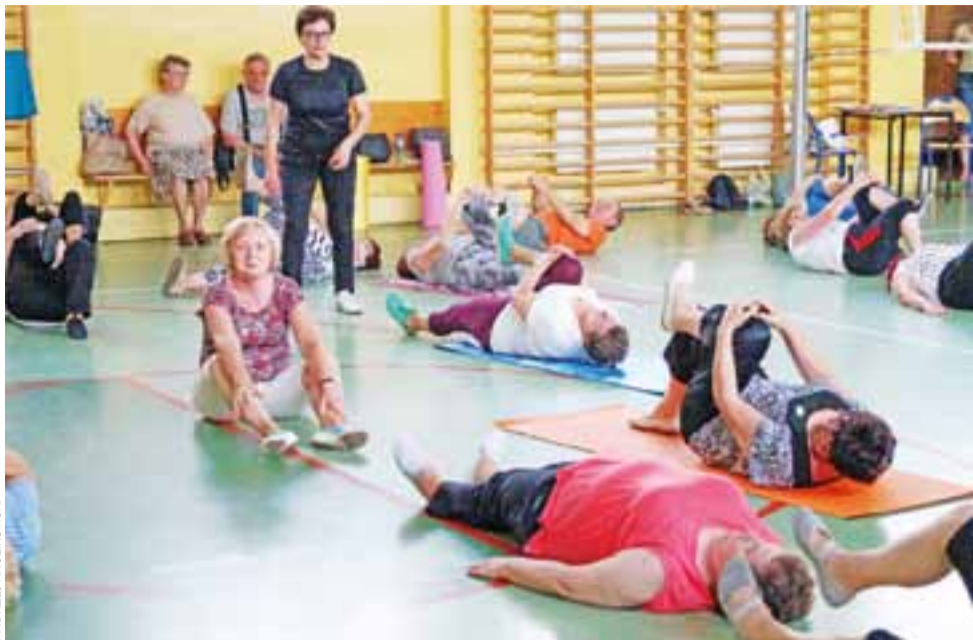
Pierwsze zajęcia korekcyjno-usprawniające odbyły się 1 czerwca w sali gimnastycznej ZS.