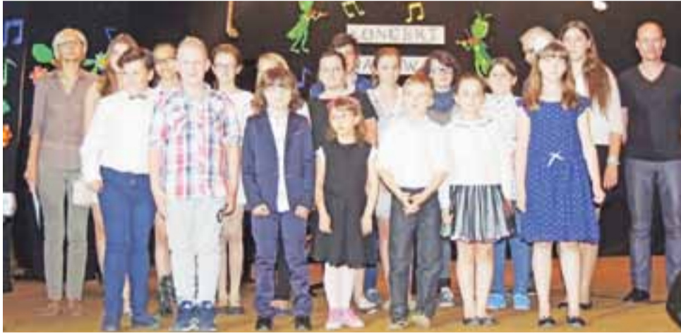
Wspólne zdjęcie młodych artystów po koncercie podsumowującym rok artystyczny w ŻDK.