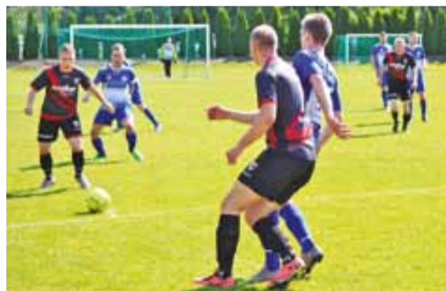
Wygrana 4:0 dla GKS Bedlno w wyjazdowym spotkaniu ostatniej 22. kolejki łódzkiej klasy A grupy III przeciwko Bzurze Ozorków.