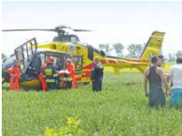
Po rannego w wypadku kierowcę przyleciał helikopter.

Gmina Bedlno | Tragiczny wypadek w Szewcach Nadolnych