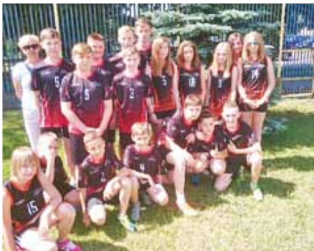
Reprezentacja Szkoły Podstawowej Nr 2 w Żychlinie podczas Finału Powiatowego Czwartków Lekkoatletycznych w Kutnie.