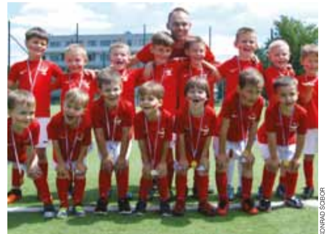
Najmłodszy z uśmiechem na twarzy marzą o piłkarskiej karierze.

– Tego dnia najważniejszy był jednak mecz Polska – Irlandia Płn., dlatego nasi mali piłkarze grali z biało-czerwonymi barwami na twarzach, a na koniec wszyscy wykrzyknęli „Kto wygra mecz?”