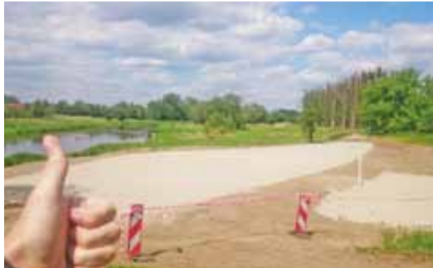
Tak wygląda plaża miejska w Sochaczewie , jeszcze przed oficjalnym oddaniem jej do użytku. Zdjęcie zostało zrobione w drugiej połowie maja.

Odkryte baseny mają zostać oficjalnie otwarte już niebawem, w sobotę 25 lub w poniedziałek