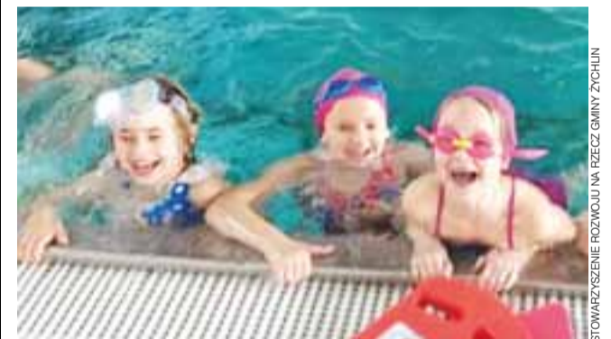
Od października grupa dzieci z SP 1 regularnie jeździ na basen do Kutna, gdzie uczy się pływać pod okiem instruktora.

Pływanie to najlepsza forma ruchu i rehabilitacji, bowiem pracują wszystkie mięśnie. A do tego jaka frajda. dag