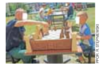
Może partyjka szachów? Do wyboru były różne gry.

Dzień Dziecka został przygotowany w ramach programu „Tato,