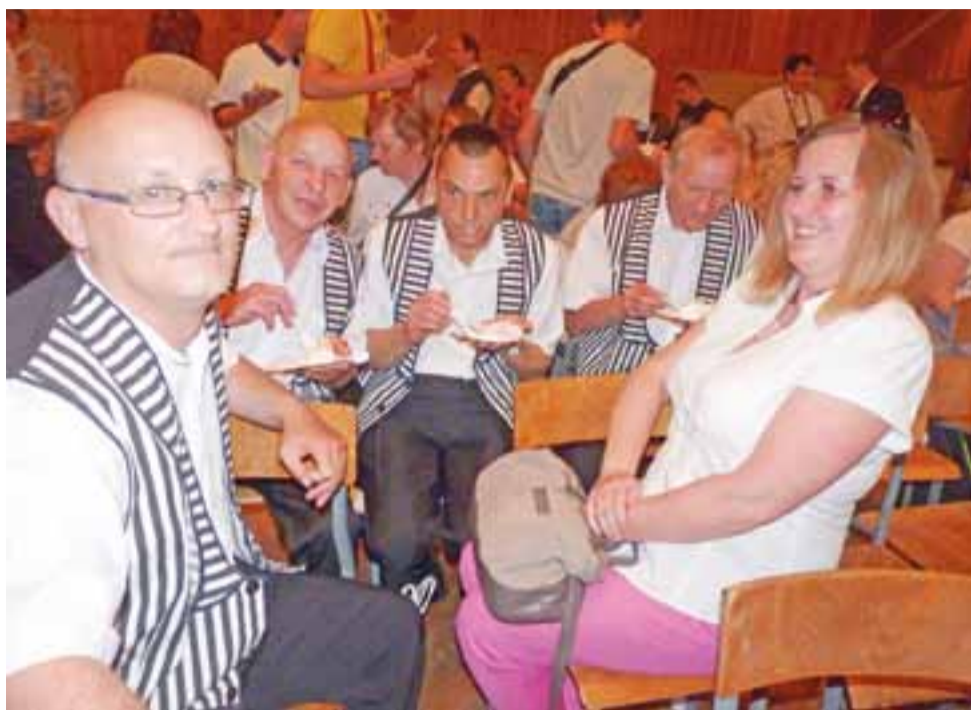
Zespół z DPS Wojszyce najpierw prezentował się na scenie, a później wszyscy jedli jubileuszowy tort.