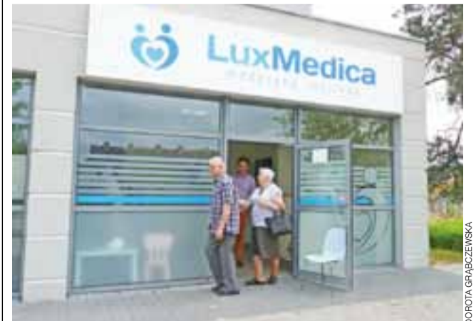
Od 1 czerwca w Żychlinie funkcjonuje trzecia przychodnia. Na razie przyjmują prywatnie specjaliści, których w Żychlinie brakowało. Od września ma ruszyć POZ finansowany z NFZ.

Właściciele LuxMedica podkreślają, że ilość specjalistów będą sukcesywnie zwiększać, w zależności od zapotrzebowania pacjentów. Już myślą o neurologu, ortopedzie i okuliście. dag