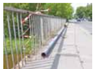
Przyczyną przewrócenia się latarni była korozja.

Przez pewien czas słup z lampą blokował jednak ruch pasem od strony parku Błonie. Dopiero po odcięciu go od trakcji został położony wzdłuż chodnika, a ruch upłynięto. Do zabezpieczenia miejsca wezwany został jeden zastęp Państwowej Straży Pożar-