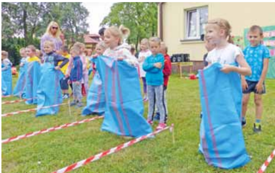
Jedną z konkurencji międzyprzedszkolnej olimpiady, wcale nie łatwą, był bieg w workach.