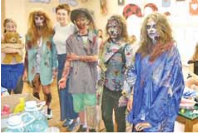
W Dniu Dziecka z PaTem gimnazjaliści z Gostynina uczestniczyli w licznych zajęciach. Niektórzy wybrali charakterystyczną za zombi.