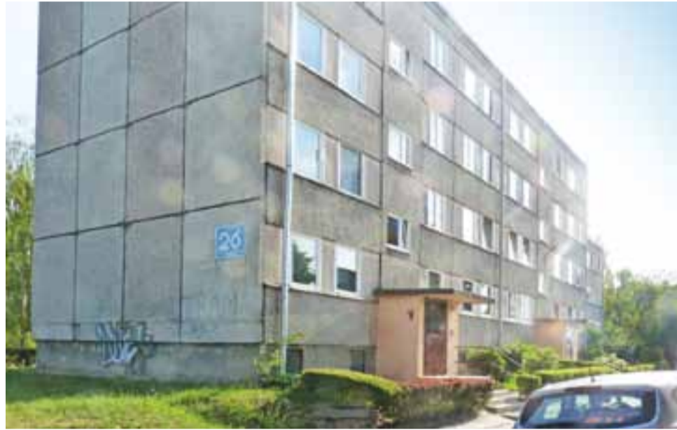
Blok Traugutta 26 jako pierwszy w Spółdzielni Mieszkaniowej w Żychlinie zostanie poddany termomodernizacji.