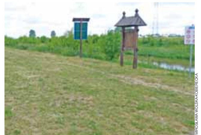
Bar powstanie pomiędzy wałem a korytem rzeki , w bezpośrednim sąsiedztwie przystani kajakowej.

Jak wyjaśnia rzecznik, póki co nad rzeką udało się zorganizować plażę i przystań kajakową, ale nie ma zezwoleń na to, by było tam kąpielisko. Zgodnie z jego zapowiedzią, Urząd Miejski w Sochaczewie będzie się jednak starał o to, by kąpiele były tam możliwe w przyszłym sezonie letnim. ■