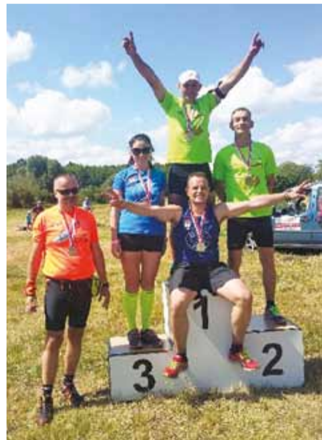
Grupa Rozbiegani Żychlin podczas 8. Ogólnopolskiego Supermaratonu Łódzkie Ultra w Ozorkowie.

Nowy Łowiczanie Tygodnik Ziemi Łowickiej członek Stowarzyszenia Gazet Lokalnych