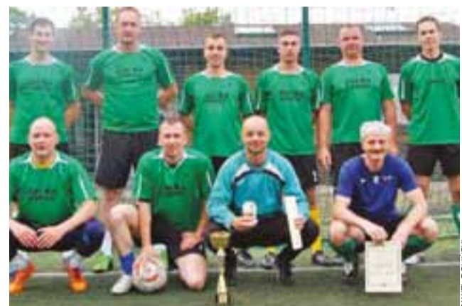
Zetka Łowicz okazała się najlepsza w Łowickiej Lidze Orlika.