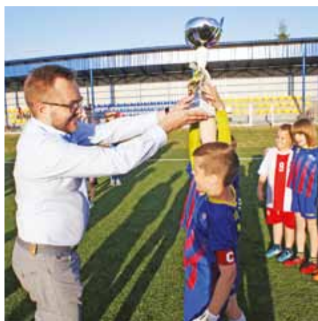
Burmistrz Gminy Żychlin wręcza puchar za zajęcie pierwszego miejsca w turnieju piłki nożnej dla zespołu z Żychlina.

■ Klasyfikacja końcowa: 1. Żychlin, 2. Bedlno, 3. Kutno, 4. Łowicz, 5. Kierozia