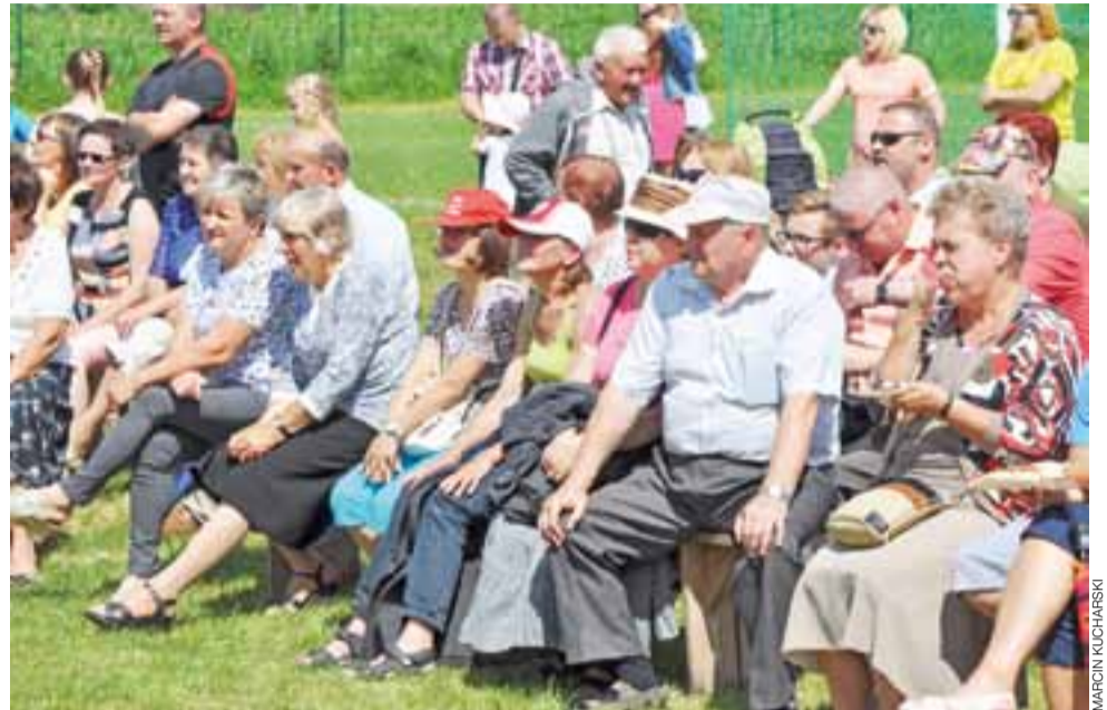
Na piknik przychodzą całe rodziny: dzieci, rodzice oraz babcie i dziadkowie.

Jamno | Parafia Chrystusa Dobrego Pasterza i wolontariusze ŚDM