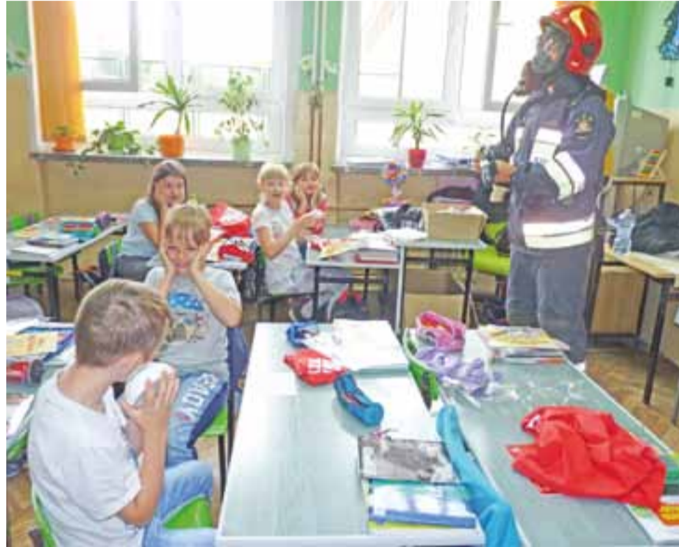
Strażak w stroju bojowym oraz przenikliwość wyjące czujki dymu wzbudzały powszechne zainteresowanie.

Wszystkie zajęcia były prowadzone w nowatorski sposób, z dowcipem i swobodą, na zasadzie wzajemnego dialogu i dyskusji i taka forma zajęć bardzo podobała się uczniom. Oni zresztą też byli bardzo aktywni i kreatywni, zaskakując czasami