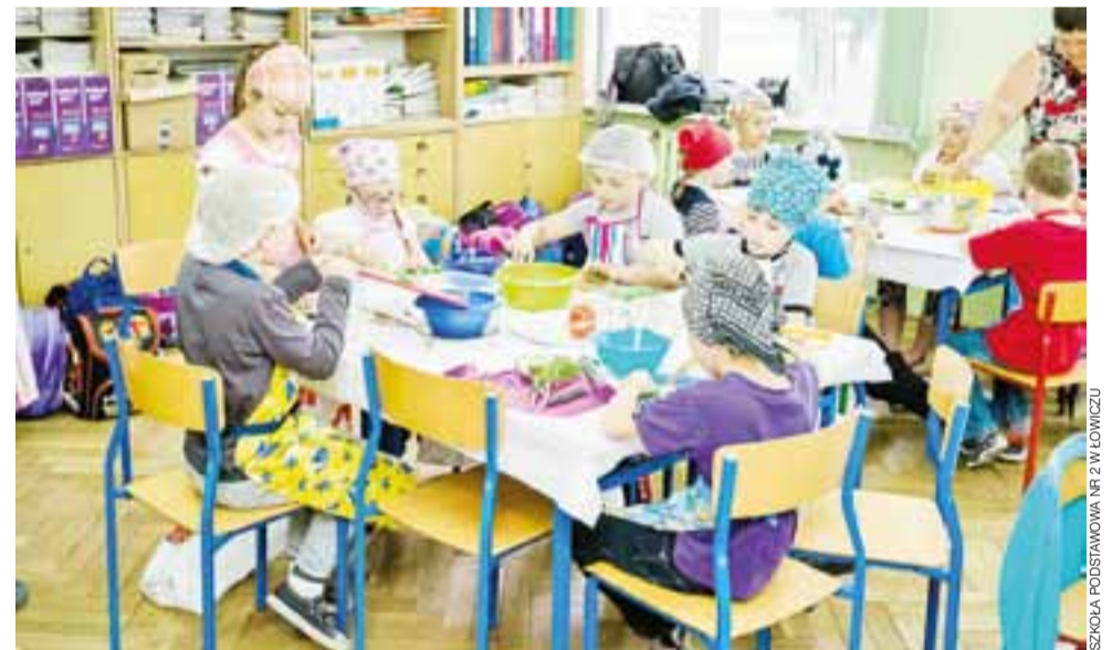
Przed przystąpieniem do zajęć kulinarnych dzieci – jak prawdziwi kucharze – ubrały się w fartuski, na głowy założyły chusteczki lub czepki.