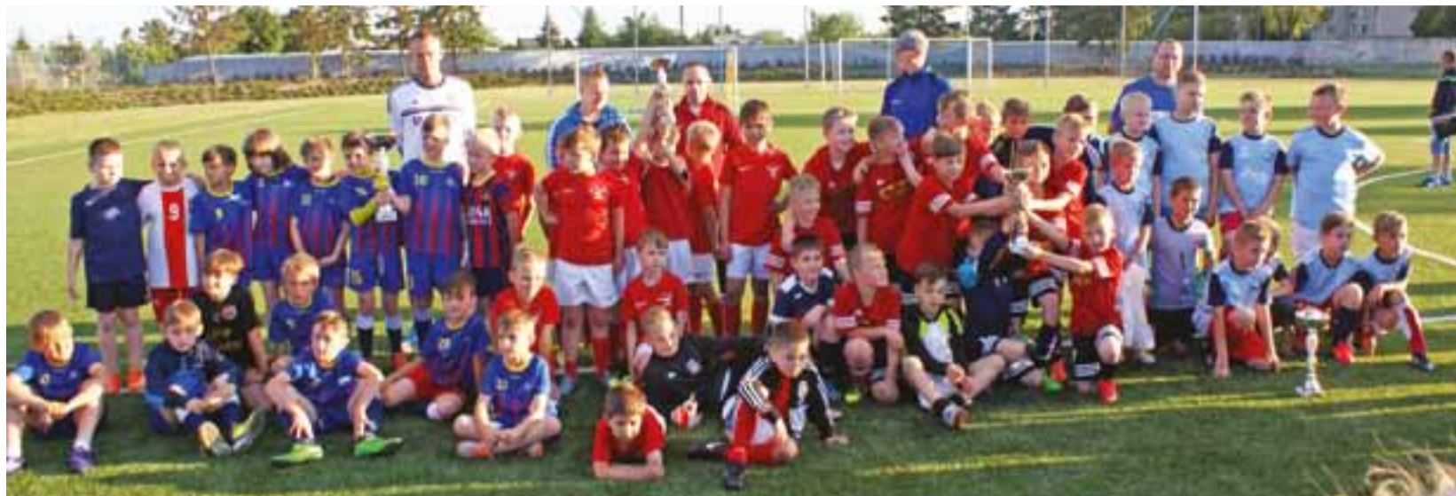
Drużyny chłopców uczestniczące w Turnieju Piłki Nożnej o Puchar Burmistrza Gminy Żychlin.