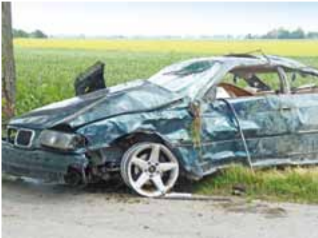
Tak wyglądało BMW po wypadku w Szewcach Nadolnych.