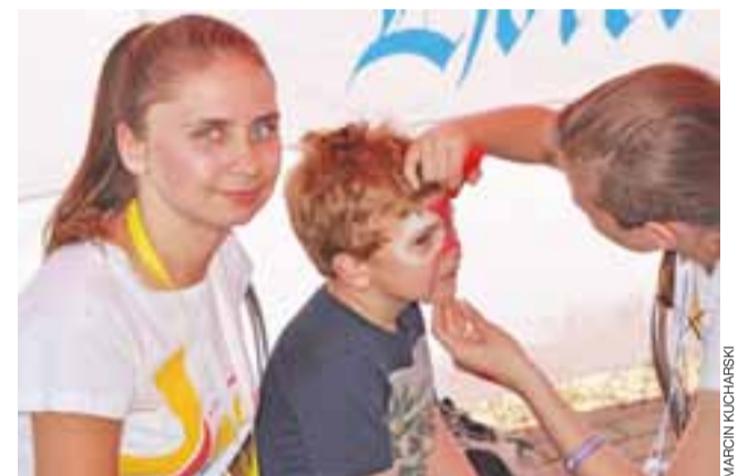
Dużym powodzeniem cieszyło się malowanie twarzy – szczególnie w barwy narodowe.

wsparcia finansowego młodzieży przed Świątowymi Dniami Młodzieży. – Bardzo mi się podobało, nie tylko ilość atrakcji i wydarzeń, ludzi zaangażowanych, ale przede wszystkim wy-