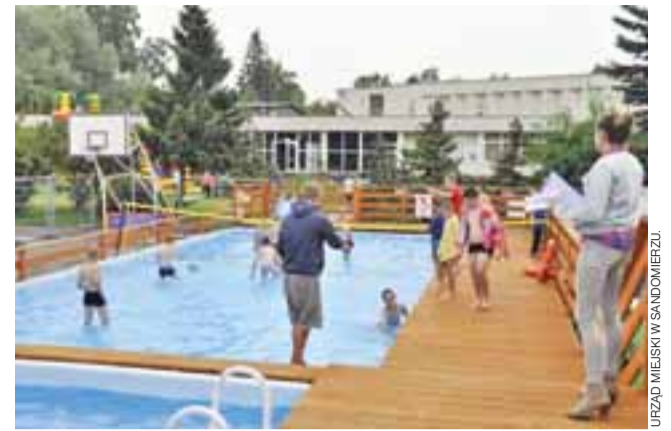
Tak prezentuje się basen w Sandomierzu . Podobnie ma to wyglądać na Kaliskiej w Łowiczu.