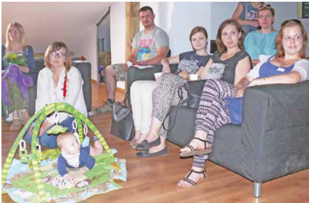
W trakcie spotkania panowała luźna atmosfera. Oprócz mam, przybyło na nie kilku tatusiów, a warunki były idealne nawet do sprawowania opieki nad małymi dziećmi.

Dlaczego więc prowadząca postanowiła zająć się tematem? Jak nam powiedziała, uważa go za istotny, a niestety często marginalizowany. Przyczyną tego jest m.in. fakt, że kobiety spodziewające się dziecka bardziej koncentrują się na samym porodzie niż na tym, co będzie później. Oprócz tego o karmieniu piersią zwyczajnie się zapomina. Ona sama dobrze wie, że warto karmić piersią dziecko, bo jest to korzyścią tak dla niego, jak i dla matki.