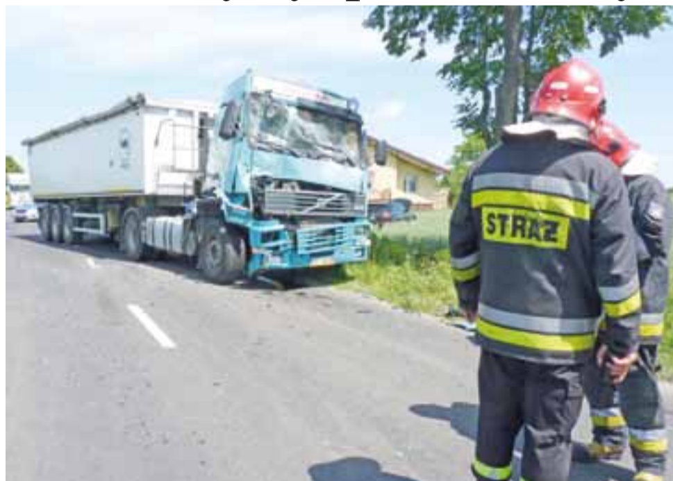
W Janowie, gmina Bedlno , doszło do kolizji samochodów ciężarowych. Kierowca osobowego Infiniti ratował się ucieczką w pole pszenicy. Szczęście, że rów był płytki.

Na szczęście nikomu nic się nie stało. Skończyło się na uszkodzeniu pojazdów i nerwach. Wszyscy kierowcy byli trzeźwi. Sprawca został ukarany mandatem. Droga wojewódzka z Bedlno do Żychlina przez ok. 2 godziny była całkowicie zablokowana, a kierowcy jeździli drogami gminnymi. Przez następne 2 godziny ruch odbywał się z utrudnieniami. str. 4