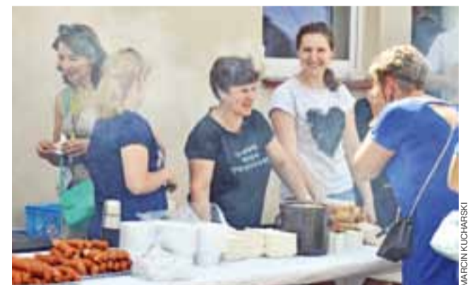
Parafianki przygotowały poczęstunek. Serwowały m.in. chleb ze smalcem ze skwarkami.