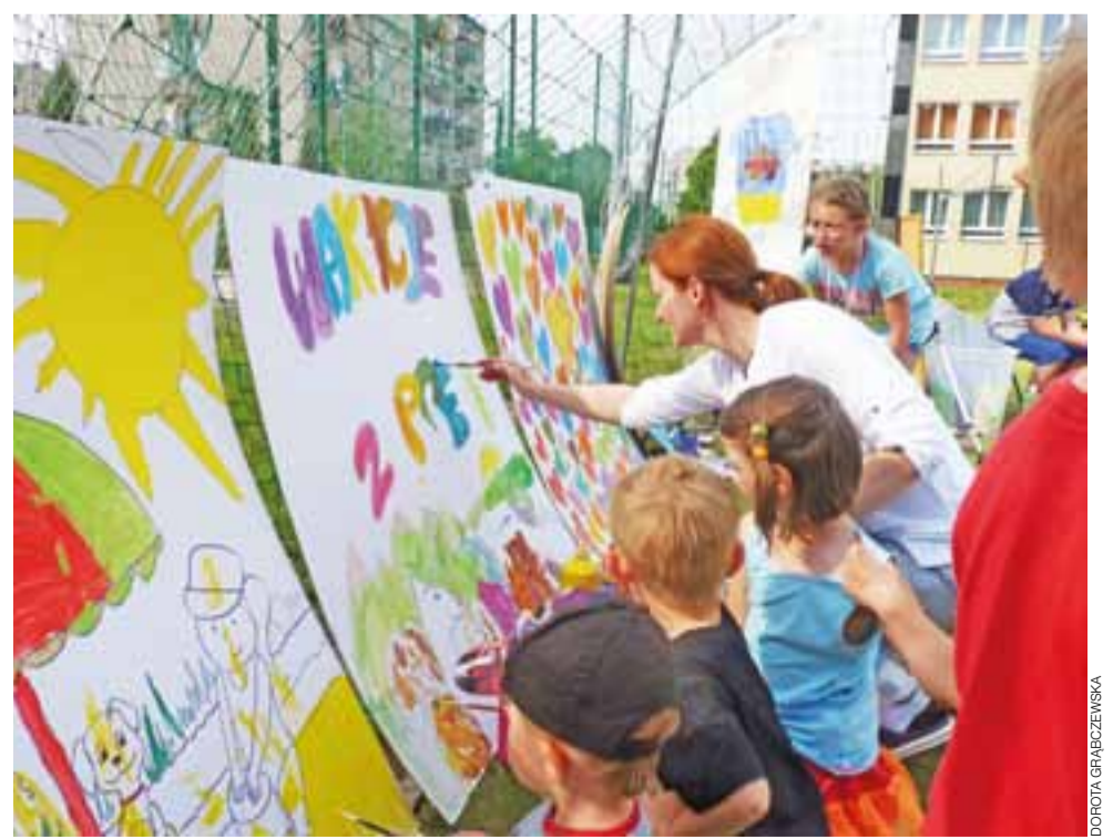
Malowano też kolorowe obrazki, które mają zdobić ściany urzędu i sprawiać, by był on bliżej mieszkańca.