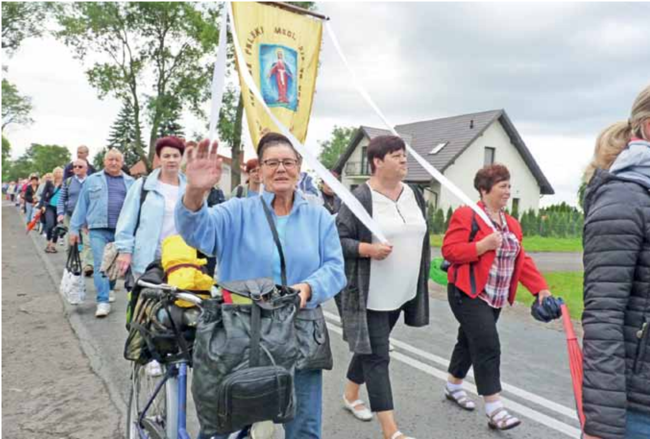
Pielgrzymi wędrowali ze sztandarami i świętymi obrazami.