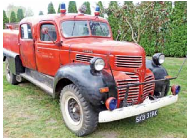
Ten Dodge z 1944 roku powstał jako samochód wojskowy. W Łodzi przerobiono go na samochód strażacki.