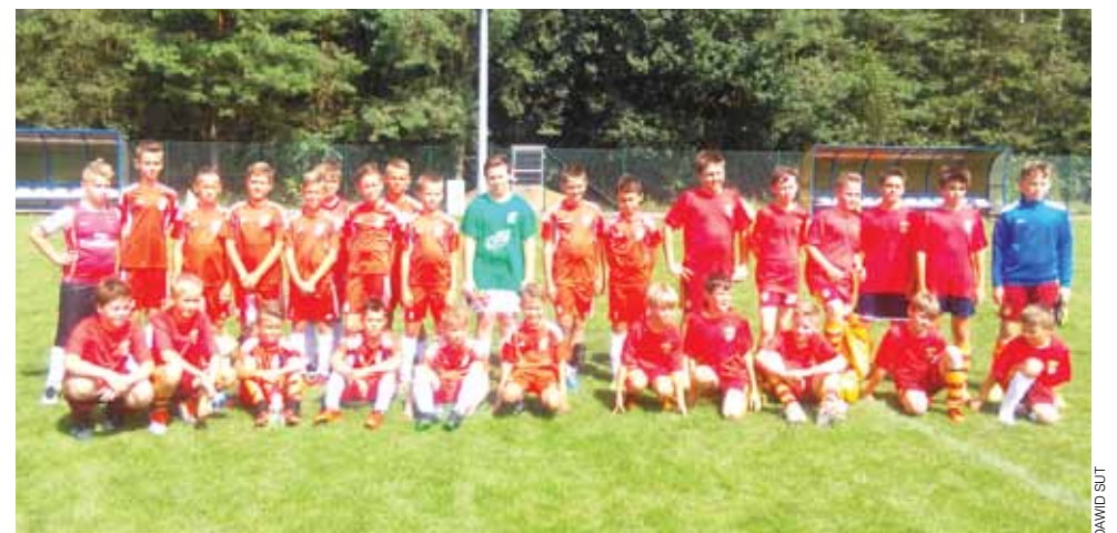
Wspólne zdjęcie Pelikana 2005 z rywalami z Warszawy