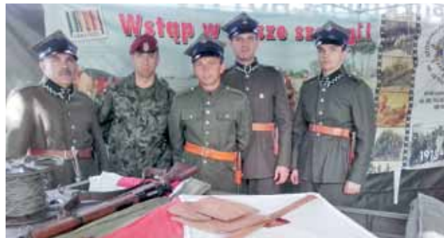
Współcześni „Dziesiątacy” na stoisku stowarzyszenia prezentowali sprzęt łączności.

Po paradzie wojskowej widowie przemieścili się na Agrykołę, gdzie zaprezentowano sprzęt wojska polskiego i amerykańskiego.