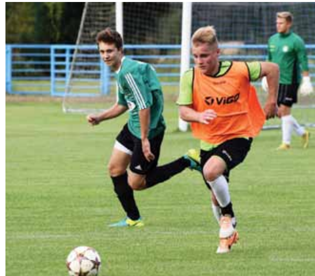
Laktoza nie zebrała się na Puchar Polski tydzień temu, a teraz pokonała w sparingu Widok!