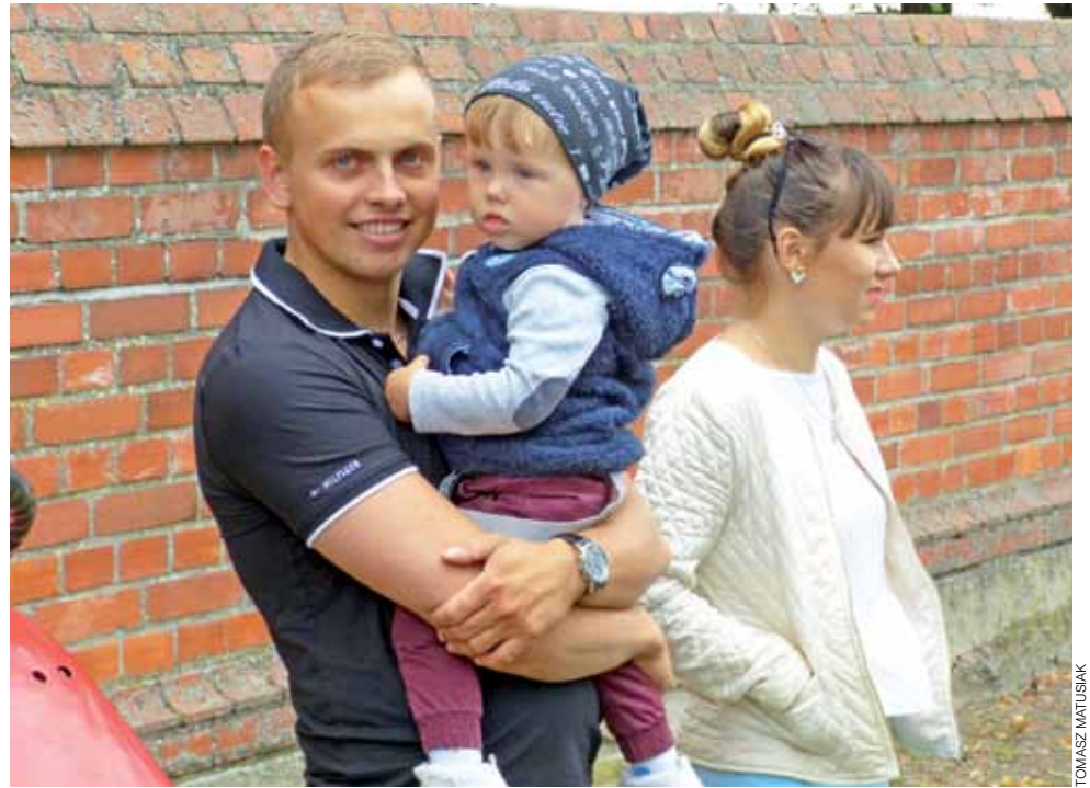
Na festyn przybywały całe rodziny. Każdy mógł znaleźć coś ciekawego dla siebie.