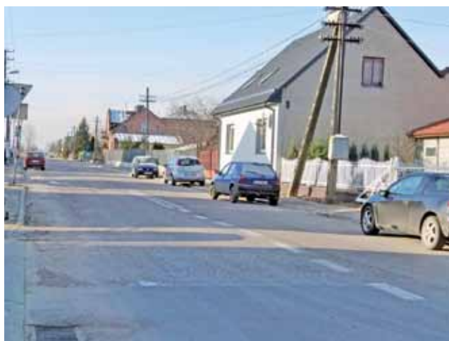
Ulica Żychlińska w Kiernozi nie jest jeszcze skanalizowana.

co dwa lata – w latach, kiedy nie są przeprowadzane oficjalne eliminacje zawodów powiatowych. tm