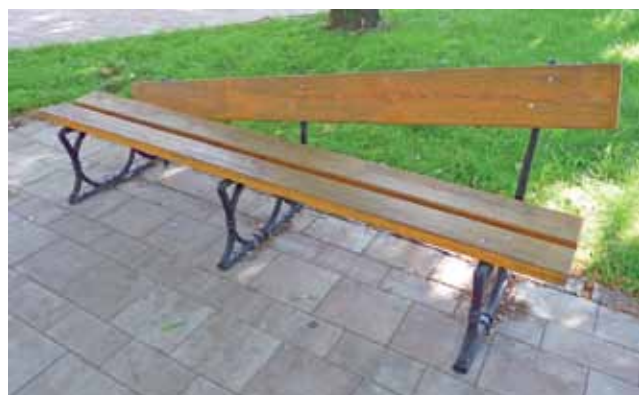
Ławki mają uszkodzone żeliwne elementy łączące siedzisko z oparciem. Zostały prawdopodobnie przecięte ostrym narzędziem.

Poprosiła nas o zainteresowanie się sprawą, gdyż obawia się, że po