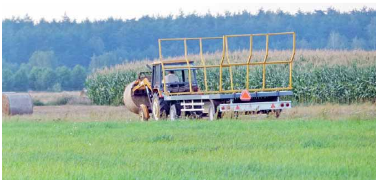
Tegoroczne żniwa w Sapach (gmina Domaniewice).

To, że zboża jest mniej, nie oznacza wcale, że wzrósł na nie popyt. Ceny są niższe niż w ubiegłym roku dla większości najpopularniejszych w naszym regionie zbóż – dla pszenicy konsumpcyjnej o ok. 8-9%, a dla pszenicy paszowej czy żyta o 3-4%. W stosunku do ubiegłego roku znacząco wzrosła jedynie cena kukurydzy, prawie o 10% (wg danych ministerstwa