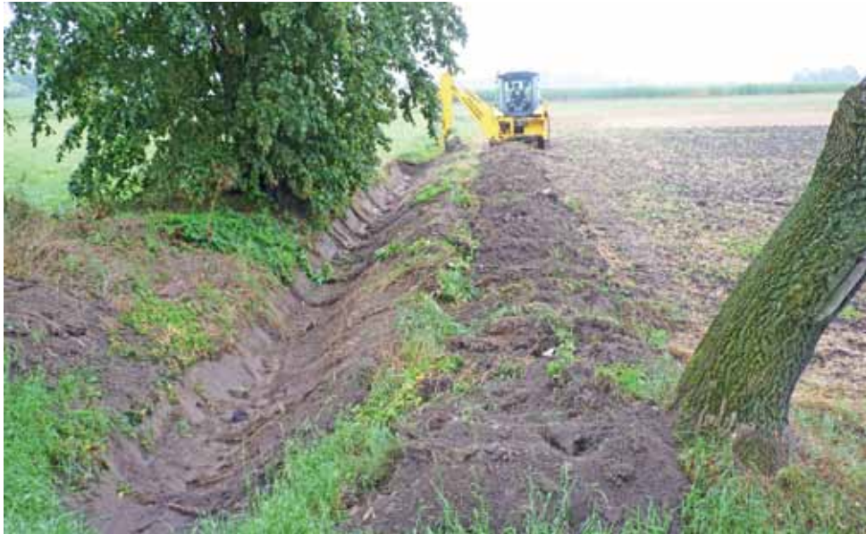
Wcześniej rowu tu praktycznie nie było. Został pogłębiony na zlecenie Spółki Wodnej Oporowianka.

Rów na granicy gmin jest jednym z pierwszych zaplanowanych do wykonania w tym roku. Na wiosnę odmulono ok. 1,5 km rowów. Latem czekano, aż rolnicy sprzątną zboża. Przez wakacje 2 pracowników zatrudnionych w ramach robót publicznych (od marca do końca grudnia) wycinało krzaki rosnące na rowach. Na wiosnę usuwano też duże awarie. Jak informuje prezes, w Grotowicach przekładano sączki, zaś w Janowie koło lasu oraz w Go-