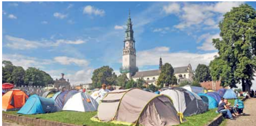
W okolicy Jasnej Góry pojawiło się wiele namiotów. Część pielgrzymów po przybyciu na Jasną Górę 14 sierpnia chce uczestniczyć w uroczystej mszy 15 sierpnia i właśnie w okolicy klasztoru nocują w namiotach.

Łowicz | Para prezydencka na Bożym Ciele?