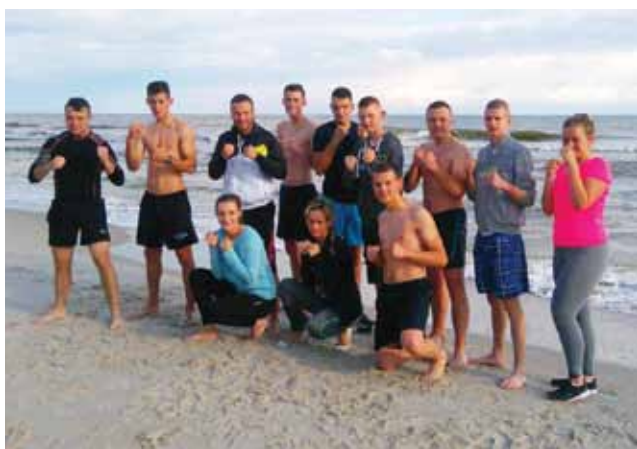
Uczestnicy obozu w Ostrowie

Łowiczanie skupili się głównie nad ćwiczeniami ogólnorozwojowymi, nad wytrzymałością i siłą. To podstawowe elementy, bez których nie możliwa jest wal-