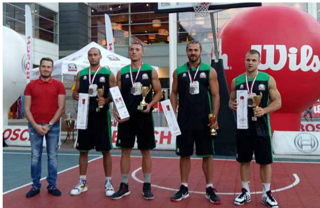
Drużyna Rezerwowi Kutno zajęła 3. miejsce w Bosch Grand Prix Polski w Koszykówce Streetball 3x3 rozgrywanych na rynku Manufaktury w Łodzi.