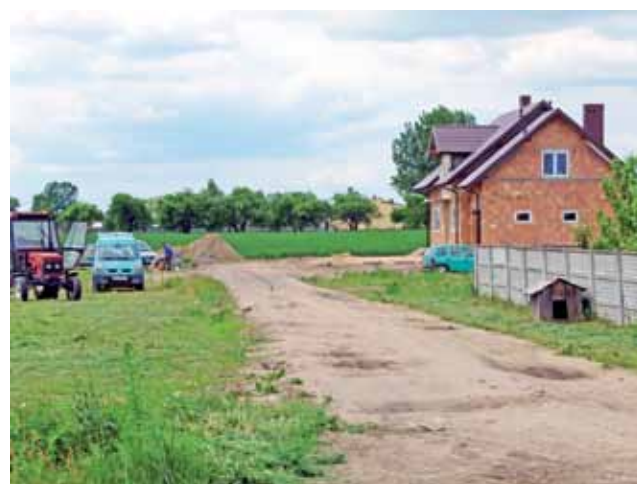
Przy ul. Przytargowej w Kiernozi powstają nowe domy, bez kanalizacji.

Kiernozia | Gmina czeka na ogłoszenie o naborze wniosków