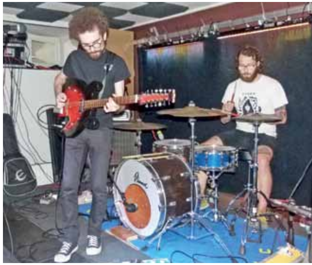
Wild Books na scenie w Pracowni.