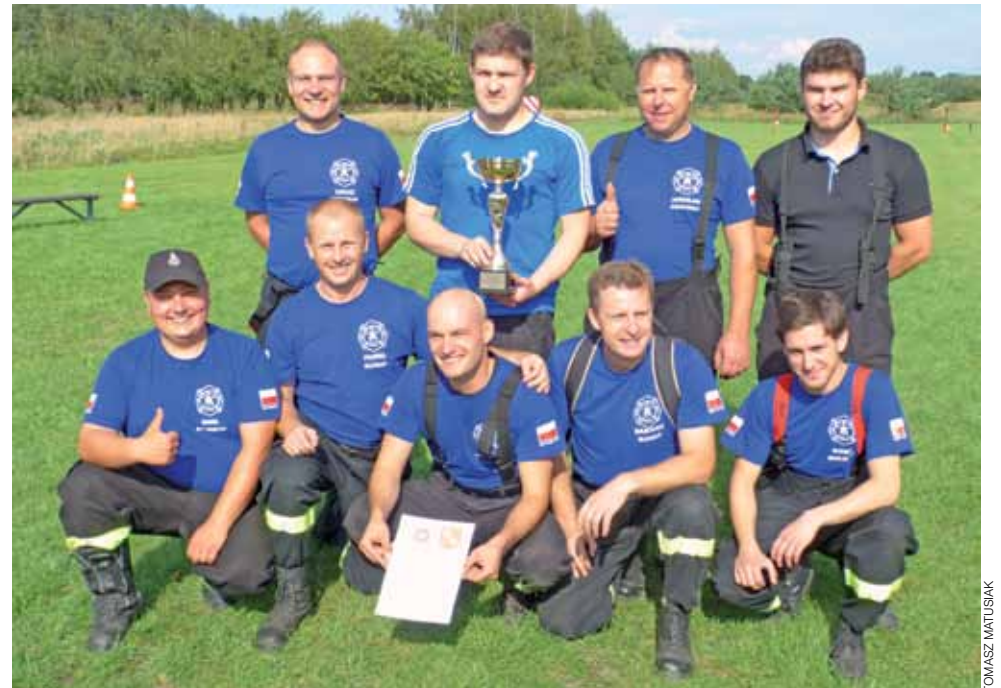
Zwycięska drużyna OSP Łasieczniki.

– Parę lat temu sam reprezentowałem OSP Łasieczniki, teraz staram się być z nimi na każ-