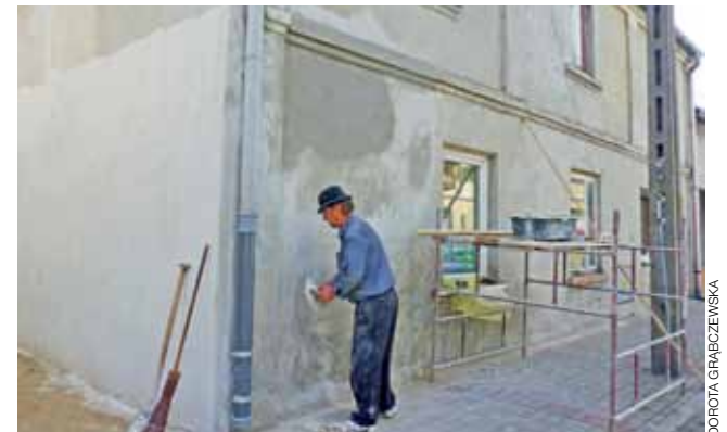
W ubiegłym roku w kamienicy podłączono wodę i kanalizację ściekową. Teraz robiona jest elewacja budynku komunalnego.

W dalszym etapie do modernizacji będzie jeszcze niewielki korytarzyk, który na razie jest wyłożony pilśniowymi płytami sprzed wielu lat. dag