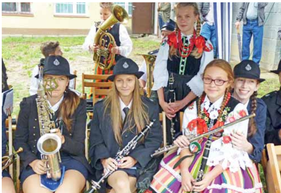
Jak widać na zdjęciu, między członkami zespołów działających na terenie gminy Kocierzew Płd. nie ma rywalizacji, a jest sympatia.

Około godziny 16 rozpoczął się koncert pod nazwą „Biesiada Polska”, zaś nieco później rozpoczął