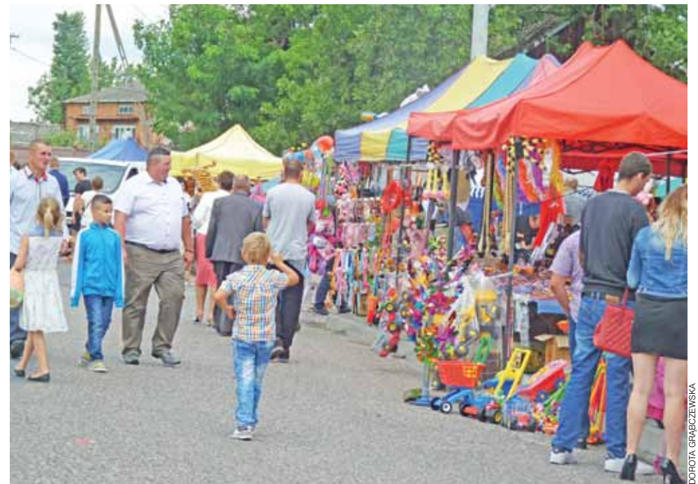
Na tegoroczny odpust przyjechało mnóstwo gości z ościennych gmin oraz wiele różnych kramów i kramików.

W roli oskarżyciela występowała Prokuratura Rejonowa w Łowiczu, zaś pokrzywdzo-