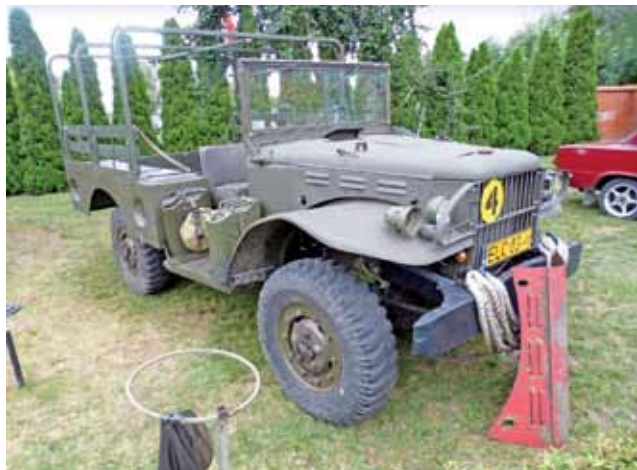
Ten wojskowy samochód był jedną z wielu atrakcji wystawy zabytkowej motoryzacji.