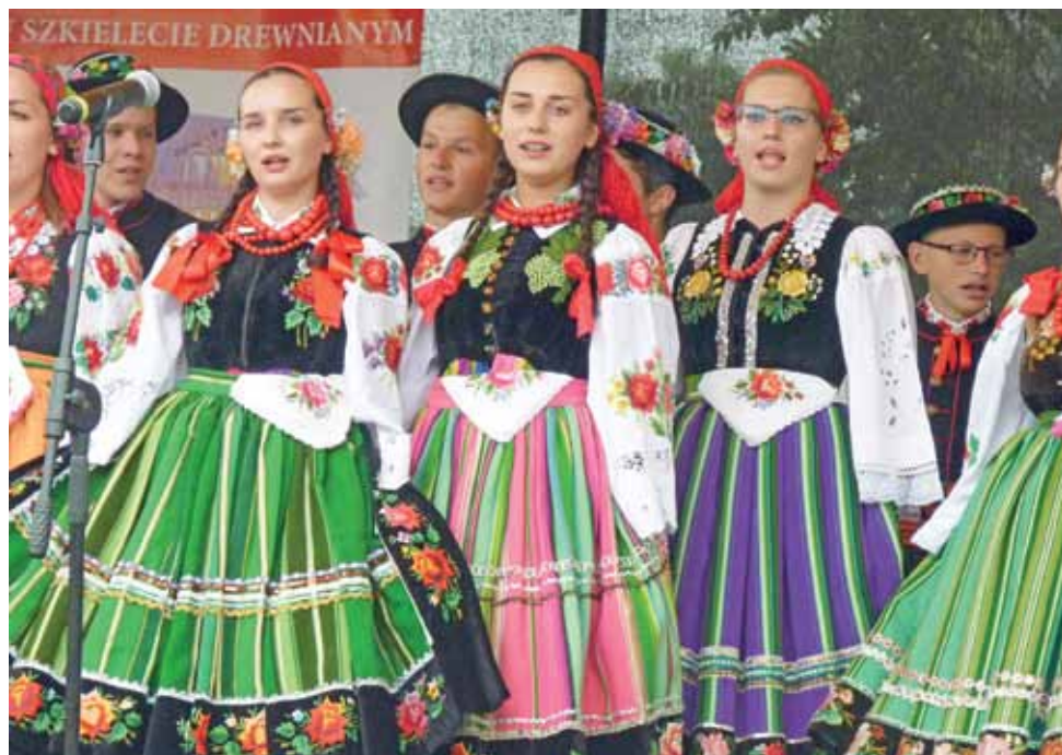
Na scenie prezentowały się m.in. zespoły folklorystyczne z terenu gminy Kocierzew Płd. Na zdjęciu dziewczęta z Regionalnego Zespołu Pieśni i Tańca „Boczki Chełmońskie”.