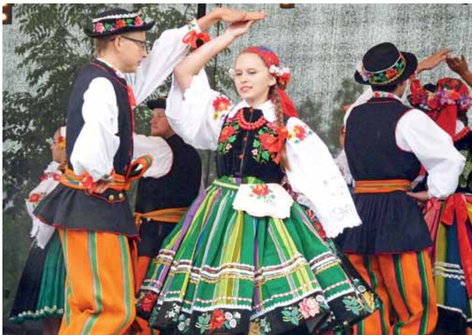
Członkowie zespołu „Boczki Chełmońskie” zaakcentowali łowicki folklor i zaprezentowali piękne układy taneczne.