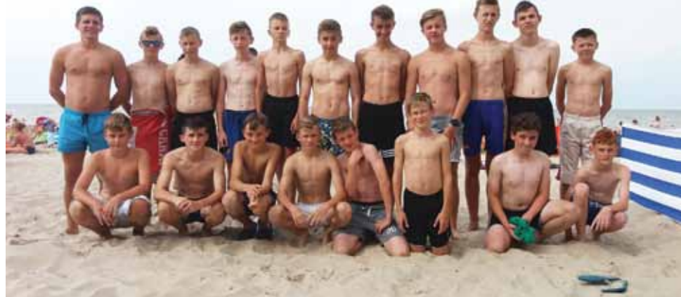
Zespół Pelikana 2002 nie przegrał meczu sparingowego podczas obozu

– Mielismy bardzo dobre warunki zakwaterowania, boisko treningowe było położone blisko naszego ośrodka i to był również duży atut. Zawodnicy w Pobierowie wykonali dużo ciężkiej pracy. Od pewnego czasu zaczynamy wprowadzać elementy taktyczne i chłopcy coraz lepiej realizują założenia taktyczne. Oprócz tego widać duży kolektyw w zespole i z tej maki może być fajny chleb. Jestem zadowolony z pracy treningowej i dużym kopem dla nas był mecz z Unią Warszawa, a w szczególności pierwsza połowa, która była zagrana perfekcyjnie. Jeśli chłopcy będą się tak dalej rozwijać, będą robić krok do przodu. Obóz ma przygotować zespół