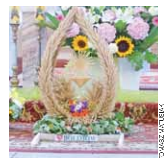
Wieniec dożynkowy w tym roku został przygotowany przez mieszkańców wsi Bolimów.