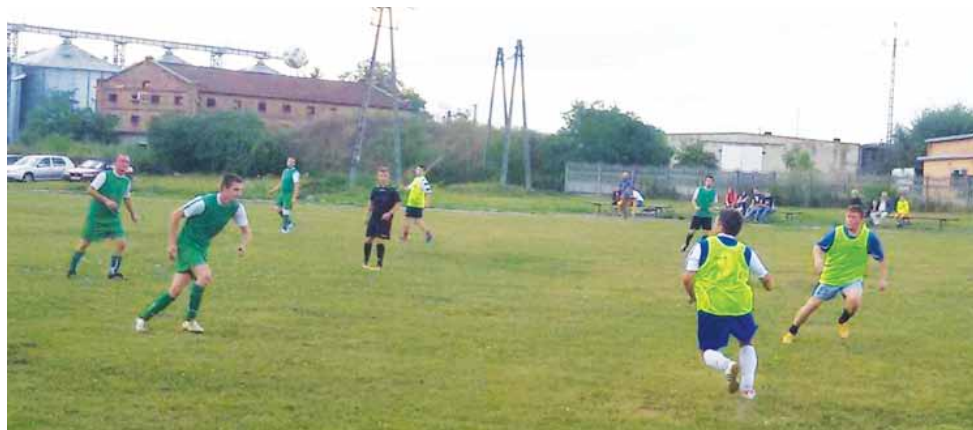
Wygrana 5:3 KS Żychlin z Olimpią Oporów