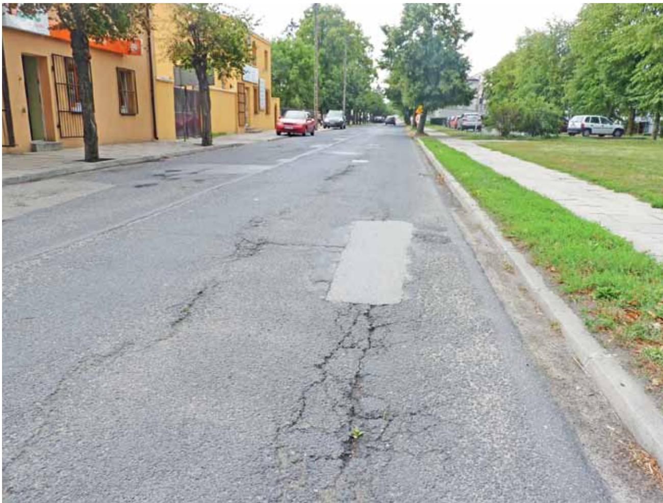
Jeszcze w tym roku, na długości ok. kilometra, zostanie ułożona nowa nakładka bitumiczna w ul. Łukasińskiego – od poczty aż do oczyszczalni ścieków.

O remont powiatowych ulic Łukasińskiego i Żeromskiego gmina Żychlin zabiega od wielu lat. Wszystko rozbijało się o pieniądze, których starostwo na te inwestycje nie miało. Teraz jest szansa, że zmodernizowany zostanie odcinek ulicy od skrzyżo-