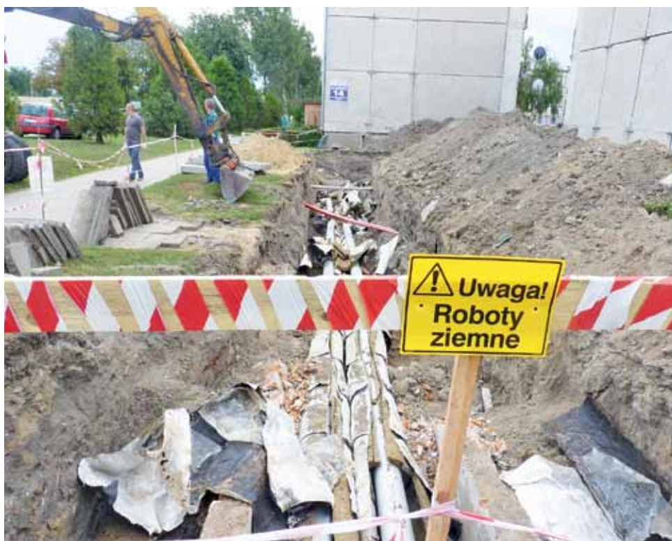
Energa Kogeneracja zaczęła wymianę kilkudziesięciu metrów ciepłociągu. 16 sierpnia odcięto ciepłą wodę.

W poprzednich latach, gdy zaczynano modernizację, wyłączenia ciepłej wody trwały nawet dwa tygodnie, co bardzo bulwersowało mieszkańców. Zarzucali inwestorowi brak organizacji pracy. W tym roku utrudnienia zostały zminimalizowane. Mieszkańcy będą pozbawieni ciepłej wody tylko przez 4 dni. Zgodnie z założeniami firmy i informacjami przekazanymi do Spółdzielni Mieszkaniowej przy ulicy Łąkowej, w weekend ciepła woda powinna ponownie pojawić się w kranach. ■