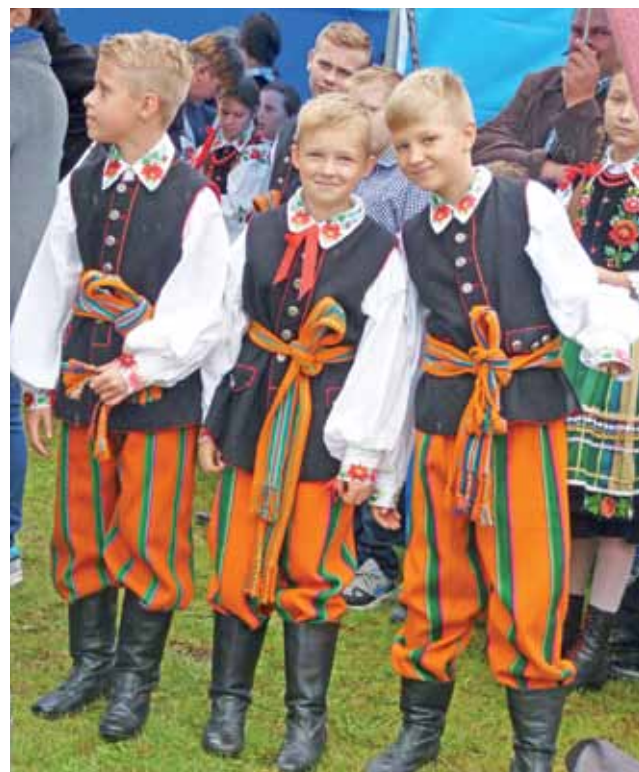
Chłopcy z Dziecięcego Zespołu Ludowego „Kocierzewiaczy” po występie chętnie pozowali do zdjęć.

bawa taneczna, która zakończyła się zgodnie z planem, około północy.