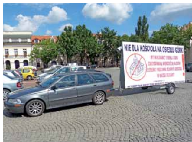
Baner na Starym Rynku w Łowiczu 15 sierpnia.

Przeciwnicy budowy kościoła wypowiadają się na facebookowym fanpage'u „Nie dla kościoła na Górkach”. To w ich środowisku powstał pomysł wystawienia baneru. Strona istnieje od końca czerwca, a ma już 685 „polubień” – zarówno od mieszkańców osiedla, jak i innych internautów, zaś post ze zdjęciem baneru po niespełna 2 dniach od zamieszczenia miał przeszło 9000 wyświetleń.