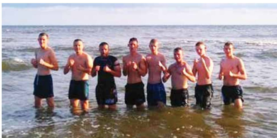
Kąpiele w zimnym morzu do dobre hartowanie organizmu.

Informacje o treningach i o sekcji można znaleźć na klubowej stronie www.khroo-gym.pl . zł