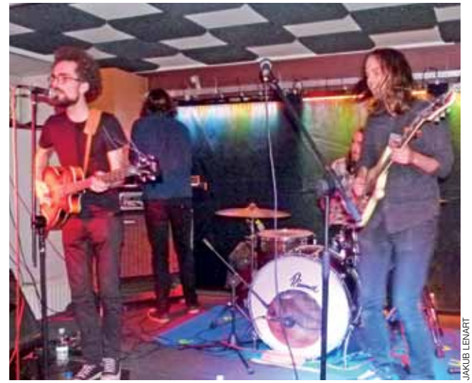
Kapela The Saturday Tea.