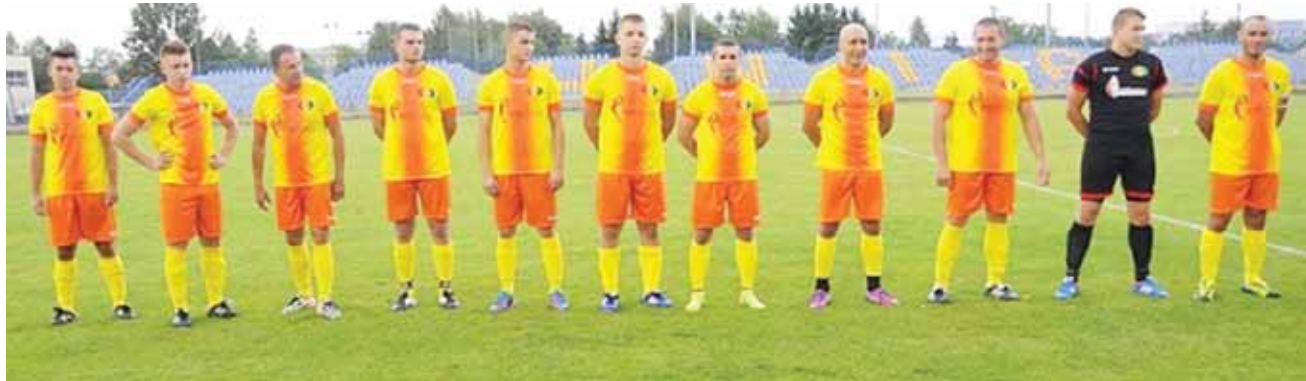
Pogoń Bełchów rozpocznie sezon meczem z Juventą Wysokienice

■ Pelikan II Łowicz – Macovia Maków (niedziela, 21 sierpnia, 11:00); Zdecydowanym faworytem