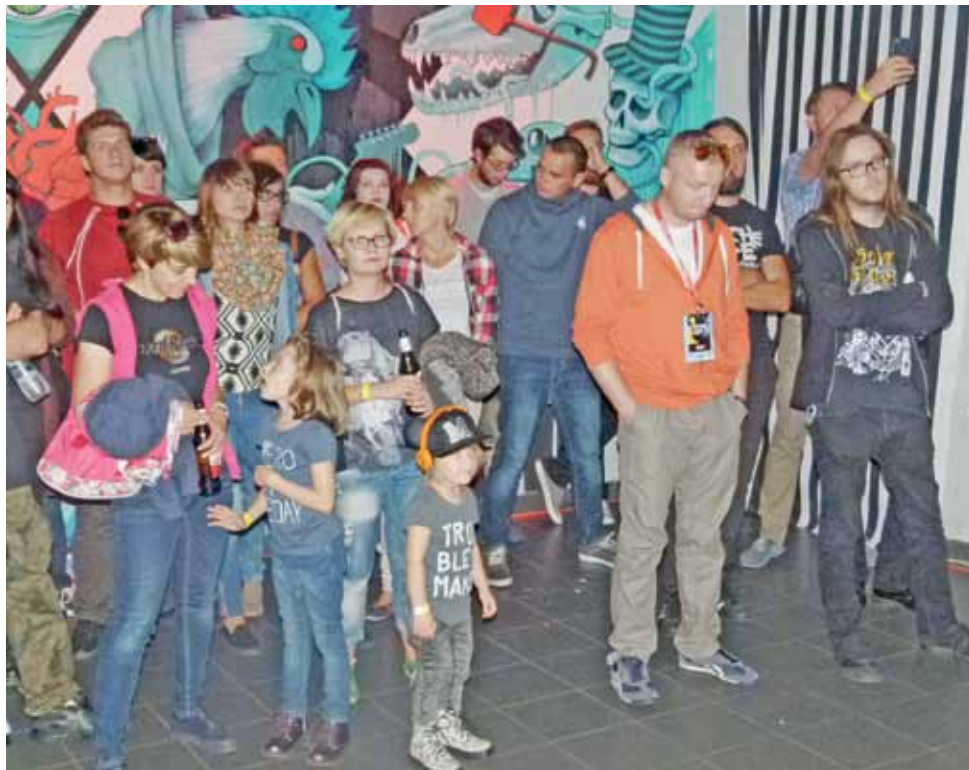
Publiczność festiwalowa w Pracowni w czasie występu The Pau.