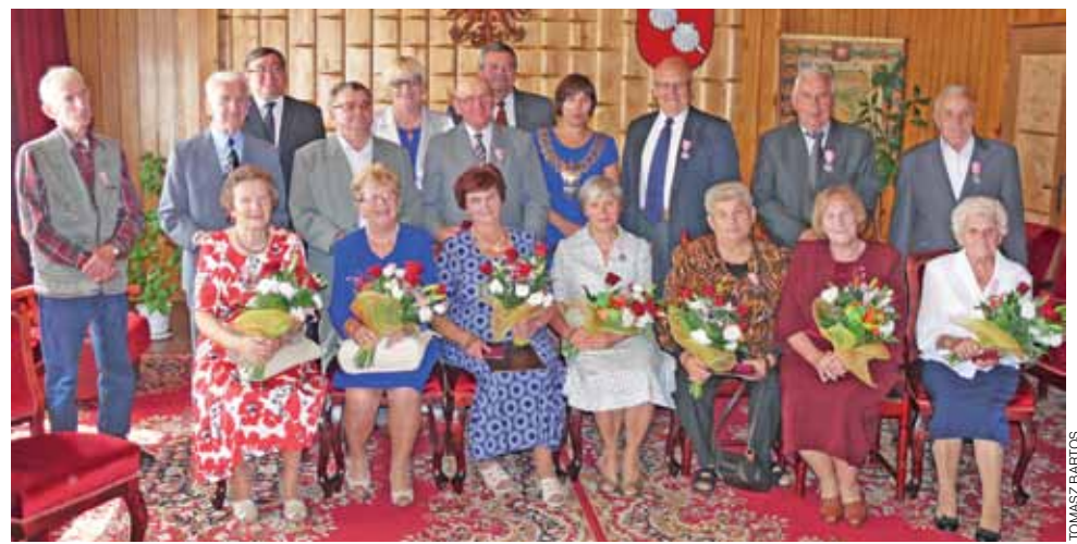
Po oficjalnej części uroczystości wszyscy jubileaci z terenu gminy Bolimów zapozowali do pamiątkowego zdjęcia wspólnie z władzami gminy.

Pary, które przybyły na spotkanie w urzędzie, usłyszały życzenia spędzenia dalszych lat w związku małżeńskim, w zdro-