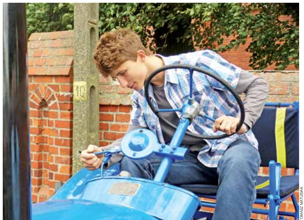
Jedną z atrakcji była wystawa ciągników i możliwość posiedzenia za kierownicą kilku z nich.