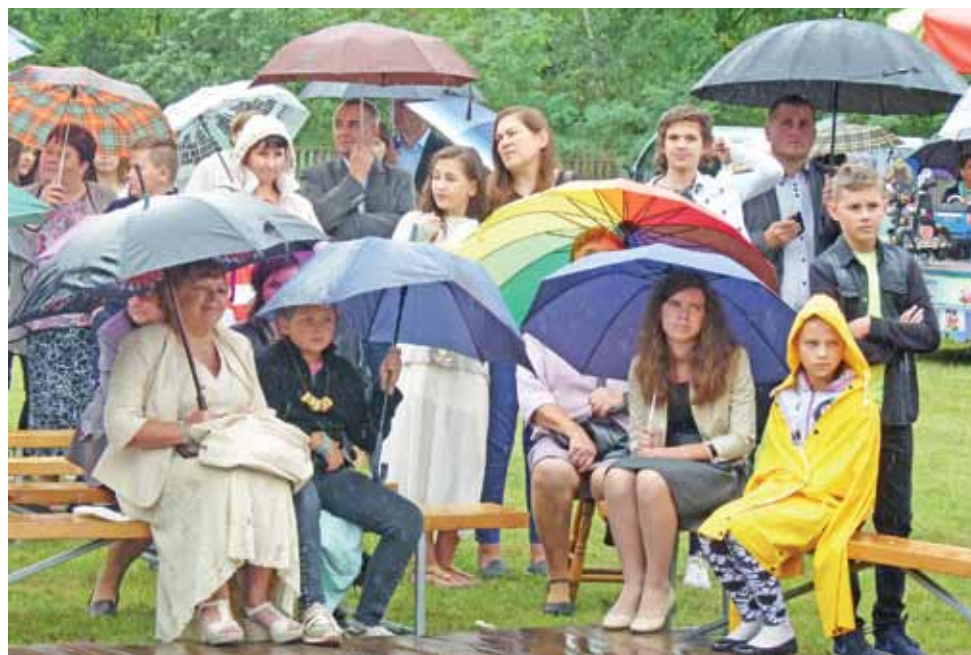
Deszcz nie przeszkodził mieszkańcom gminy Kocierzew Płd. w uczestnictwie w festynie. Niemal każdy z nich zabrał ze sobą parasol.

– Wspieram syna i aktywnie śledzę jego występy, ale więk-