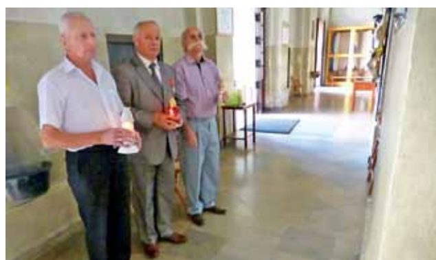
Członkowie Klubu Gazety Polskiej w Łowiczu co roku zapalają znicze pod tablicą w kościele oo. pijarów.