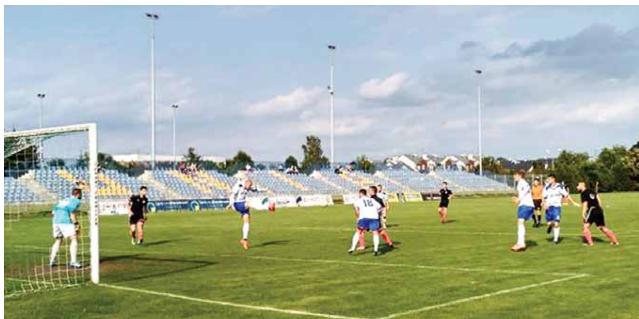
W meczu 2. kolejki łódzkiej IV ligi piłkarze KS Kutno zremisowali 1:1 na wyjeździe z Unią Skierniewice.