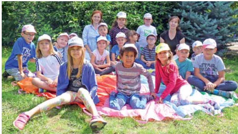
Na zakończenie warsztatów „Kolorowe wakacje” uczestnicy zrobili sobie wspólne zdjęcie w samodzielnie ozdobionych czapkach z daszkiem.

Między twórczą pracą odbyło się wiele zabaw, pośród których dzieciom najbardziej podobały się te z wykorzystaniem kolorowej chusty. W czasie jednej z nich uczestnicy umówili się, że chusta to morze,