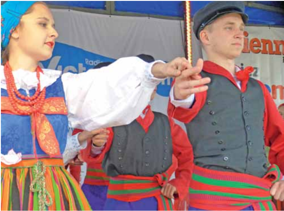
Na scenie nie mogło zabraknąć folkloru. Wystąpił Zespół Pieśni i Tańca „Sanniki”.