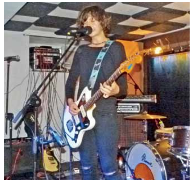
The Pau na scenie w Pracowni.

O ostatecznym zestawie wykonawców pracownicy ŁOK zdecydowali wspólnie. Dyskutowali o tym, kogo można zaprosić, kto będzie pasował do koncepcji festiwalu, a z kogo trzeba będzie zrezygnować ze względów finansowych. Wybrane kapele udało się sprowadzić do Łowicza stosunkowo łatwo. Tylko jednemu z planowanych początkowo zespołów kolizja terminów nie pozwoliła przyjechać na festiwal.