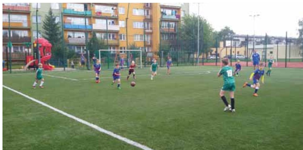
Mecz sparingowy młodych piłkarzy KS Żychlin rocznik 2006 w Łowiczu.