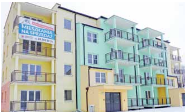
Sprzedano 2 kolejne mieszkania w bloku budowanym przez TBS Zgierz

Dla gminy to bardzo ważne, bowiem Urząd Gminy Żychlin kupił w 2014 roku blok od TBS Zgierz za kwotę 2.490.000 zł. Co roku, przez 10 lat gmina ma spłacać do TBS po 249.000 zł rocznie. Sprzedaż kolejnych mieszkań oznacza,