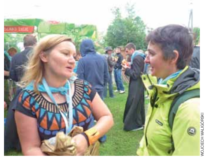
Pielgrzymi na postoju przy kościele św. Anny w Bolimowie.

Bolimów | W drodze do Niepokalanowa pielgrzymi mieli tu postój