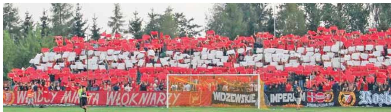
Kibice Widzewa zapelnili na stadionie barwną oprawę.

Piłkarze Pelikana znów mogą mówić o sporym niedosyć. Drugi raz z rzędu przegrali, chociaż ponownie na pewno nie byli zespołem słabszym. Mieli swoje okazje, które mogli zamienić na bramki. Zarówno przy stanie 0:0, jak i w momencie, gdy musieli już gonić wynik. Fakty są jednak takie, że w tym sezonie biało-zieloni zapunktowali tylko w meczu z Motorem Lubawa, który po trzech kolejkach jako jedyny miał zerowy dorobek punktowy. M. Lis