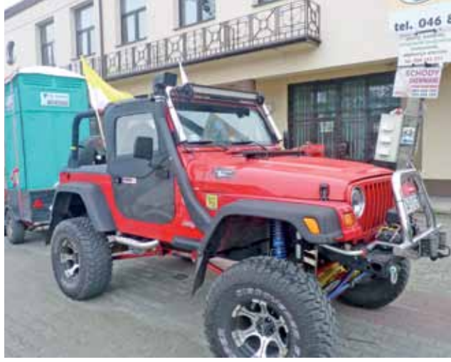
Ten sprzęt towarzyszył pątnikom na całej trasie.