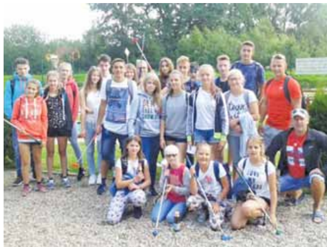
Ekipa UKS Jedyńka Łowicz trenowała w Pogorzeliczy.

Pogoda nie rozpieszczała młodych sportowców, a wszystkie zajęcia odbywały się na dworze, zatem lekkoatleci musieli wykazać się dobrą wytrzymałością i odpornością. Oprócz co-