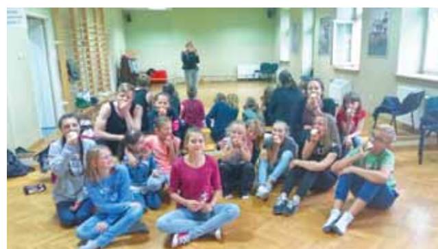
Krátka przerwa podczas warsztatów - można w jej trakcie zjeść jabłko i zrobić sobie wspólne zdjęcie.