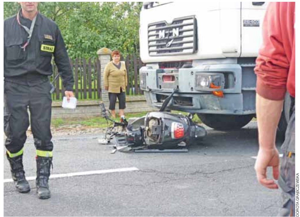
Miejsce tragedii krótko po wypadku.

– To skrzyżowanie drogi od kościoła z drogą wojewódzką 573 jest bardzo niebezpieczne – mówią zgodnie mieszkańcy. – Jak przed pobliskim sklepem stanie ciężarowy samochód, to widoczności praktycznie nie ma. Nieraz dochodziło tu już do wypadków i stłuczek. Należałoby coś pomyśleć, aby poprawić na nim bezpieczeństwo. By znów nie doszło do tragedii. dag