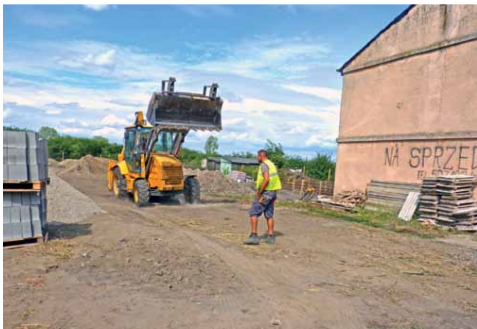
Rozpoczęła się budowa marketu Dino na „Kurzyjamie”. Budynek obok zostanie zburzony.

Zawiadomienie opublikowano na stronie BIP urzędu, tablicy informacyjnej urzędu oraz na tablicach sołectw: Podgajew, Gołędzkie, Wola Owsiana, Wola Prosperowa, Kurów Wieś, Janów, Jastrzębia, Kamienna, Oporów, Wólka Lizi-głódz, Mnich Południe, Mnich Ośrodek, Samogoszcz, Skórzewa, Stanisławów. dag