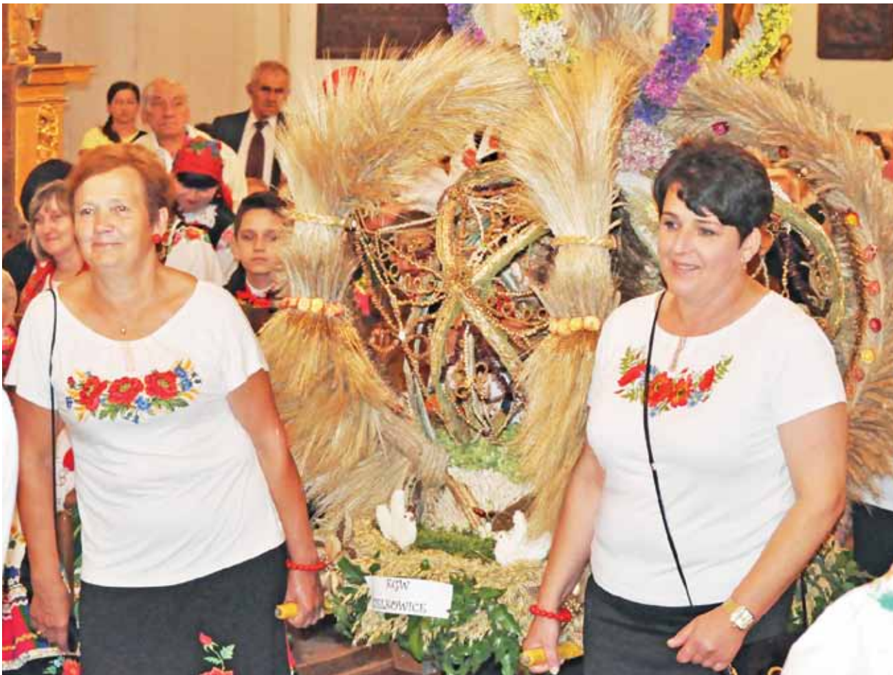
Wieniec dożynkowy wykonany przez KGW Zielkowice był w tym roku najbardziej okazały.