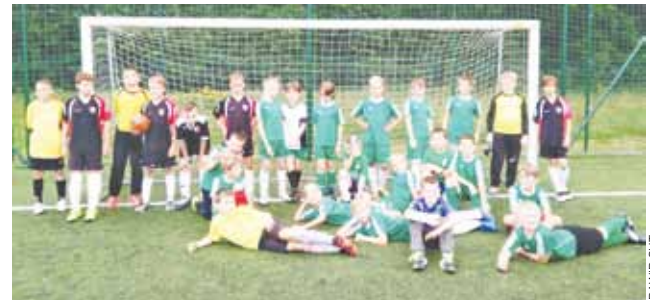
Wspólne zdjęcie Pelikana 2006 z graczami Polonii Warszawa.

W barwach „Czarnych Koszul” wystąpili zawodnicy z roczników 2004 i 2005. Mimo tego łowiczanie dzielnie walczyli o każdy centymetr boiska i spisywali się dobrze. Wynik w meczu meczu był sprawą drugorzędą, ale młodszym zawodnikom Pelikana udało się czterokrotnie wpakować piłkę do siatki, z czego „Biało-Zieloni” bardzo się cieszyli. Rywale z War-