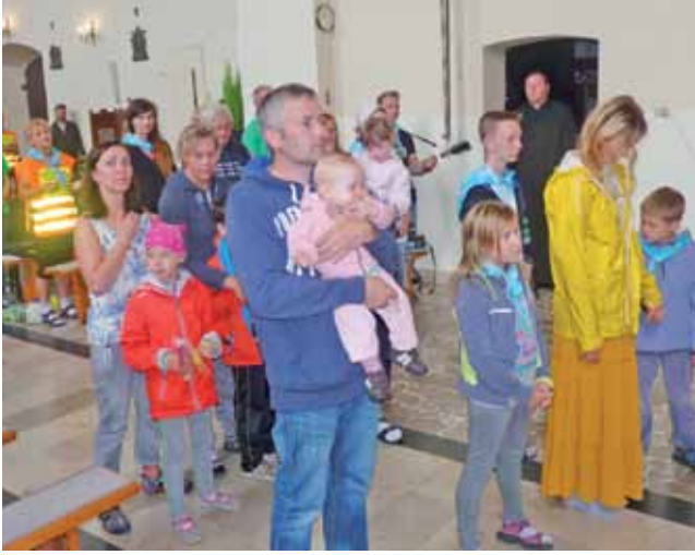
Blogostawieństwo dla dzieci na mszy św. w tym kościele.