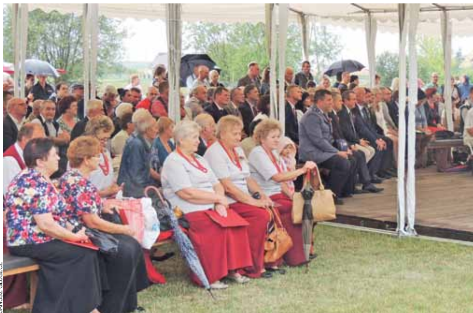
Uroczystości odbywały się na boisku w Wojszycach, publiczność siedziała pod zadaszeniem.