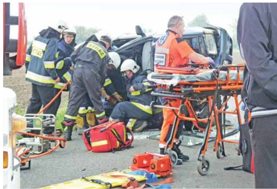
W Woli Popowej kierowcę Skody Felicii wydobywali strażacy z OSP Żychlin, którzy jako pierwsi przyjechali na miejsce zdarzenia.

Na pomoc strażakom ochotnikom jechali zawodowi strażacy samochodem ratownictwa drogowego, ale ochotnicy z Żychlina doskonale poradzi sobie sami. Rozcięli blachy pojazdu, po kilku minutach poszkodowany mężczyzna został wydobyty. Na drodze nie było widać śladów hamowania. Droga w Woli Popowej, gdzie doszło do zdarzenia, jest bardzo wąska, a drzewa rosną tuż obok niej.