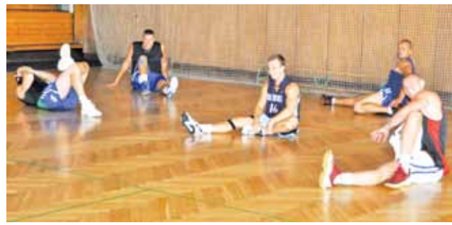
Książacy trenują od 16 sierpnia w hali OSiR nr 1

Już w weekend 2-4 września Książak jedzie na turniej towa-