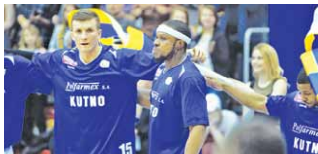
Drużyna Polfarmex Kutno rozpoczyna przygotowania do sezonu.

Od poniedziałku, 22 sierpnia Polfarmex Kutno rozpoczyna przygotowania. Przygotowania do sezonu potrwać siedem tygodni, podczas których Polfarmex rozegra łącznie 11 sparingów. 1. kolejka Tauron Basket Ligi rozpocznie się 9 października, a pierwszy mecz sparingowy 2 września. mr