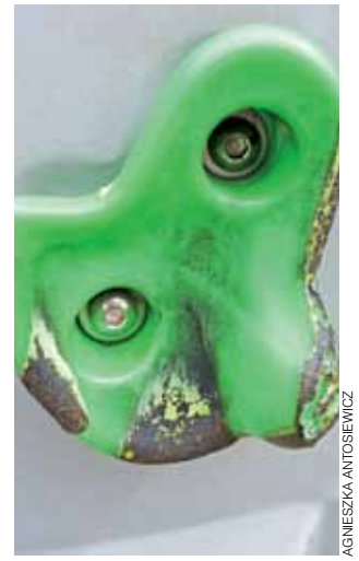
Tak teraz wygląda ścianka wspinaczkowa na placu zabaw przy ul. Miodowej na Górkach – „skałki” są przypalone, a całość obłana cieczą nieznanego pochodzenia.