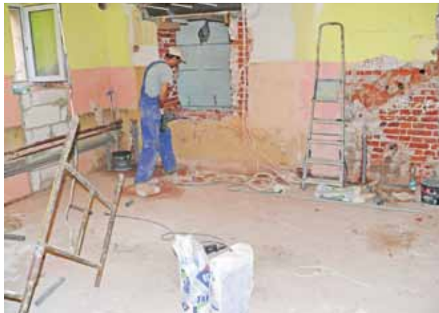
Prace w kuchni w Szkole Podstawowej nr 1, jej modernizacja jest prowadzona od podstaw.

■ W Gimnazjum nr 2 w czasie wakacji wykonano szereg drobniejszych prac remontowych. Malowanie ścian przeprowadzone zostało w trzech salach lekcyjnych, w czwartej sali lekcyjnej i w pokoju nauczycielskim wykonano także cyklonowanie parkietu. Ściany pomalowane zostały także w dyżurce woznych, gdzie oprócz tego położono na podłodze wykładzinę. Prace zostały wykonane własnymi siłami szkoły, przy wsparciu finansowym Rady Rodziców.