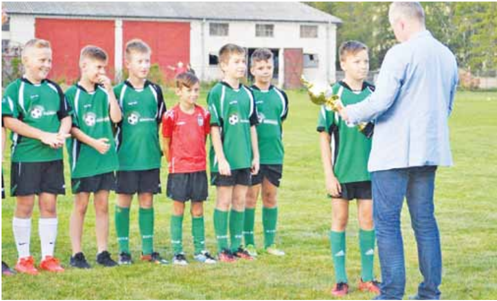
Młodzi piłkarze GKS Bedno rocznik 2005 odbierają puchar za zdobycie mistrzostwa w kategorii Orlik.