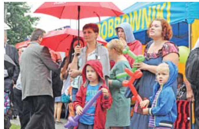
Atrakcji dla dzieci nie brakowało , najmłodsi uczyli się np. „modelowania balonów”, czyli takiego ich wiązania, żeby przypominały np. figurki zwierząt.