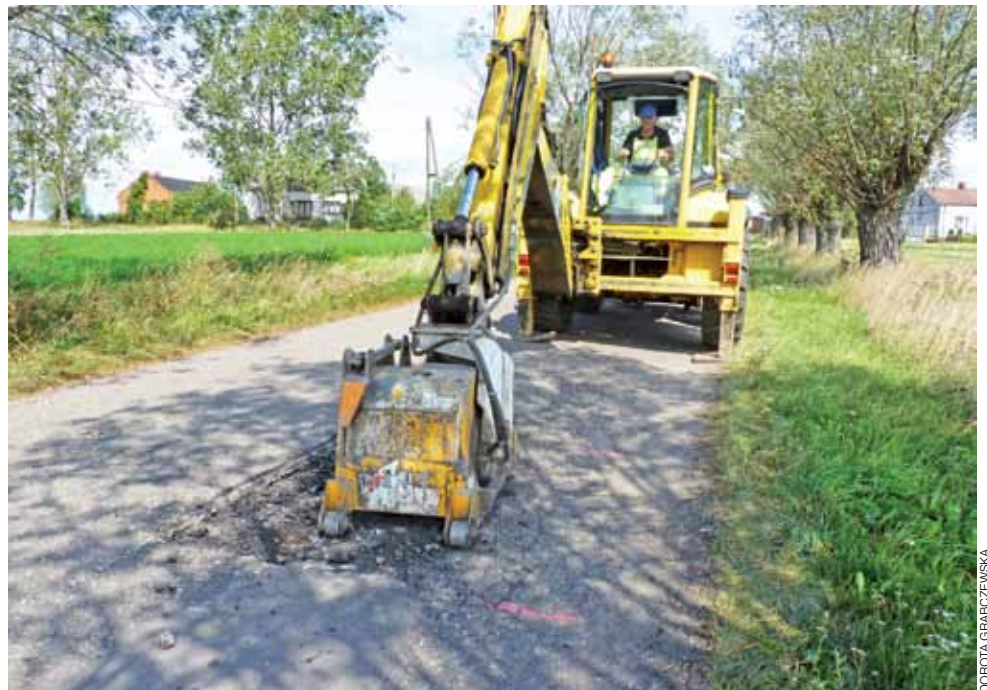
Na zlecenie powiatu firma PRD Kutno, podwykonawca Erbedimu, łatała dziury po zimie od Śleszyna do Białej.

Pocieszające jest tylko to, że w tym roku starostwo w Kutnie