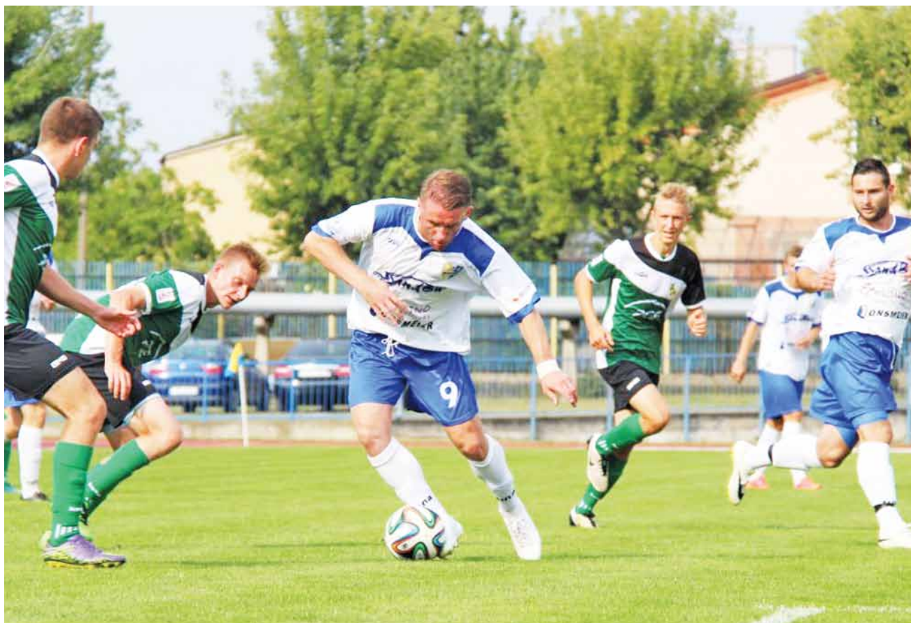
Rozgrywki łódzkiej IV ligi pomiędzy KS Kutno a GKS Bełchatów II, zakończony remisem 1:1.

■ Ceramika Opoczno – Unia Skierniewice 0:0