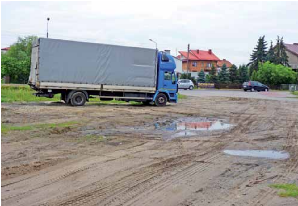
Na placu przy ul. Miodowej praktycznie przez cały czas można zauważyć zaparkowane samochody ciężarowe. Przejeżdżając przez plac tworzą koleiny, które po deszczu zamieniają się w kałużę.

– Z tego co tu się wyprawia, można by film nakręcić. Jak nie było zrobionej tej ulicy, to tu się samochody zakopywały, a jak już się rozpoczęły prace i nawozili materiały, to taki huk był w nocy, jak te łychy waliły, że spać się nie dało – mówiły nam mieszkanki ulicy Miodowej. – Podobnie z tymi ciężarówkami. Wiadomo, trzeba być człowiekiem i zrozumieć, że każdy