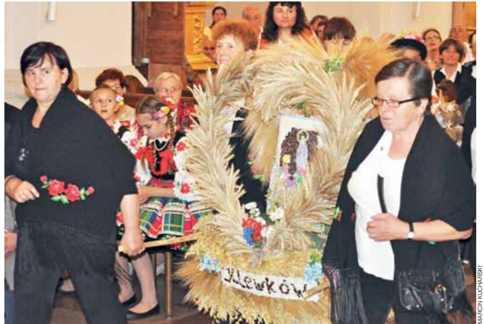
Wieniec dożynkowy przygotowany przez mieszkańców Klewkowa.