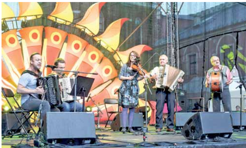
Kapela Dobrzelinacy zagrała na scenie w Lublinie z Czesławem Mozilem.