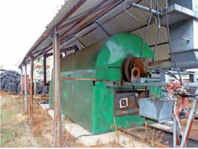
Pilotażowa inwestycja utylizacji odpadów funkcjonuje na działce Włodzimierza Stacholca od kilku lat. Na niej dopracowywał technologię utylizacji.

Gmina Pacyna | Utylizacja tworzyw sztucznych w Sejkowicach?