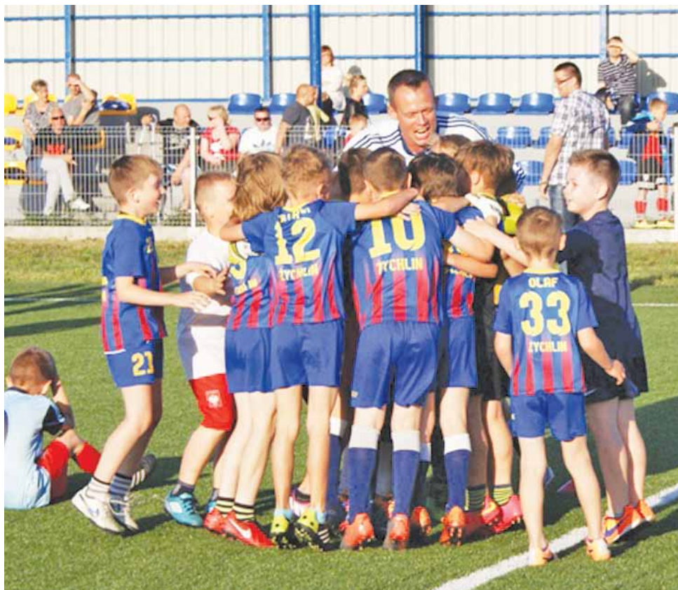
Młodzi piłkarze KS Żychlin rocznik 2006 pokonali ekipę Sand Bus Kutno 10:5.