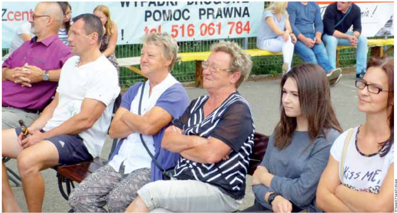
Jubileusz klubu przyciągnął na stadion wielu mieszkańców Bełchowa, którzy chętnie oglądali zarówno mecze, jak i występy na scenie.