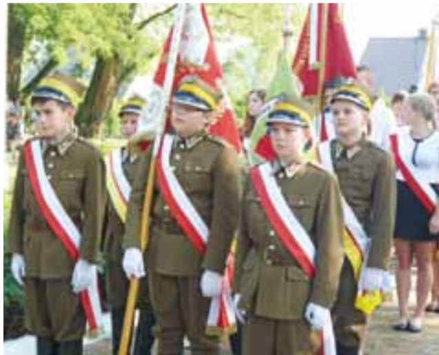
W uroczystościach wzięli też udział liczne delegacje z pocztami sztandarowymi, przede wszystkim ze szkół.

Wiele osób z zacięciem obejrzało pokaz musztry kawalerzystyjskiej w wykonaniu członków Towarzystwa Byłych Żołnierzy i Przyjaciół 15. Pułku Ułanów Poznańskich. Tradycją stało się, że