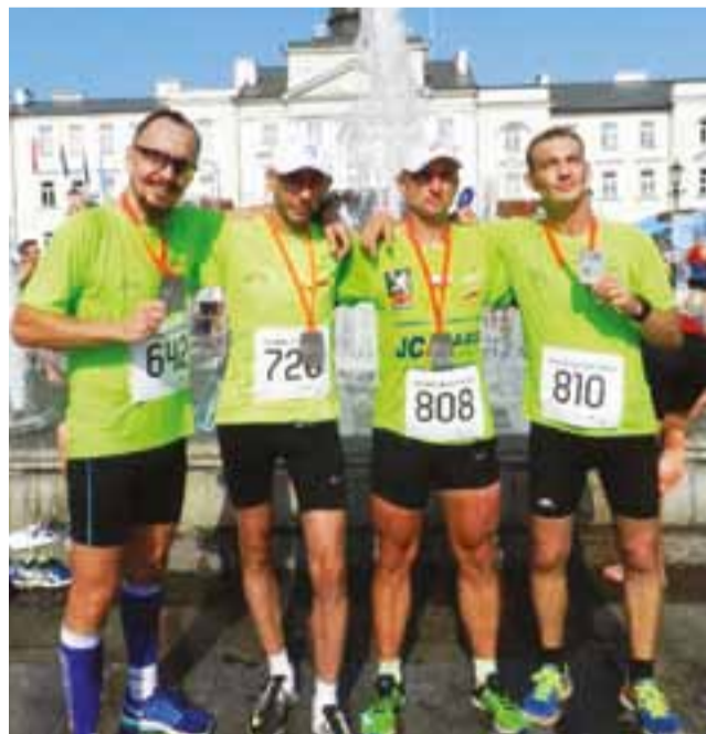
Grupa żychlińska "Rozbiegani" podczas piątej edycji Półmaratonu Dwóch Mostów w Płocku.

Nagrody finansowe w klasyfikacji generalnej kobiet i mężczyzn przyznano za miejsca od I do X. Nagrody rzeczowe otrzymali zawodnicy: w kategoriach wiekowych kobiet i mężczyzn: I-III miejsce oraz w kategorii miesz-