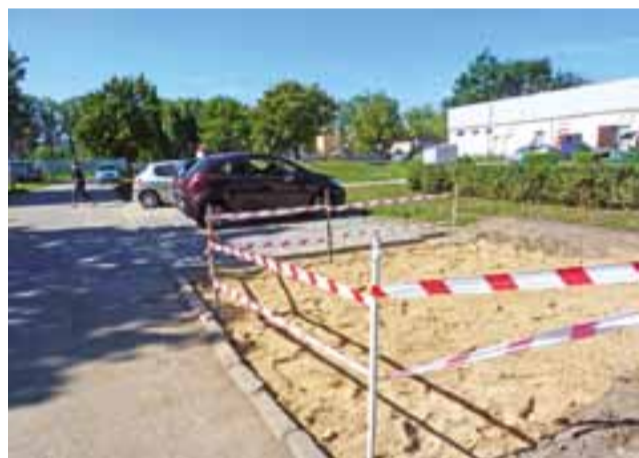
Pracownicy Spółdzielni Mieszkaniowej robią osiedlowy parking przy wewnętrznej ulicy Łąkowej 3.

W gminie Pacyna złożono 25 wniosków, w gminie Sanniki 59 wniosków, w gminie Szczawin Kościelny 111 wniosków, w gminie Gostynin 123 wnioski. Rozpatrzenie wspólnego wniosku nastąpi w I kwartale 2017 roku. dag