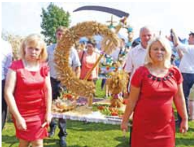
Nie jest łatwo, szczególnie kobietom, w dodatku w upały, udźwignąć ciężar wieńca dożynkowego, który tylko z pozoru wygląda na lekki.