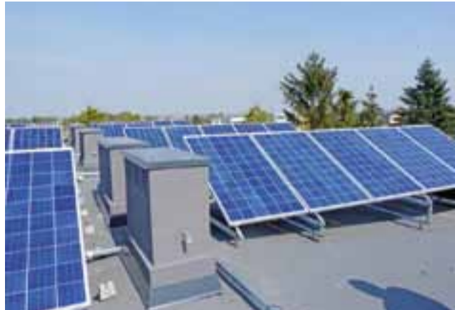
Na dachu urzędu ustawiono 40 sztuk paneli voltaicznych.

Włodarze gminy przychylił się do propozycji wykonawcy. Schody w budynku będą z droższych, ale bardziej trwałych i estetyczniejszych płyt granitowych. Układanie płyt granitowych już rozpoczęto. Wyglądają imponująco, choć praca wciąż nie jest skończona.