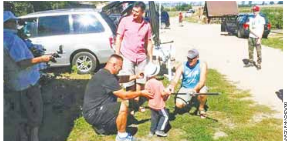
Gratulacje i wręczanie nagród uczestnikom wędkowania w Oporowie.

Warto nadmienić, że zawody są kolejnym dowodem współpracy Koła PZW w Żychlinie z Zespołem Szkół w Oporowie, która prowadzi do utworzenia szkółki wędkarskiej przy szkole w Oporowie. Dodac należy także, że w czerwcu br. uczniowie szkoły wykonali podesty do wędkowania,