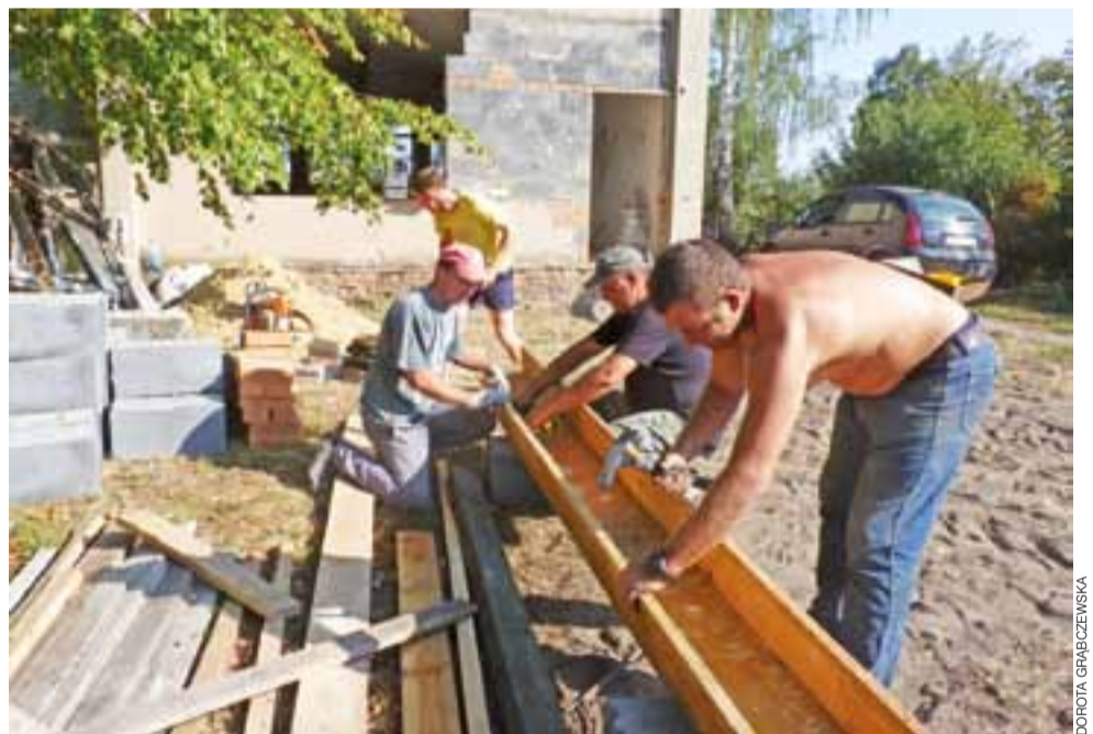
Mieszkańcy Remek chętnie przychodzą do pracy w świetlicy, w której będą mogli się spotykać.

Pracy do wykonania jest bardzo dużo i 5.000 zł, które dała fundacja, nie wystarczy. – Dlatego zwróciłam się do mieszkańców o pomoc – dodaje radna. – Poprosiłam, aby mieszkańcy przekazywali zbędne materiały budowlane, albo wpłacali pieniądze, za które zakupimy potrzebne mate-