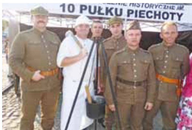
Stowarzyszenie Historyczne 10 PP wystawiło stoisko, na którym prezentowali m.in. zestaw do gotowania dla łącznościowców, którego jednym z elementów był kociołek.