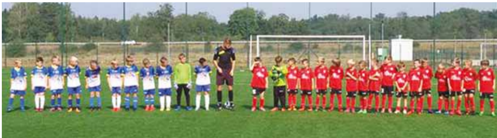
Drużyny z rocznika 2006: KS Żychlin oraz Termy Uniejów podczas 1. kolejki E1 Orlik grupy IV.