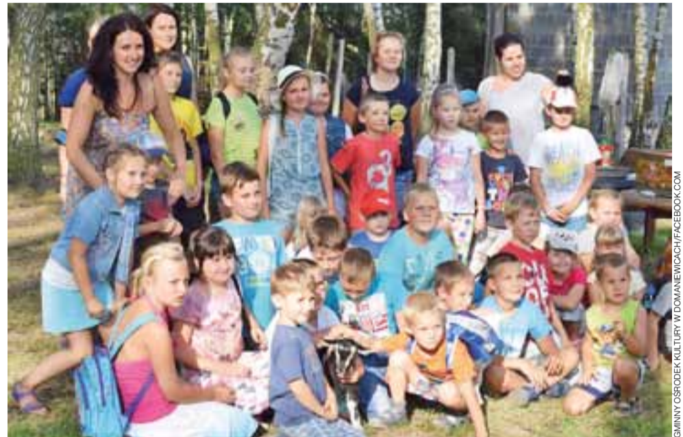
W ramach organizowanej przez Gminny Ośrodek Kultury w Domaniewicach akcji „Zakończenie wakacji” 29 sierpnia dzieci z terenu gminy wybrały się na wycieczkę do ogrodu zoologicznego w Łodzi oraz miejscowości Jaroszk, znajdującej się na terenie Parku Krajobrazowego Wzniesień Łódzkich. W tym drugim miejscu obejrzyli pokaz sokolniczy w wykonaniu dwóch ptaków: Artura i Nadii. Na koniec nie zabrakło również ogniska. opr. kl

RZUT OKIEM | DZIECI ODWIEDZIŁY ZOO I SOKOLNIKÓW