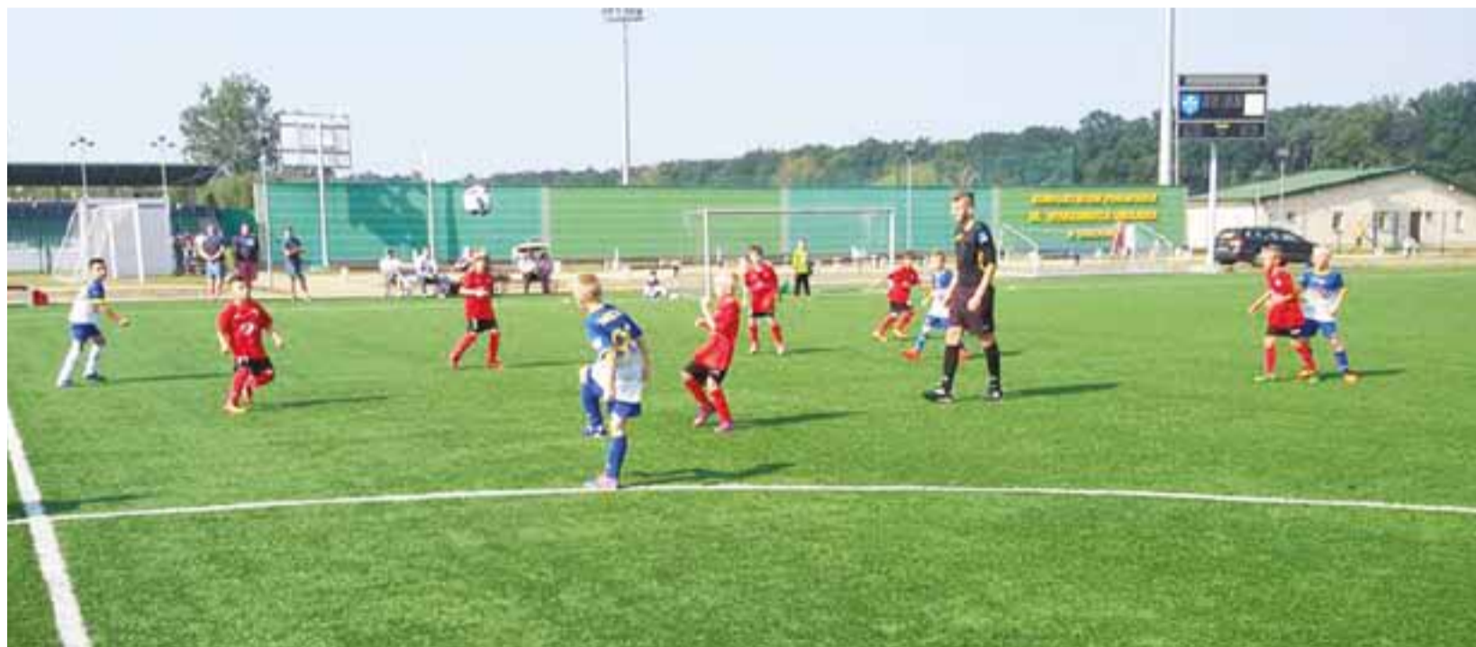
Wygrane 4:3 przez KS Żychlin rocznik 2006 spotkanie w Uniejowie z tamtejszym zespołem Termy Uniejów.