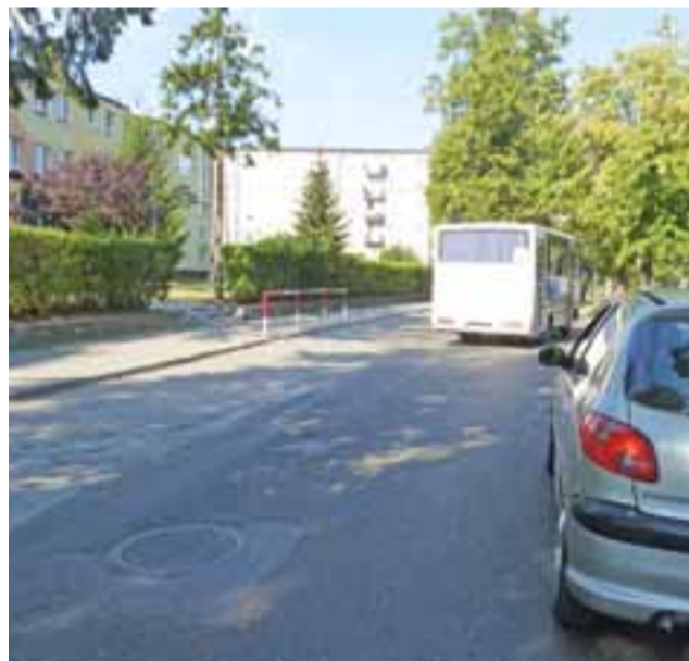
Po modernizacji ulicy Żeromskiego zapewne poprawi się bezpieczeństwo w pobliżu Zespołu Szkolno-Przedszkolnego nr 2 w Żychlinie.

– Planowana jest modernizacja odcinka drogi od skrzyżowania