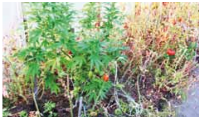
38-letni mieszkaniec Kutna uprawiał konopie indyjskie wraz z plantacją pomidorów. Usłyszał już zarzuty, za które grozi mu do 3 lat pozbawienia wolności.

Kutnowscy policjanci ds. zwalczania przestępczości narkotykowej zatrzymali 38-letniego mieszkańca Kutna, który razem z pomidorami uprawiał konopie indyjskie oraz posiadał marihuane. Mężczyzna usłyszał zarzuty zagrożone karą do 3 lat pozbawienia wolności.