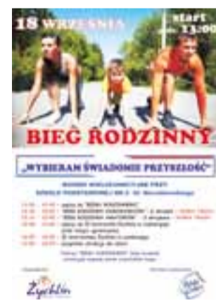
Plakat informacyjny o Biegu Rodzinnym w Żychlinie - w dniu 18 września 2016.

Jako pierwszy – w godzinach 13.30 – 15.00 odbędzie się „Bieg zawodowców”, jego trasa liczyć będzie sześć pełnych okrążeń ulicami miasta. Natomiast zaraz po nim ruszy „Rodzinny bieg ama-