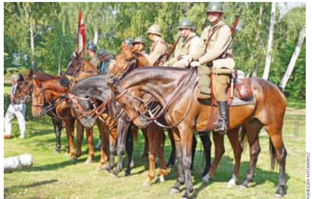
W obchodach po raz kolejny uczestniczyli przedstawiciele Towarzystwa Byłych Żołnierzy i Przyjaciół 15. Pułku Ułanów Poznańskich.