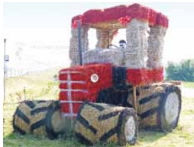
Rzeczywistych rozmiarów traktor, wykonany z balotów i belek słomy, stoi przy zjeździe do Czatolina. Zwraca uwagę wielu kierowców.