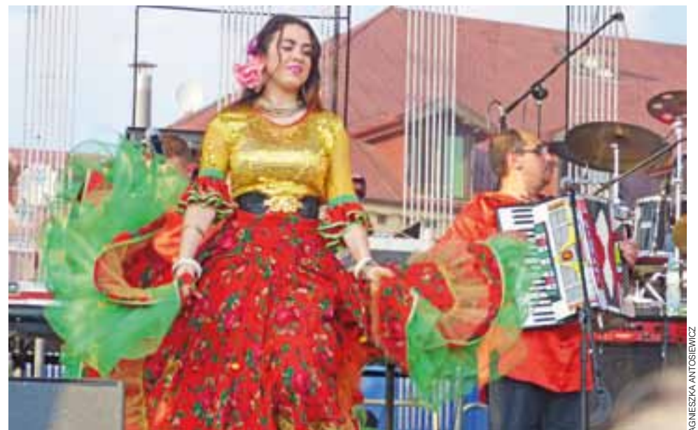
Tancerka z grupy Terne Roma zachwycała publiczność urodą i tańcem.