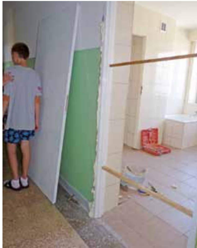
W budynku MOS, który od roku jest czynny, zaistniała konieczność wymiany 6 drzwi w sanitariatach, bowiem rozeszły się zarówno ościeżnice, jak i drzwi do tekturny.

Na tym jednak nie koniec problemów. Wokół drzwi pojawiły się pęknięcia wynikające z wadliwego zamontowania i niewyregulowania samozamykaczy. Kolejny to łuszcząca się farba lamperii. Po-