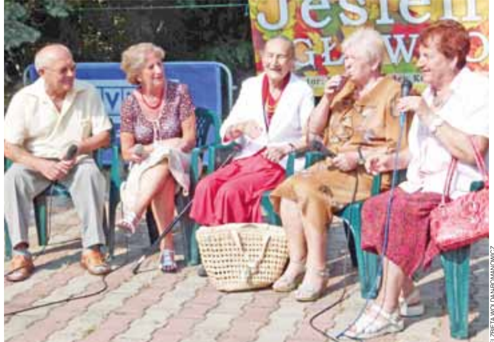
Na wesoło. Grupa Uśmiech Seniora z Łowicza w programie satyrycznym „Laweczka”. Posypały się pikantne dowcipy...

Główno | Spotkania artystyczne pod naszym patronatem