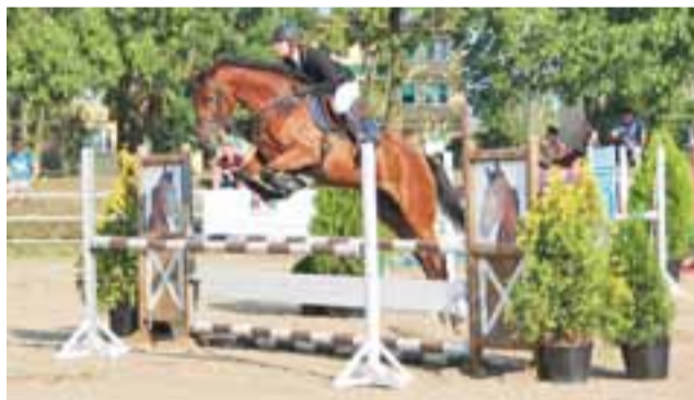
Uroczystościom patriotycznym towarzyszyły Regionalne Zawody w Skokach przez Przeszkody.

W samo południe rozpoczęła się niedzielna część Regionalnych Zawodów w Skokach przez Przeszkody – Memoriał 17. Pułku