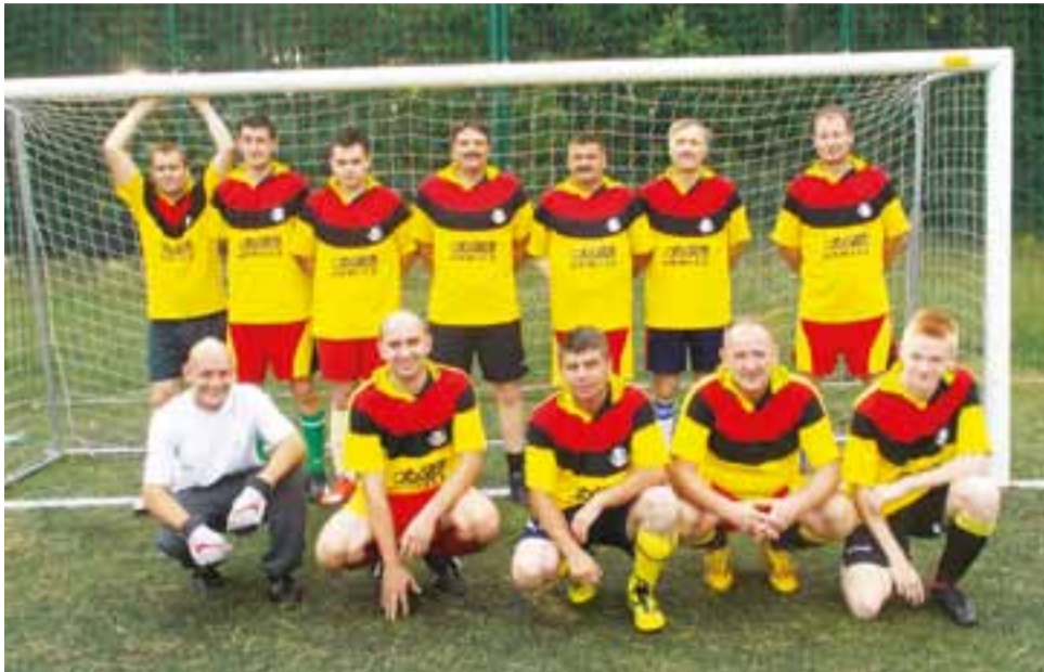
Tryumfatorzy turnieju w Nieborowie PSS Społem Łowicz