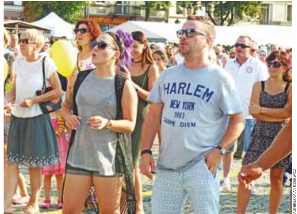
Utwory wykonywane przez zespół coverowy Drugi Tydzień ze Skierniewic sprawiły, że osoby stojące pod sceną zaczęły podrygiwać do tańca.

Łowicz | Księżackie Jadło 2016 już za nami