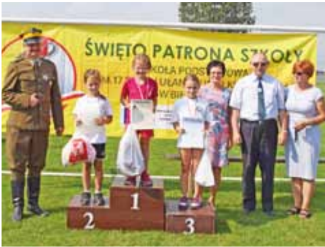
Laureatki na podium. Uroczyste podsumowanie XII Ułańskich Biegów i wręczenie nagród zwycięzcom odbyło się na boisku w Bielawach.