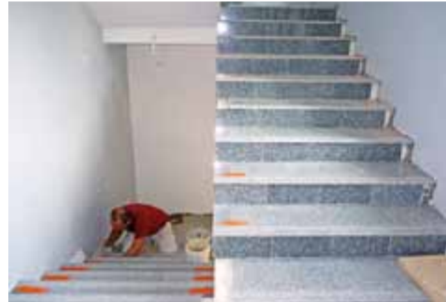
Zdecydowano, że schody będą wyłożone płytami granitowymi.

Pomieszczenia na I i II piętrze są już skończone. Wszystkie pokoje w budynku są pomalowane na jasnożółty kolor, na podłogach jest czerwony tarkett, ściany na korytarzach mają odcień szarości. Inną kolorystykę – szarości mają jedynie pomieszczenia sekretariatu oraz pokoje obu burmistrzów. Tam też nie będzie tarkettu tylko wykładzina dywanowa. Wszystkie ościeżnice i drzwi w urzędzie są w kolorze bieli. We wszystkich pomieszczeniach zamontowano energooszczędne oświetlenie ledowe. Na korytarzach są czujki antydymowe oraz oświetlenie awaryjne. Na II piętrze jest kłapa antydymowa na wypadek pożaru, zgodnie z zaleceniami strażaków. Na każdej kondygnacji jest osobna rozdzielnia energetyczna. W przerobionych sanitariatach na II piętrze będzie jeden WC oraz pisuar, 2 umywalki oraz duże lustro wmontowane w ścianę. Na I piętrze będą dwa WC