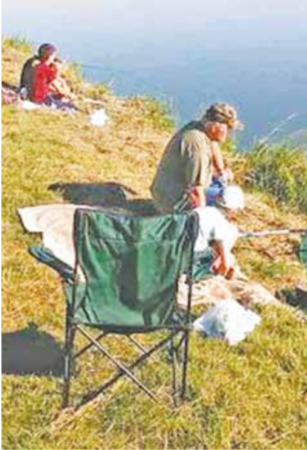
Uczestnicy zawodów w wędkarstwie spławikowym "Zakończenie Lata 2016" w Oporowie.

Wędkarstwo | Zawody w wędkarstwie spławikowym