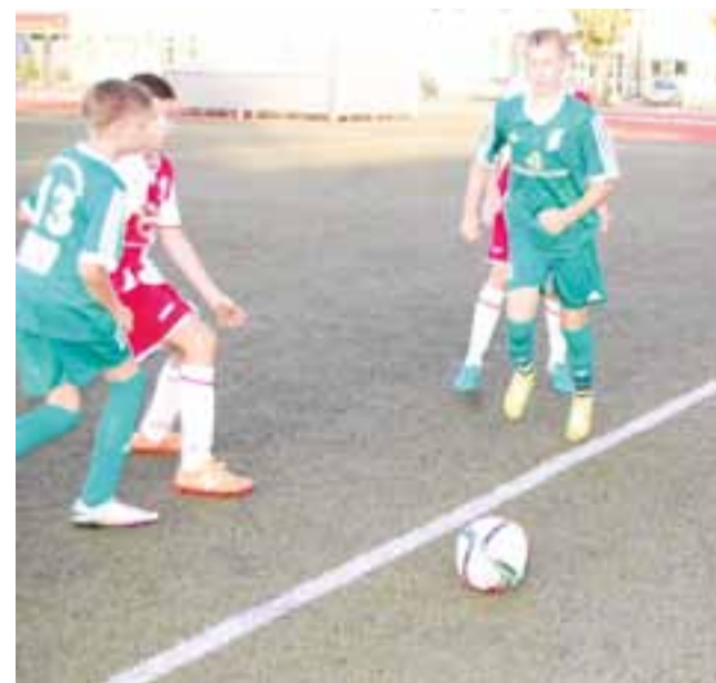
Łowiczanie w meczu z ŁKS-em II byli bez szans

Pelikan 2002 było stać na zdobycie dwóch goli, ale proste błędy w defensywie były wykorzystywane przez rywali i to drużyna z Wiśniowej Góry mogła cieszyć się ze zdobycia kompletu punktów. ever