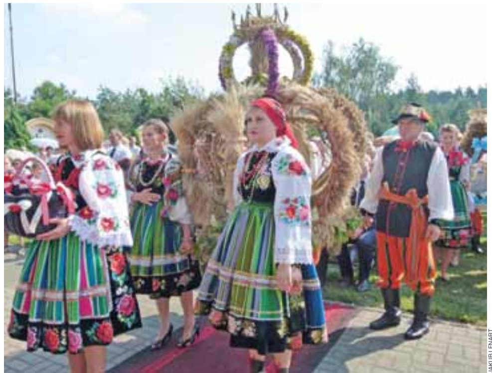
Dożynkowe wieniec potrafią być naprawdę imponujące.

Bardzo liczną, bo aż 165-osobową grupą, do Domaniewic przyszli wierni z parafii pw. św. Andrzeja Apostoła i św. Małgo-