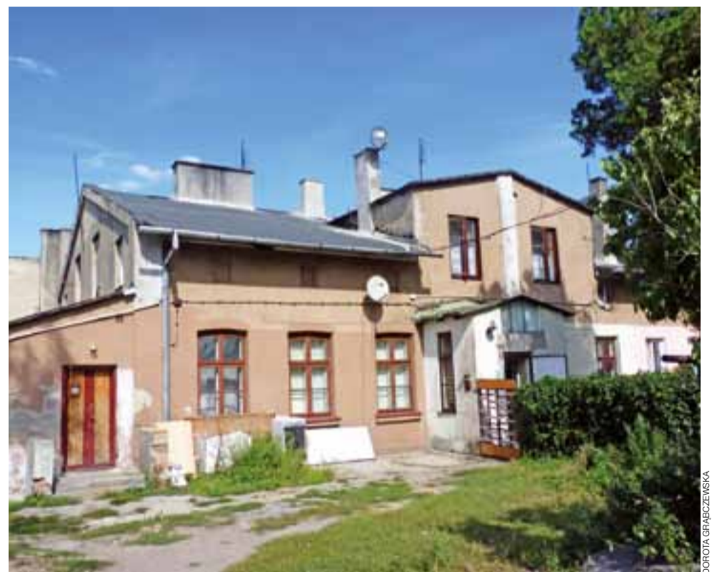
Na budynku przy 3 Maja 5 poprawiono kominy oraz ułożono już część nowej papy.

Pamiętamy, że SZB na wszystkie remonty w zasobach komunalnych dostał od gminy tylko 40.000 zł. To kropla w morzu potrzeb remontów starych kamienic. dag