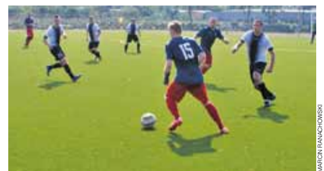
Spotkanie 3. kolejki łódzkiej B klasy grupy I, podczas którego KS Żychlin wygrał u siebie z Iskrą Głowno 2:1.