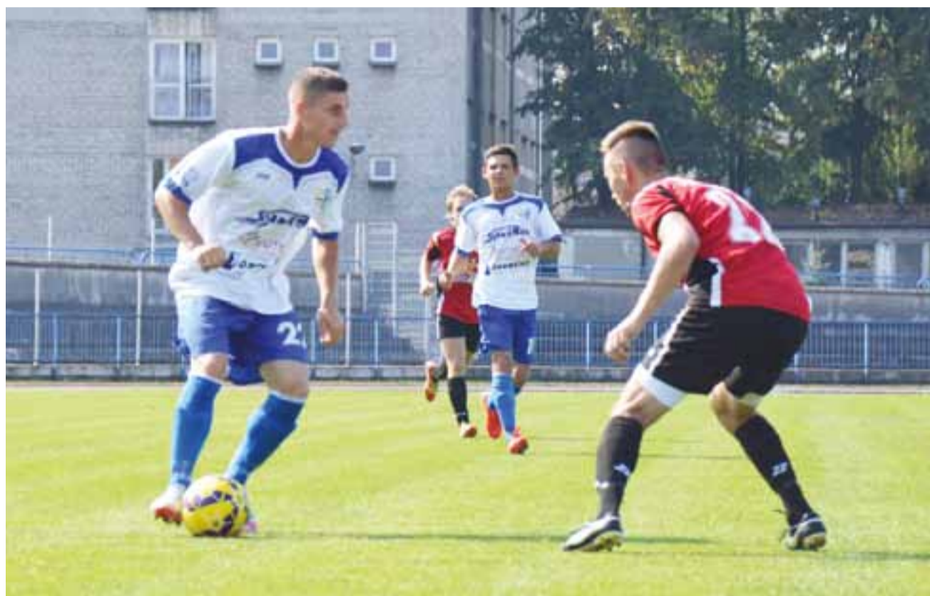
KS Sand Bus Kutno przegrał na własnym boisku z Pilicą Przedbórz 0:1 podczas meczu 8. kolejki łódzkiej IV ligi.