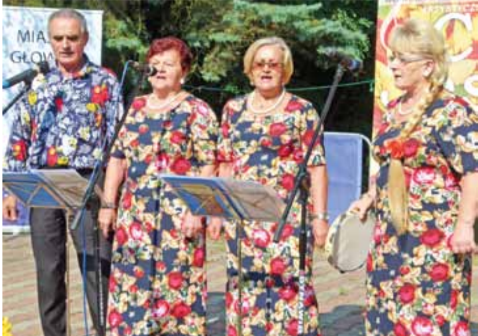
Finezja z Kutna. Ten zespół na Czar Jesieni do Główna przyjechał po raz pierwszy. Zajął II miejsce w konkursie specjalnym – na najbardziej rozbawiony zespół.