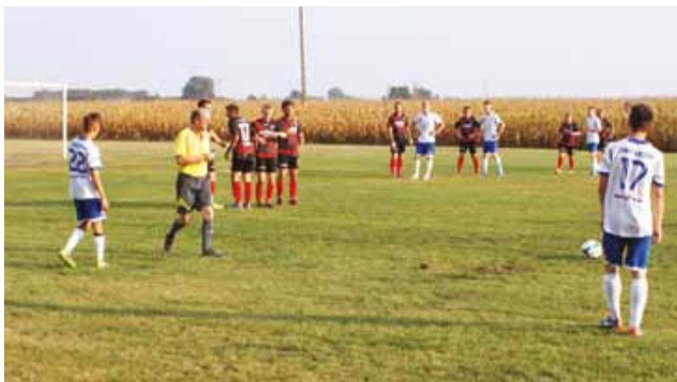
Spotkanie 5. kolejki łódzkiej okręgówki, w którym GKS Bedno podejmował na własnym boisku Zawiszę II Rzgów.