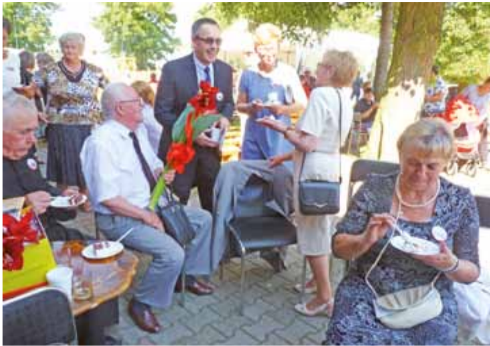
Jubileusz szkoły w Szewcach Nadolnych był okazją do spotkania i wspomnień zarówno byłych nauczycieli, jak i absolwentów szkoły.

W tym momencie uczniowie szkoły podchodzili do byłych na- uczycieli szkoły, wręczając kwiaty jako wyraz podziękowania. Były