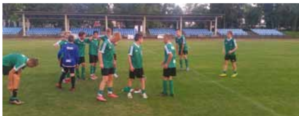
Gracze Pelikana świętowali wygraną w Wieluniu