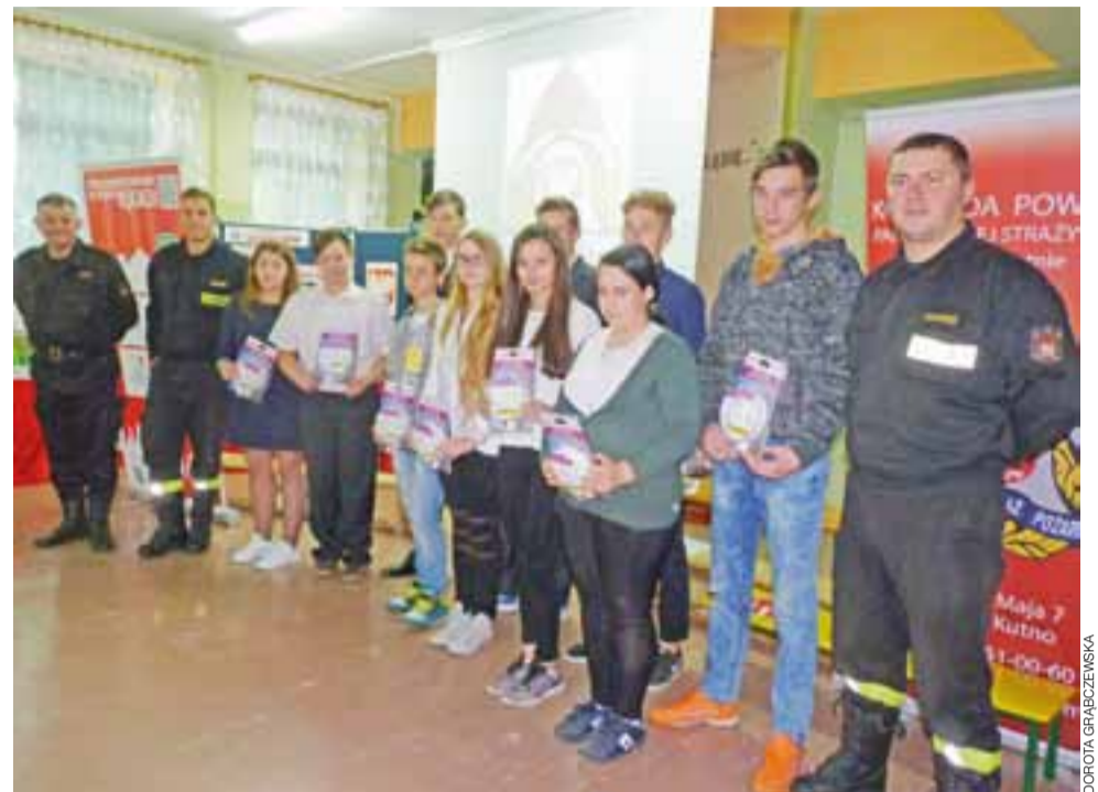
Dziesięciu gimnazjalistów z Bedlno zostało obdarowanych przez strażaków z PSP Kutno darmowymi czujkami reagującymi na tlenek węgla i dym.

Na koniec przekazali na ręce dyrektora broszury informacyjne i prosili, by gimnazjaliści swoją wiedzę przekazali rodzicom i znajomym. dag