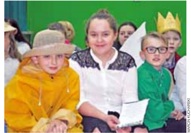
Uczniowie wszystkich klas z Popowa przebijali się, recytowali wiersze o ziemniakach, bądź też przytaczali fakty na tematy związane z uprawą i przyrządzaniem ziemniaków.

Wzorem lat poprzednich rodzice przygotowali potrawy z ziemniaków. Można było spróbować m.in. wielu odmian sałatek z ziemniakami, klusek, chipsów, placków itp. Rodzice stanęli na wysokości zadania – stoły aż ugięły się od potraw. Co roku każda z klas przygotowuje odrębne stoisko, na których można kupić kulinarne rarytasy za kilka złotych. Pieniądze zebrane podczas spotkania integracyjnego zasilały fundusz klasowy, z którego opłacane