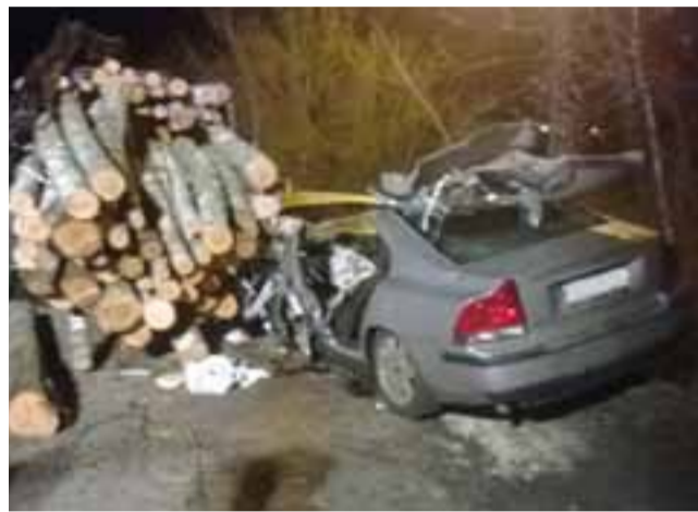
Samochód wbił się w tył stojącej na poboczu przyczepy ciągnikowej załadowanej drewnem.