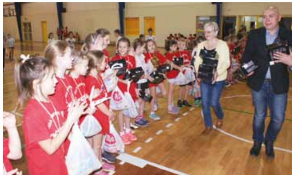
Reprezentacja uczniów klas I-IV SP Nr 2 odbiera puchar za zajęcie pierwszego miejsca, nagrody i medale.

Oprócz dobrej zabawy impreza miała pokazać dzieciom, jak w sposób pozytywny i aktywny spędzić czas wolny. Obserwując radość uczestników podczas dekoracji można zaryzykować stwierdzenie, że zawody zachęciły (szczególnie młodszych) do angażowania się w podobne inicjatywy w przyszłości. Turniejada była również doskonałą okazją do integracji dzieci z różnych szkół. mr