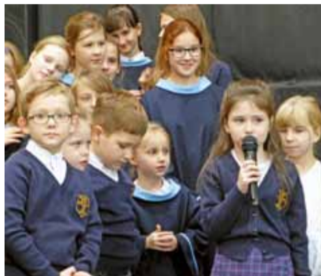
Program artystyczny towarzyszący pasowaniu pierwszoklasistów.

wyjaśnionych przyczyn, zakon został zredukowany ponownie do rangi kongregacji bez ślubów. Na nowo zakon został przywrócony w 1656 roku decyzją Aleksandra VII, już po śmierci jego twórcy i pierwszego generała. Józef Kalasanty został beatyfikowany w 1748 roku, a kanonizowany w 1767 roku. W 1948 roku papież Pius XII ogłosił go patronem wszystkich katolickich szkół podstawowych. Kalasantyński Rok Jubileuszowy, rozpoczęty 27 listopada, ma uczcić jednocześnie 400. rocznicę powstania zgromadzenia i 250. kanonizacji św. Józefa Kalasantego. tm