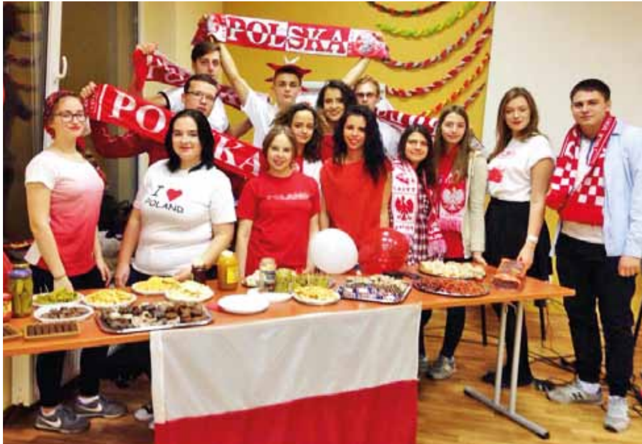
Grupa z Żychlina podczas wieczoru narodowego. Biało-czerwonych akcentów nie brakowało.

W litewskim miasteczku znajduje się centrum sportowe, jak twierdzi młodzież, świetnie wyposażone. str. 3