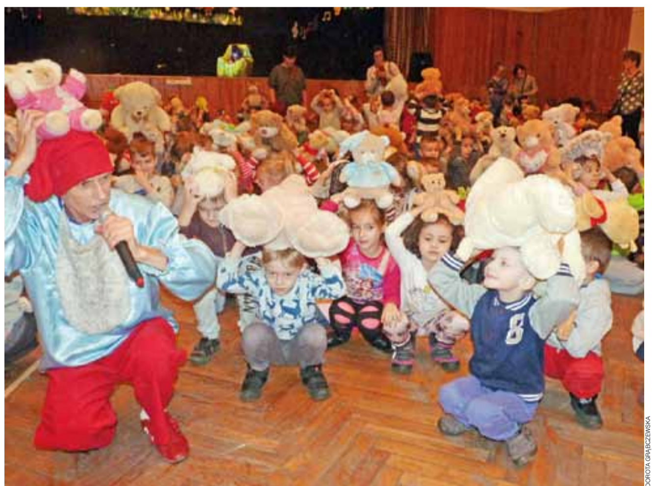
Misiową dyskotekę dla najmłodszych z Żychlina poprowadził animator występujący w roli Papy Smerfa.

Zwolnienia dotyczą gruntów, budynków lub ich części wykorzystywanych na prowadzenie działalności kulturalnej i sportu oraz ochrony przeciwpożarowej. dag