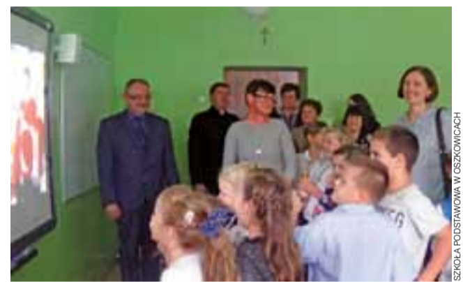
Otwarcie ekopracowni, uroczystość z udziałem m.in. wójta gm. Bielawy.