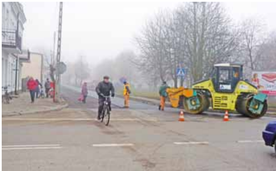
Nowa nakładka asfaltowa od skrzyżowania ulicy Łukasińskiego w stronę oczyszczalni ścieków w Żychlinie była robiona jako ostatnia. Ostatnie prace wykonywano w piątek 25 listopada. Drogowcy zdążyli przed śniegiem i przymrozkami.

Koszt modernizacji odcinka drogi w gminie Oporów (od głównej drogi w Oporowie w stronę Strzelec – 1,325 m) to 196.482 zł, z czego udział finansowy gminy Oporów to 20.000 zł. Uchwałę o partycypacji