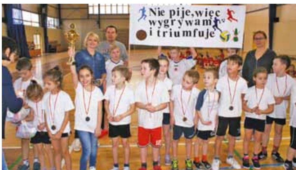
Reprezentacja uczniów Szkoły Podstawowej Nr 1 w Żychlinie.

Na koniec wszystkie zespoły otrzymały puchary, a każdy z uczestników medal, napój i słodycze, zaś zawodnicy zwyciężskich drużyn nagrody rzeczowe.