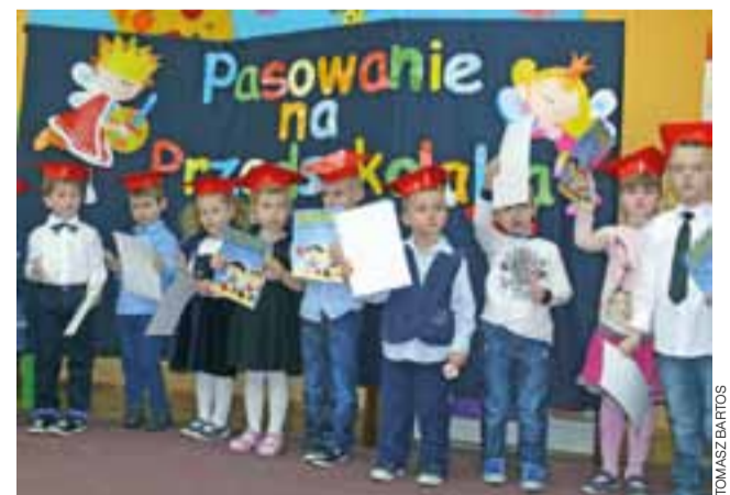
Przedszkolaki ze starszych grup Przedszkola nr 1 Stokrotka w Łowiczu, tuż po ślubowaniu.

Ostatnim elementem uroczystości było ślubowanie. Tu