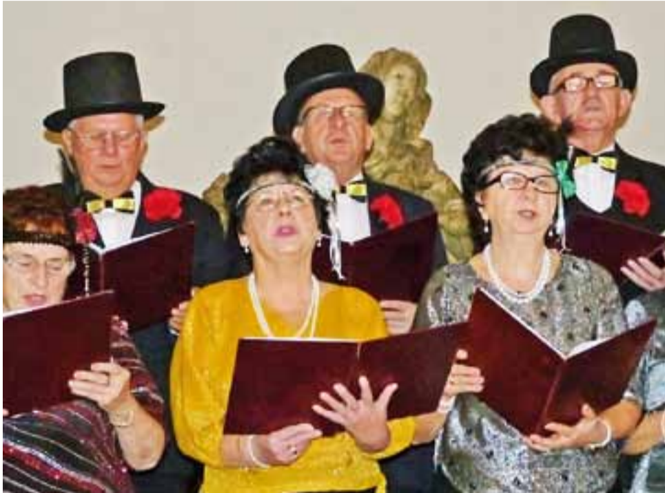
Chór „Młodzi Duchem” z Krośniewic wystąpił w eleganckich strojach wieczorowych, stylizowanych na lata 20 i 30. XX wieku.