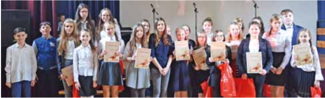
Uczestnicy IV Festiwalu Piosenki Patriotycznej i Żołnierskiej z nagrodami.

Tradycyjnie występy konkursowe poprzedził pokaz musztry w wykonaniu grupy mundurowej z ZS nr 1. Jury oceniało występy w dwóch kategoriach: szkoły podstawowe i gimnazja.