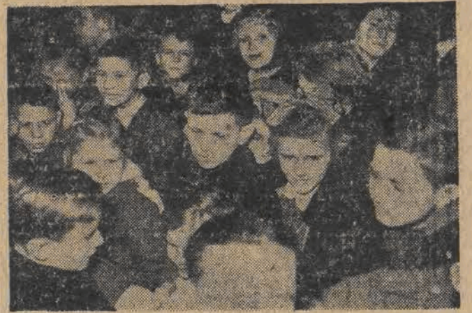
W ubiegłą niedzielę Związek Inwalidów W. P. przygotował miłą niespodziankę dla 750 dzieci — sierot po ofiarach barbarzyństwa hitlerowskiego oraz dzieci przodowników pracy.