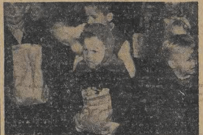
a potem otrzymały noworoczne upominki — paczki z niespodziankami, które wywołały prawdziwy zachwyt dzieci.