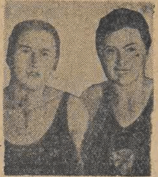
Kalotowa i Niedziółna wraz z Bemówną ustanowiły w r. ub. nowy rekord Polski w sztafecie 3x100 st. zmiennym.

W związku z mającym się odbyć w dniach 15 i 16 bm. dorocznym walnym zebraniem Polskiego Związku Pływackiego, zarząd PZP ustalił klasyfikację klubów i ilość głosów.