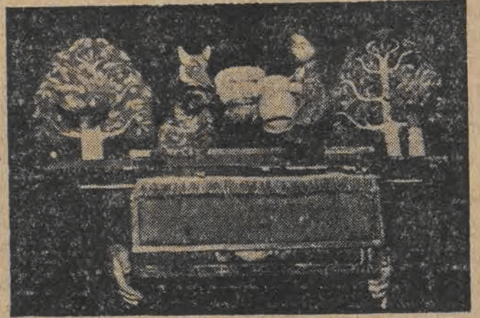
Dzieci były obecne na przedstawieniu teatru kukielkowego „Paramuszka” — bawiły się świetnie...