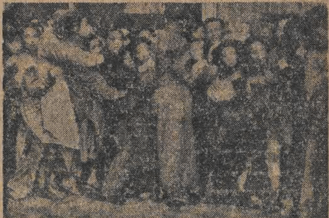
Wojska chińskiej armii ludowej zbliżają się do Nankinu. Tymczasem siepacze kuomintangowscy, czując nadchodzącą klęskę, masakrują ludność robotniczą miasta, protestującą przeciwko wywożeniu zapasów żywności przez zbankrutowanych spadkobierców Czang-Kai-Szeka.