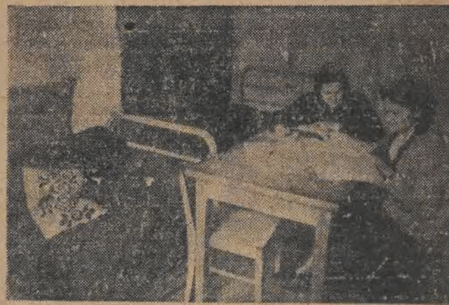
Pe 6 osób w jednym pokoju — to trochę za ciasno, ale studenci nie przejmują się — i