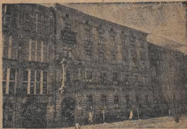
Przy Alejach Kościuszkich — szkoła tu w 51 pokojach 200 stu w Łodzi wznosi się okazały Łódzki Dom Akademicki. Mię-