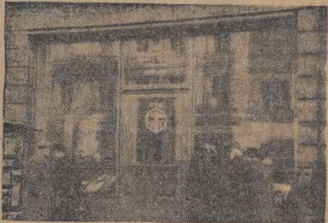
W Łodzi otwarty został Klub Międzynarodowej Prasy i Książki. W Klubie można czytać i pręnumerować pisma i książki z całego świata.