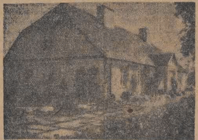
W tym domu, położonym w Żelazowej Woli koło Warszawy, 22 lutego 1810 roku urodził się Fryderyk Chopin.