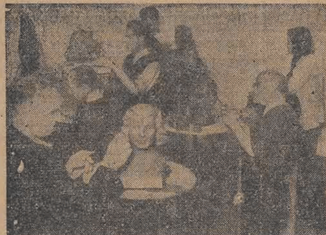
W największym ośrodku przemysłowym Węgier w Csepel odwołuje robotnicy i urzędnicy uczęszczają do specjalnie zorganizowanej Wzrost Szkoły Sztuk Pięknych.