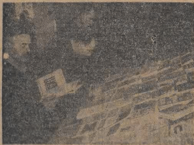
Zarząd Główny Pracowników Drogowych przekazał swoim oddziałom województwem 101 bibliotek — 200 tomowych.