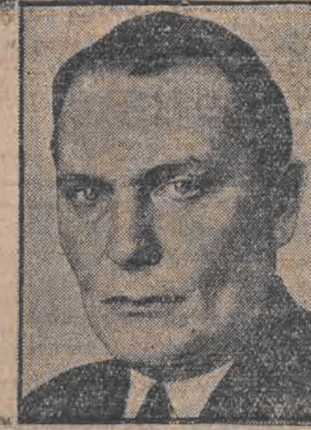
Göring przewodniczący Reichstagu minister bez teki, komisarz do spraw lotnictwa