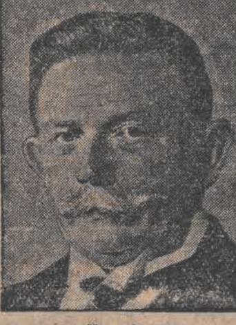
Hugenberg minister gospodarki