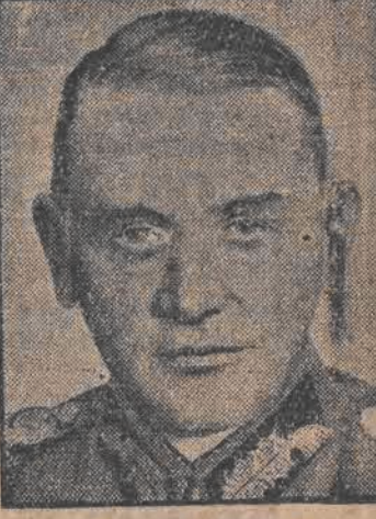
Gen von Blomberg min Reichswehry