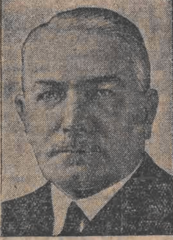
Von Neurath ponownie sprawy zagran.