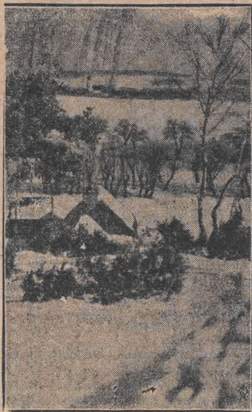
Podczas gdy w całej Polsce śniegi prawie wszędzie już stały na kresach wschodnich zima panuje jeszcze w całej pełni. — Na zdjęciu naszym widzimy uroczy obrazek zimowy z widokiem na miasto Stonim.