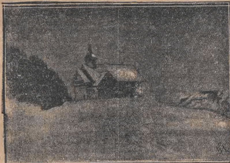
Na zdjęciu naszym widzimy typowy kościółek szwajcarski na szczycie zasypanej śniegiem góry koło Brunnen.