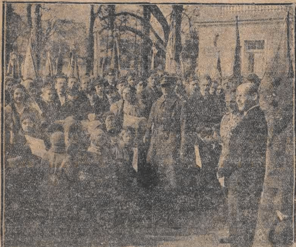
Onegdaj delegacje młodzieży męskiej i żeńskiej wszystkich szkół warszawskich wraz ze sztan darami szkolnymi udaly się do Belwederu, celem złożenia holdu Panu Marszałkowi Józefowi Piłsudskiemu z okazji jego imienin. Do zebranych młodzieży przemówił przed Belwederem minister oświaty Jędrzejewicz, wskazując na zasługi Marszałka Józefa Piłsudskiego i podkreślając, że dzięki niemu w szkołach polskich mówimy po polsku. — Na zdjęciu naszym widzimy ministra Jędrzejewicza, przemawiającego do młodzieży.