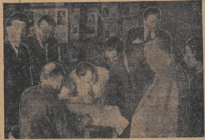
Delegaci na Kongres — załatwiają ostatnie formalności.