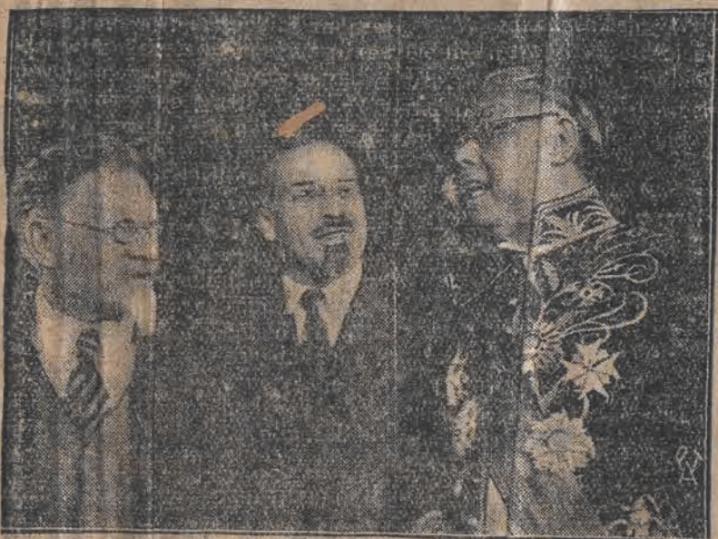
Przed kilku dniami nowy poseł chiński przy rządzie sowieckim wręczył swoje listy uwierzytelniające na Kremlu. — Na zdjęciu naszym widzimy podobnego członka kongresu Stanów Zjednoczonych, Mr. Cullena, najpopularniejszego dziś obywatela Stanów Zjednoczonych. Cullen jest autorem uchwalonego niedawno przez kongresu bilu o przywróceniu produkcji piwa w Stanach Zjednoczonych.

NAJPOPULARNIEJSZY CZŁOWIEK W STANACH ZJEDNOCZONYCH