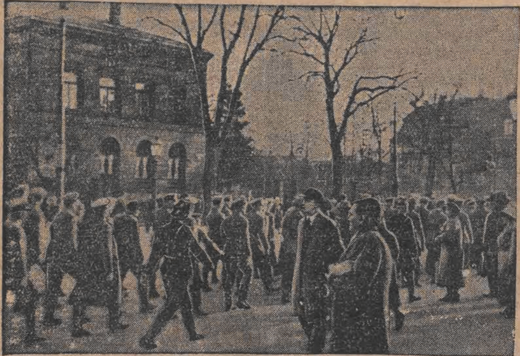
Aresztowani z rozkazu władz hitlerowskich czworokwie brunświckiego Stahlhelmu, konwojowani przez policję, w drodze do więzienia w Essen.