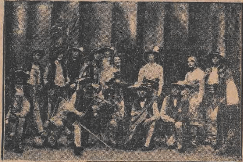
W związku z obchodami się w Warszawie uroczystościami 10-lecia Warszawskiego Ogniska Związku Pocharań, przybyła do Warszawy liczna grupa górali z Zakopanego i innych okolic Podkarpacia z własną orkiestrą. Wczoraj orkiestra ta koncertowała w jednym z kinoteatrów warszawskich. W czasie koncertu zapośnikowo też tańce góralskie oraz odśpiewano szereg pieśni góralskich.