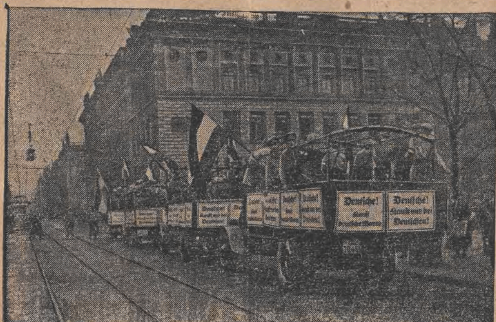
Propagandowe auta na ulicach Berlina z napisami: „Niemcy, kupujcie tylko u Niemców!”