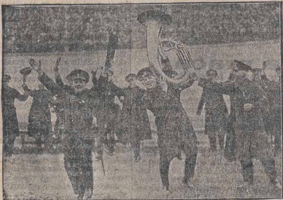
Holenderska kapela wojskowa daje niósie swej radości z powodu zwycięstwa drużyny holenderskiej w zawodach piłki nożnej z drużyną belgijską w Amsterdamie.