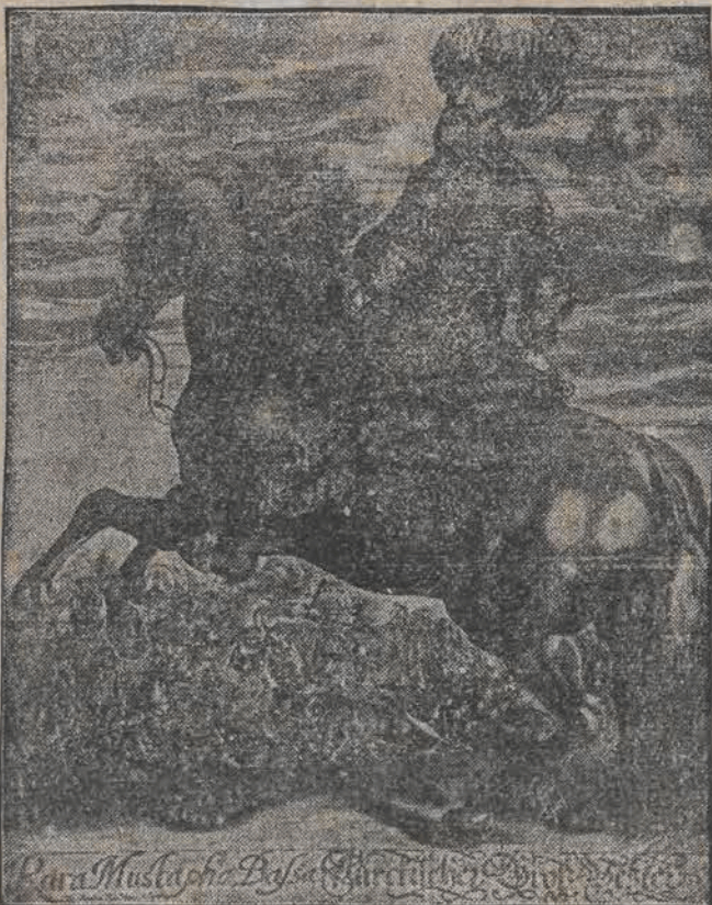
Na zdjęciu naszym podajemy podobiznę wodza pobitej pod Wiedniem przez króla Jana Sobieskiego armji tureckiej — wielkiego wezyra Kara Mustafę.