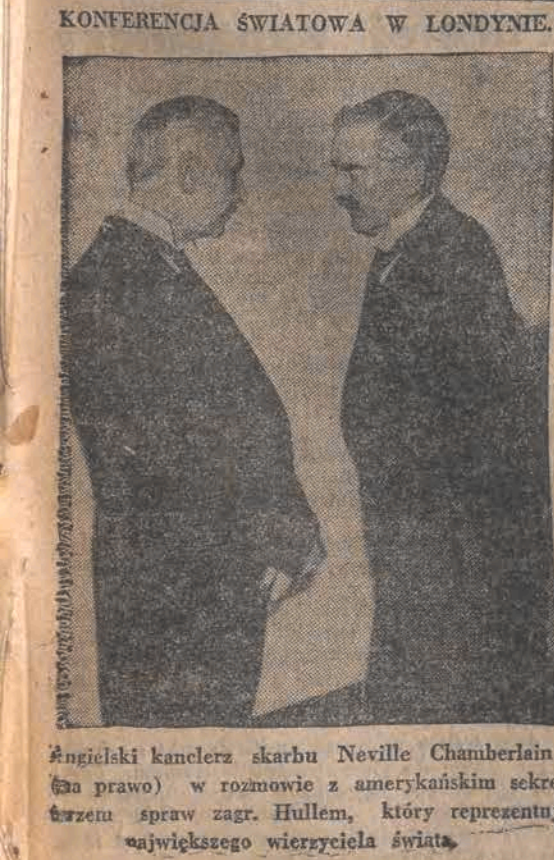
Angielski kanclerz skarbu Neville Chamberlain (na prawo) w rozmowie z amerykańskim sekretarzem spraw zagr. Hullem, który reprezentuje największego wierzyciela świata.