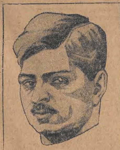
Książę Karol rumuński, który swymi wystąpieniami wywołuje niepokój w Bukareszcie. (w)

Cyfrы wymownie wskazują na to, że kasy chorych stanowią dość znaczną pozycję w naszych ogólnych stosunkach budżetowych i w naszym ogólnym majątku. Czy również w tym samym stosunku spełniają te zadania, dla których do życia powołane zostały i czy w tej samej mierze cieszą się zaufaniem i uznaniem szerokich mas pracowniczych...! Pod temi względami istnieje dużo do strzeżenia”.