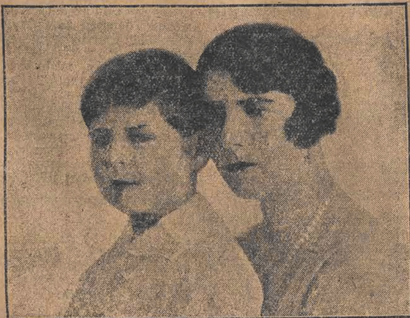
Sześciolatek król rumuński, Michał z matką swoją, królową Heleną.