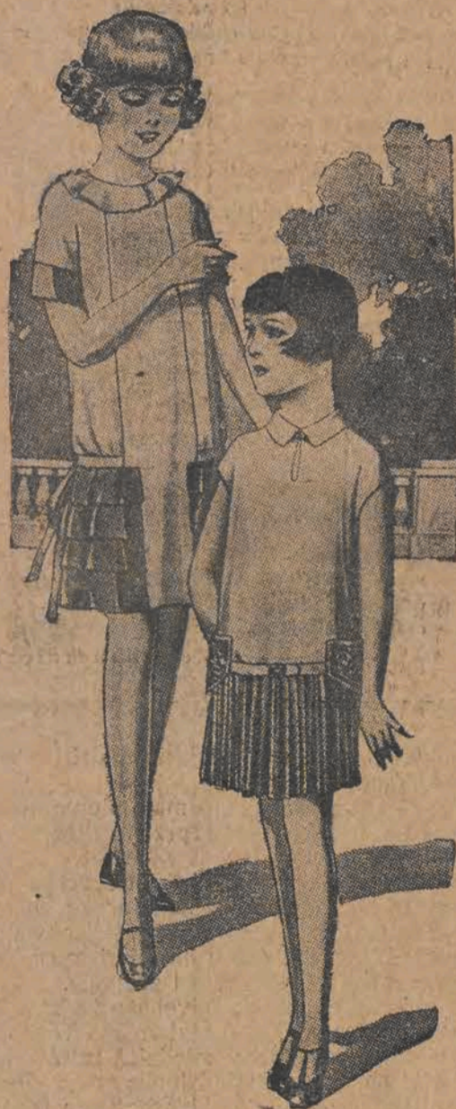
Sukienka z piaskowego voile ozdobiona falbaneczkami z frez jedwabiu. Kitelek niebieski z toile-de-soie — plisowana spódniczka w kratkę. (Modele Fairyland).

Zaroily się parki, ogrody, skwery i aleje różnobarwnym, roześmianym tłumem dziatwy. Całe dni spędzają na powietrzu, bawiąc się lub spacerując, w ogrodach odbywają się komplety freblowskie, a podczas przechadzki konwersacje. I oto okazały się nagle poważne braki w garderobie małej pani i młodego gentlemana, a wystrójone mamusi, dbając o harmonję, stroją szybko swą dziatwę, aby nie przyniosła im wstydu na spacerze. Piękna pani rzadko korzysta na wiosnę ze strojów z przed roku, gdyż broni jej