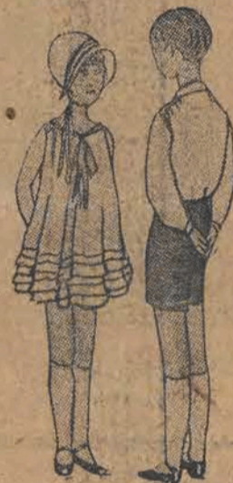
Sukieneczka krepdeszynowa różowa naszywana falbaneczkami niebieskimi i frez. Beige spodniki i koszulka popelinowa kremowa.

Skarpetki noszą dziewczynki wysokie, aż pod kolanko, jasne, koloru pantofelki, z wyłożonym mankiecikiem o pastelowym szlaku, a do pantofelków kolorowych i czarnych lakierowanych — białe. Pantofelki zapinane na jeden paseczek z jasnych skórek, najczęściej cielistych, o dość szerokim wygodnym nosku,