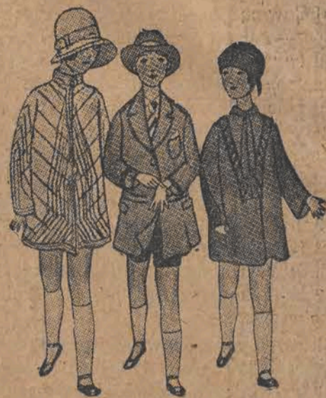
Płaszcz z kashy vert-amande, stebnowany ukośnie i podłużnie. — Budka ze słomki vert-amande, wykończona wypustką i opasana crêpe-georgetta. Paltko-french z beige gabardiny, kapelusik filcowy beige. Palteczko z bleu rypsu, wiązane koło szyi, przybrane haftem. — (Modele Jenny Billique).

Bluza albo jest tego samego koloru, co spodeńki, albo jaśniejsza. Zwłaszcza ładnie wyglądają spodnie z czarnego aksamitu lub brązowej zamszy do bluz z