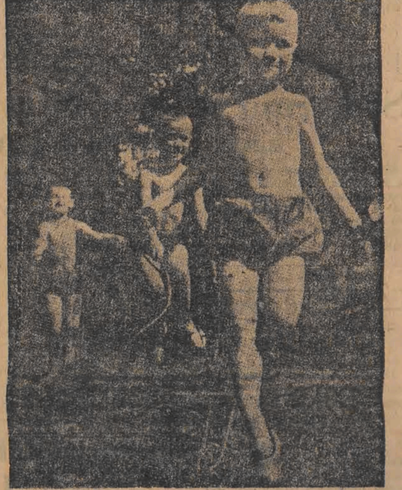
Cwiczenia ze skakanką są jednym z podstawowych ćwiczeń pięcioklaszki i pikarzy, nic też dziwnego, że młodzież radziecka zaprawia się w nich już w szkole.

Oprócz szkoły i organizacji „Pionier” dzieci radzieckie mają możliwość zapoznania się ze sportem jeszcze w specjalnych szkołach sportowych.