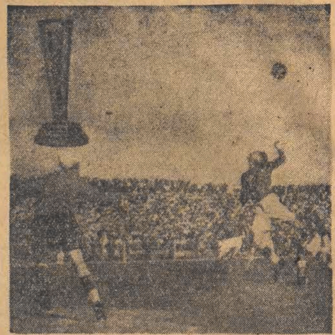
W tym tygodniu, w całym kraju odbyły się rozgrywki o puchar Kaluży. Na zdjęciu fragment z meczu Kraków — Opoła.