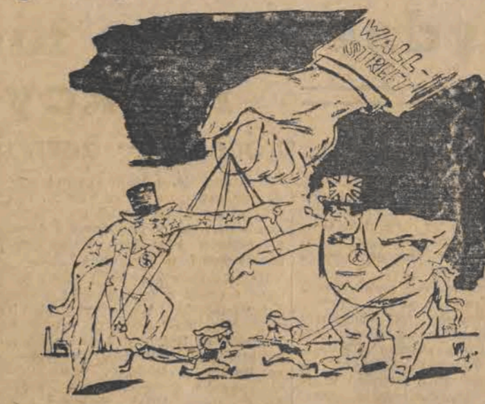
Między Syrią i Irakiem znów wybuchły nieporozumienia — podsycane przez agentów Wall-Street, marzących o nieograniczonej eksploatacji źródeł ropy naftowej na Bliskim Wschodzie

Warszawa (PAP). 9 bm. w Warszawie odbyła się ogólnokrajowa narada pocztowców, na której omówiono wytyczne planu 6-letniego dla państwowego przedsiębiorstwa „Poczta Polska, Telegraf i Telefon”. Udział w naradzie wzięło ponad 300 osób.