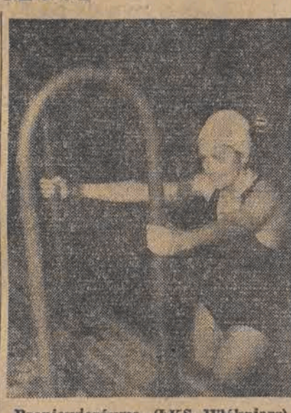
Proniewiczówna (ŁKS Włóknarz)

100 mtr. stylem na wznak pań — 1. Ciemińska T. ŁKS Wł. 1.35.8; 2. Kurkówna Warta.