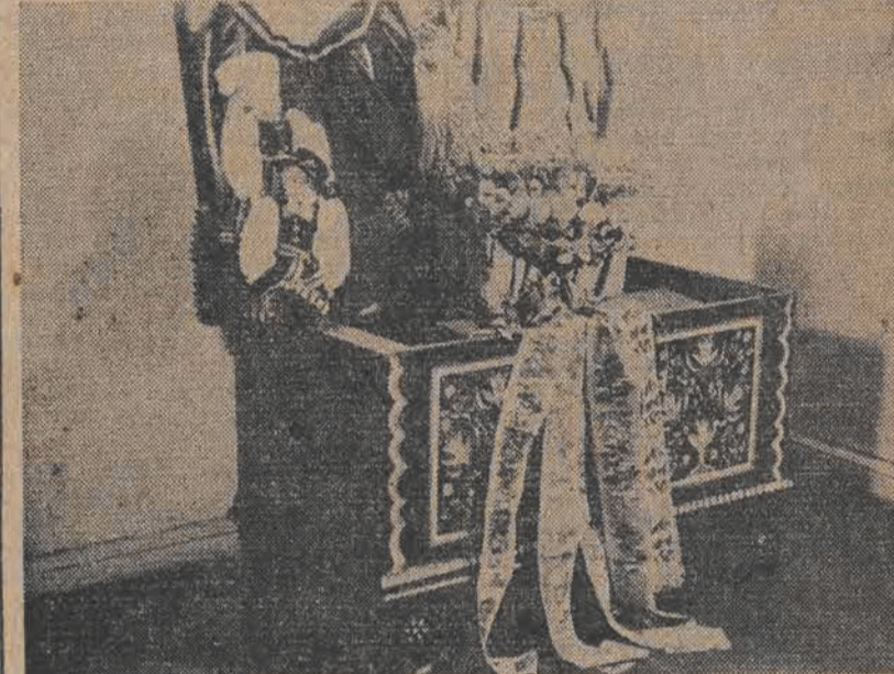
Dar robotników i pracowników gminy Bielawa pow. łowicki — malowana skrzynia pełna regionalnych strojów łowickich.