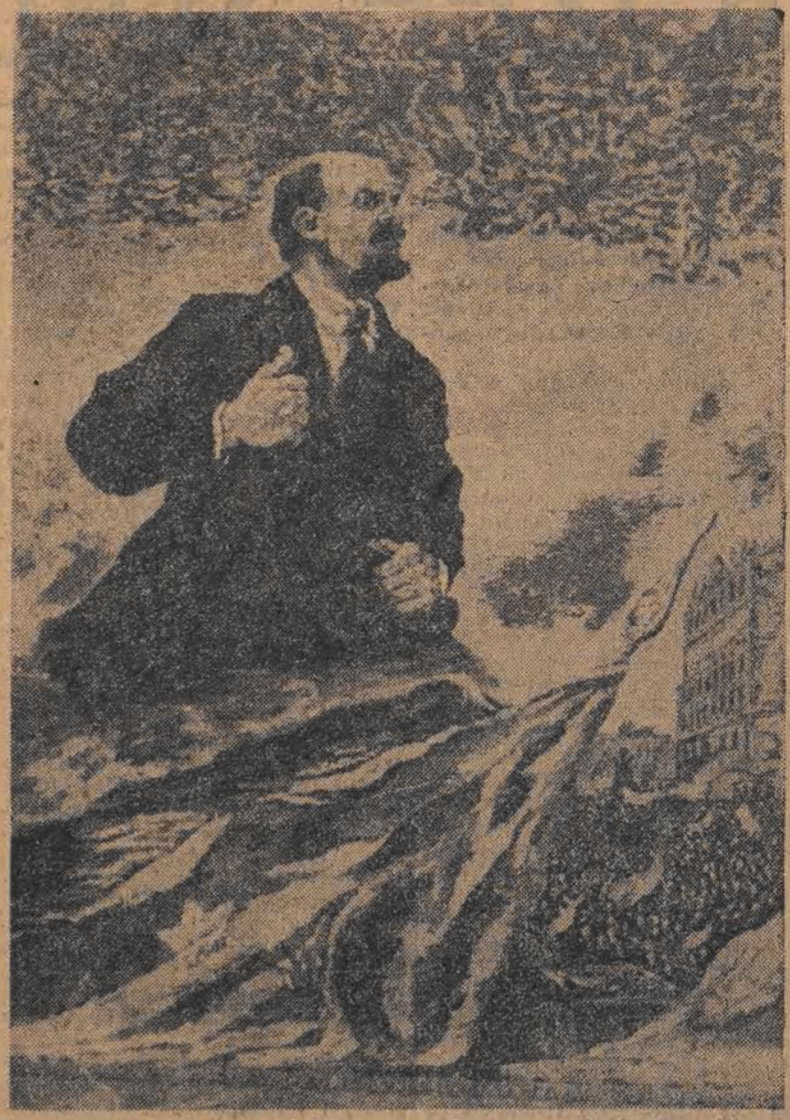
Wspaniały dywan, wyprodukowany w Tomaszowskiej Fabryce Dywanów — dar urodzinowy włókniarzy łódzkich dla Towarzysza Stalina.