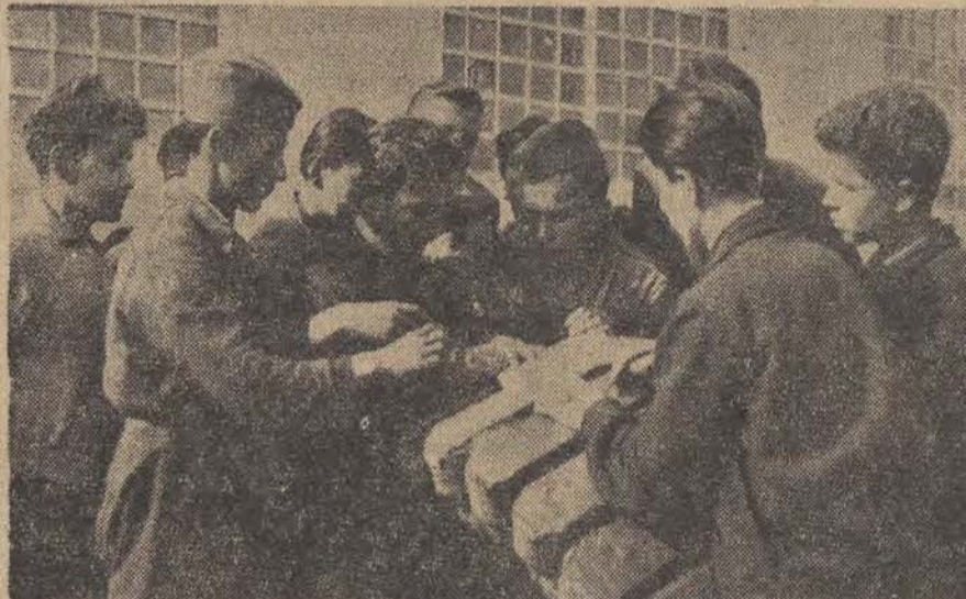
Na całym świecie ludzie pracy manifestują wolę walki o pokój, podpisując Apel Sztokholmski. Na zdjęciu: — Robotnicy fabryki „Enver” w Albanii podpisują Apel.

Na zakończenie Trygve Lie na prośbę korespondentów podzielił się z nimi swymi wrażeniami z Moskwy. Podkreślił on, że jest w Związku Radzieckim po raz piąty i że widział Moskwę zarówno w czasie wojny jak i pokoju. Osiągnięte sukcesy — powiedział Trygve Lie — są oczywiste.