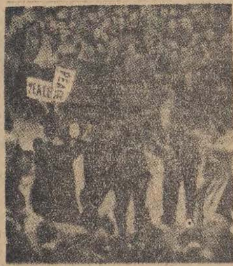
Obrazki z Anglii, rządzonej przez lokajów im perializmu amerykańskiego: Brutalna akcja poli cji nie jest w stanie złamać zdecydowanej woli pokoju wśród mas pracujących W. Brytanii.