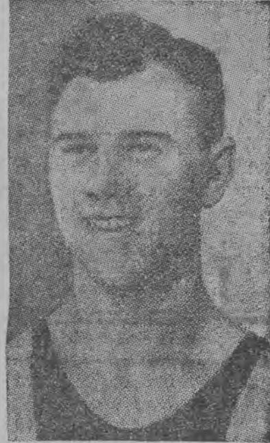
Wicemistrz ZSRR Szocikas

W Związku Radzieckim nie dawno zakończone zostały mistrzostwa bokserskie w wadze ciężkiej.