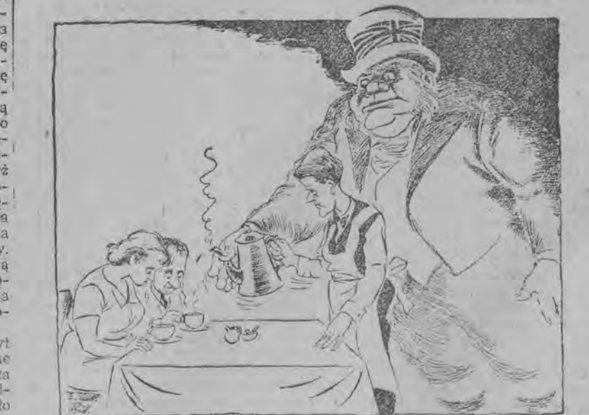
John Bull: Obywatelu, kawa to wróg Anglii! (Land og Folk)