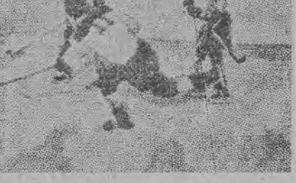
Fragm. z meczu hokejowego o mistrzostwo ZSRR Dynamo (Moskwa) — Bolszewik