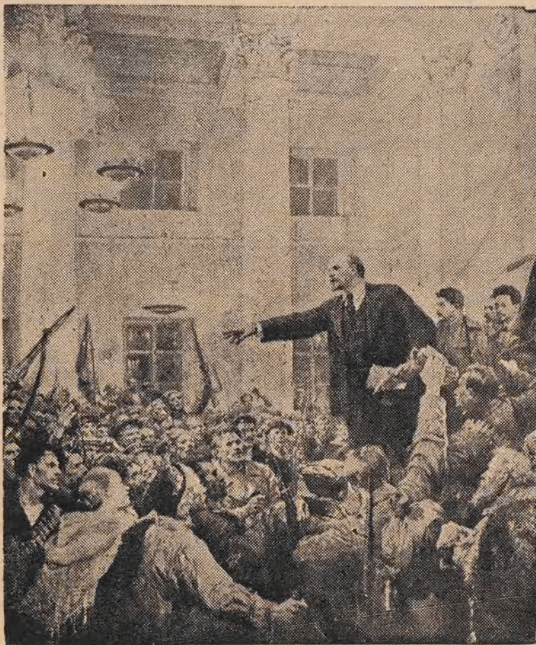
Lenin przemawia do czerwonogwardzistów