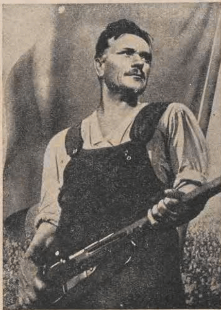
„Jeśli jutro wojna...“

fortyfikacje niemieckie, miasto za miastem przechodziło, po złamaniu zaciekłego oporu okupanta, w ręce Armii Wyzwolicielki. Z radosnym biciem serca słuchaliśmy, że Warszawa, że Kraków, że Wał pomorski, Kołobrzeg, Szczecin, Gdynia i Gdańsk. Wraz z Armią Radziecką przyszły do Polski oddziały I Armii Polskiej, które były załóżnikiem naszego ludowego Wojska Polskiego.