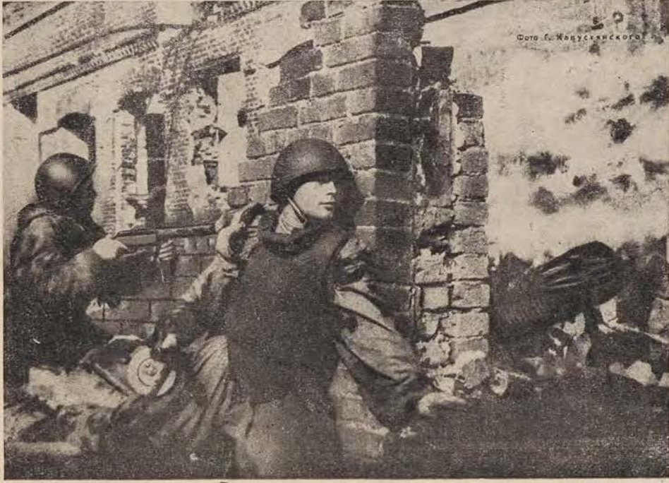
די האָבן באַפרייט סטאַלינגראַד

"איך יאָג און זיך אלעמען, וועמען מען דארף, איך האָב, אינגיבן וועלן מיר אויפשטעלן. איר קאָנט זיין זיכער, אז מיר וועלן נישט שא-געווען קיינעם - נישט זיך, נישט קיין אנדערע, אָבער ברויט וועלן מיר פונדעסטוועגן געבן. ווען אונזערע מיליטערישע, "ספעציאליסטן" (פאַרטאַטשעס!) וואָלטן נישט געשלאָפן און נישט פוסטעפאסטעוועט, וואָלט די ליניע נישט דורכ-געריסן געוואָרן, און אויב די ליניע וועט אויפ-