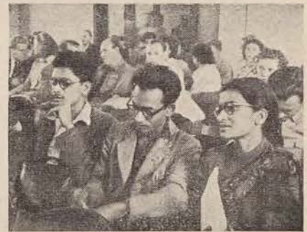
א גרופע דעלעגאטן פון ווייטן אינדיע הערן זיך צו די דעבאטן אויפן קאנגרעס.

אנטי - פאשיסטישער קאמיטעט פון דער סאוויעטישער יוגנט