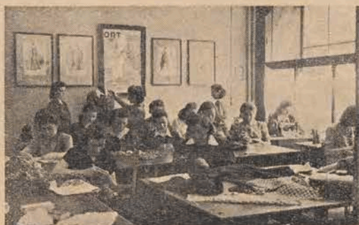
W szkole ORT-u

Jestem głęboko przekonany, że nic nie zdola jej powstrzymać w marszu do wielkiego celu.