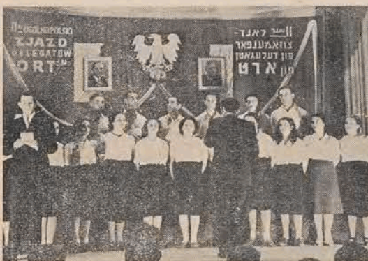
Chór krakowskiej bursy