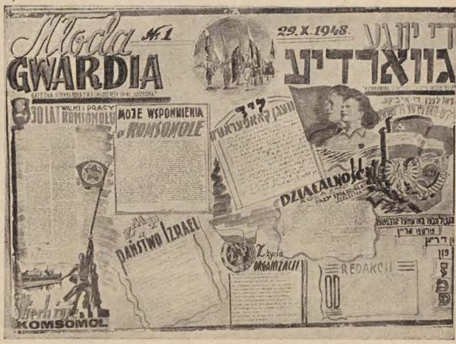
וואַנט־צײטונג אין דער דזשערזשאַניווער יוגנט־היים

סוף יאָנואַר ת. י. איז אין אַקאַז פון אונז זער יוגנט־היים פּאַרגעקומען אַ דיסקוסיע־אַװנט, געװידמעט דעם אַרטיקל פון ח' ש. זאַכאַרױיש, וואָס איז פּאַרעפּנטלעכט געוואָרן אין יוגנט־ זשורנאַל „אױפּגאַנג“ א. נ. „שײַנע מאַרק־ סיסטן... שײַנע סאַציאַליסטישן... דעם אַר־ טיקל האָט פּאַרגעלייענט פּאַר די נאָר זאַמלעט ח' העלדמאַן. מיט גרויס אױפּמערק־ זאַמקייט און געשפּאַנטקייט האָבן זיך די יוגנט־ לעכע צוגעהערט צו דער אױסערעסאַנטער טעג מע. דאָן האָבן די צוהערער געשטעלט פּיל פּראָבן. די דיסקוסיע איז געװען זייער אַ לעב־