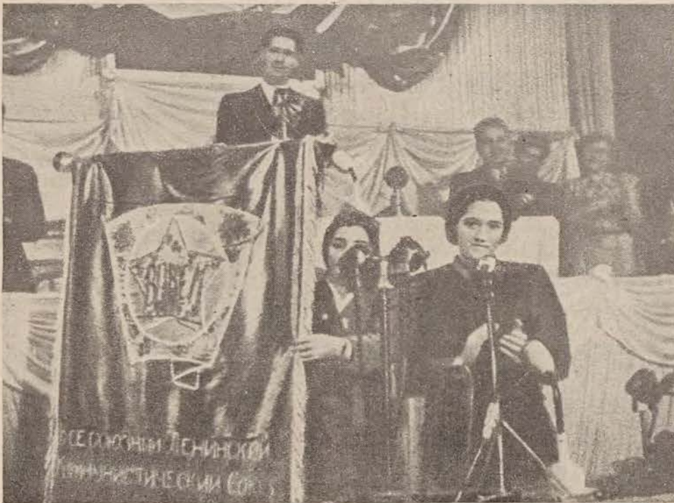
די קאמסאמאלי-דעלעגאציע גיט איבער איר פאן — א מתנה דעם פרעזידיום פונם אינטערנאציאנאלן יוגנט-קאנגרעס אין בודאפעשט.

אין איראן זיינען די גרעסטע טייל ארבעטער-קינדער קראנק אויף שווינדזוכט, מאגן און טראכאמע. די שמערב-לעכקייט פון קינדער ווערט געשאצט אויף 80-90 פראצענט.