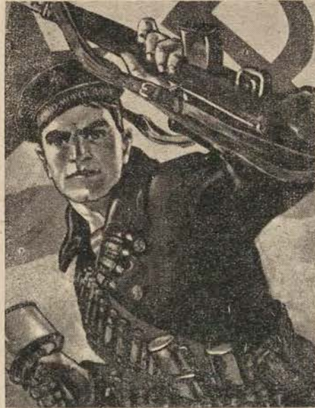
פאַרויס, צום זיג

הונדערטער און טויזנטער האָבן פאַרזיט מיט זייערע קערפערס אַט דעם טרויעריקן מאַרש־וועג. אָבער די לעצטע מינוטן, די לעצט טע קרעכץ, די פאַרגלייטע אויגן — זיינען גע־ ווענדט געווען צו דער העלדישער סאָוועטישער־