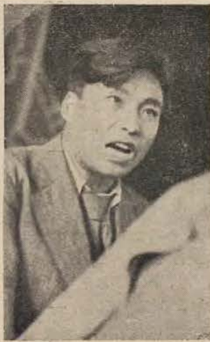
אריסטריט פון כינעזישן דעלעגאַט אריין יוגנט-פעסטיוואַל אין בודאַפעשט

צום סוף איז די סיטואציע געוואָרן זייער געפערלעך — אָדער דאָס איז וועט זיך איינ-ברעכן, און עס וועט, אָפּרײסנדיק זיך, זיי אוועקשלעפן מיט זיך און זיי צעשמעטערן