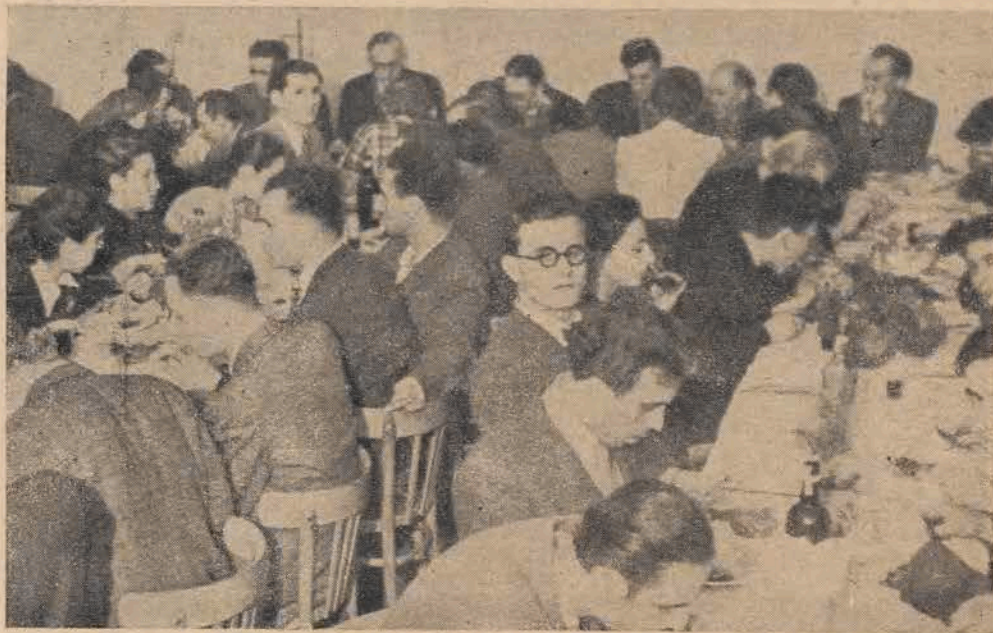
Uroczysty wieczór poświęcony Armii Radzieckiej w bursie w Bielsku.

Poczekalem, aż się całkowicie ściemniło. Obydwa brzegi rzeki były oświetlone jak w dzień. To Niemcy kierowali na nie świetlne