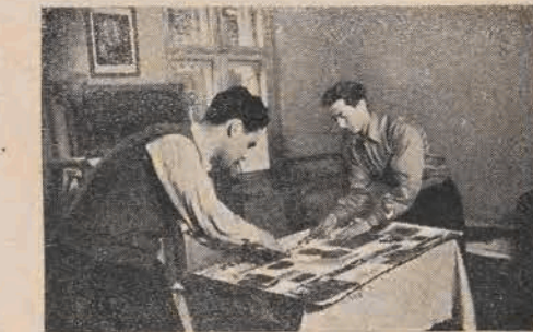
יוגנטלעכע גרייטן צו זייער וואַנט-צייטונג

אומעטום, ווו זיך זיך נישט געפינען. אין דער פריער צייט דאָרף זיך די יוגנט צווי פויקומען אינם יוגנט-קלוב, פאַרברענגען מיט חברים, ליינענען צייטונגען, זשורנאַלן, געניסן פון שאַר-שפּיל, אין פינג-פאַנג. דער דערפאַלג פון דעם יוגנט-קלוב איז פיל אָפּהענגיק ווי אַזוי ער וועט זיין איינגעאָרדנט. וועט דער קלוב עסטעטיש און קולטורעל אַנטשפּרעכען די באַ- דערפענישן פון דער יוגנט, וועט ער מאַסגווייז