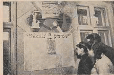
דערשינען א פרישער נומער וואַנט-צייטונג אין דער וואַלביזשער יוגנט-הויס

אין וואַרשע און אין וואַלביזש זיינען פאַרגעקומען ספּעציעלע דיסקוסיע-אָונטן, וועלן כע האבן אַלויטיק באַהאַנדלט די טעאָרעטישע ארבעט פון ח' זאכאריאש. די יוגנטלעכע האבן פיל געלערנט און זיך דערוואסט וועגן דעם אמתן פרצוף פון דער מ"מ, וועלכע שפילט אָפּ אַזאַ שענדלעכע דאָל אין ישראל אין איר קאמף קעגן קאמניזם. ווי מיר זען, זיינען די