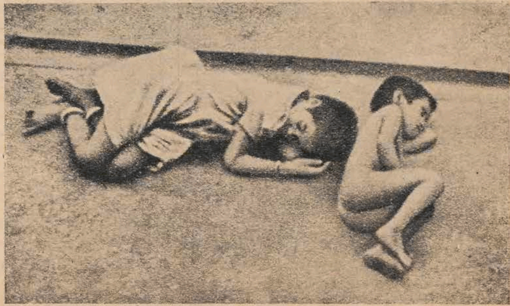
אט, זיי אזוי עס לעבן די קינדער אין די קאלאניאלע לענדער

עס איז ווערט אונטערזשעטרייבן די איבער-געבענע ארבעט פון יוגנט אבער זייער טאג-לאנטורטן אינסטרומאנט קרעסעל הערש, וועלכער האט זיי געהערדיקט פארשטאנען דעם באד-שלוס פון צ. ק. פון דער פוילישער פארייניקטער ארבעטער-פארטיי וועגן פיזישער דערצייגונג