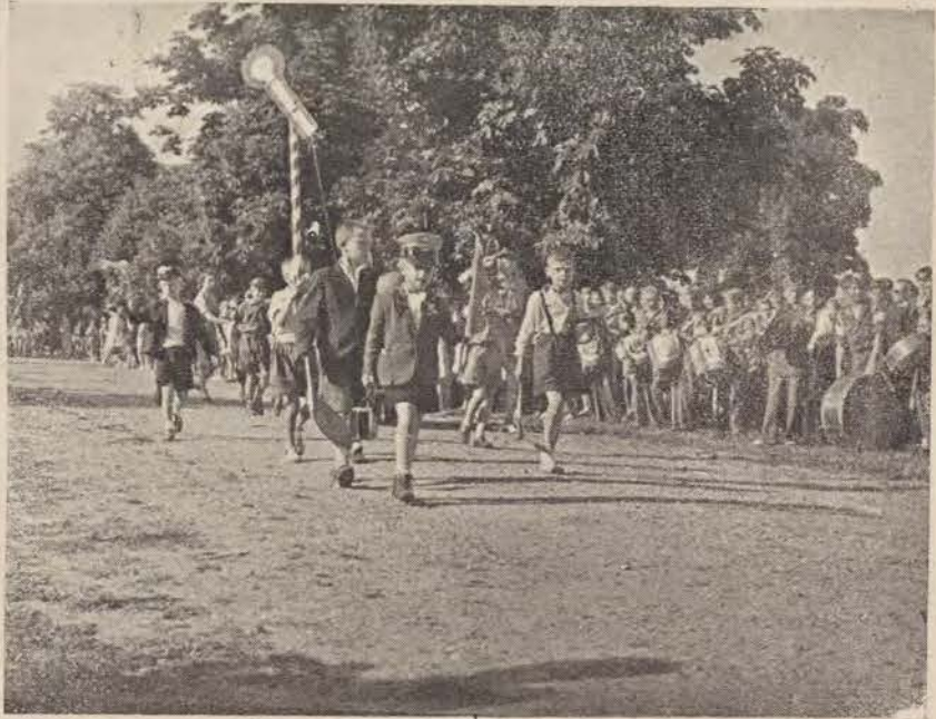
יידישע סקויטן אויף אן אויספלוג

מיטן מאַמענט פון אָרנאָמירן איבערן גאַנצן לאַנד די יוגנט-סעקציעס וועט די קולטור-אַרבעט צווישן דער יוגנט אוועק אויף נייע העכסן. זי ווערט אן אָרגאַנישער באַשטאַנד-טייל פון דער אַלגעמינער קולטור-טעטיקייט אין דער געגענטער שטאַט אָדער שטעטל. זי ווערט קאַָרדינאָר און פּלאַגירט דורך דער פּאַרוואָל-טונג פון דער אָרטיקער קולטור-געזעלשאַפט. ביז לעצטנס האָט זיך געפילט אַ דובלירונג אין דער אַרבעט, ביי דעם גרויסן מאַנגל פון קאַרען אין די קולטור-טעטיקייט געווען אַ צעברעקלעכע יעדע אינסטיטוציע אין דער יודישער סביבה האָט זיך געפירט איר באַשיידענע אַרבעט, אָפּ-געזונדערט איינע פון דער אַדערער. די יוגנט אָפּטיילונגען און יוגנט-היימען האָבן זיך איינ-געאַרדנט אירע אימפרעזן, האָבן אָרגאַניזירט באַזונדערע אַקאָדעמיעס, פּרומאָרגנס, רעפּע-ראַטן, האָבן געפירט ספּעראַטע ביבליאָטעקן, געהאַט אייגענע דראַמקרייזן, באַרן, אָרקעס-טערס. פּאַראַלעל מיט דער יוגנט האָבן געפירט