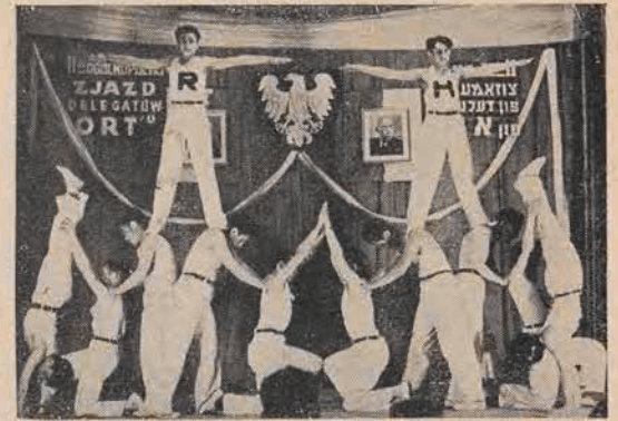
Ćwiczenia gimnastyczne bursantów Wałbrzycha