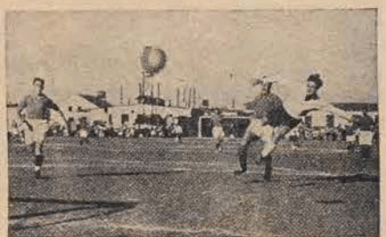
ווען ספּאָרט דינט דעם פּאַלק יידישע יוגנטלעכע אויף א פאַרמעסט

אמעריקע האָט „באַשאַנקען“ די וועלט מיט אזא אַרט פון ספּאָרט, ווי דער קאַמף „קילטש“ אין וועלכן ס'איז אַלץ דערלויבט: מ'קאָן זיך כּייסן, ברעכן אברום, רייסן דעם קעגנער פאַר די אויערן און האַר, קריכן מיט די פינגער אין מויל און אויגן, כדי צווצויען וואָס מער צו-שויער — אַמאַטאָרן פון שטאַרקע עמאַציעס, קלערט מען אויס אַלץ נייע און מער גע-זעלשאַפּט פון דער קרויסלעכער יוגנט און אַנ-דערע דעאַקאַציערע יוגנט-אָרגאַניזאַציעס.