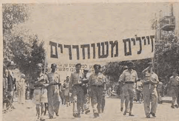
Młodzież Izraela w walce o swe słuszne prawa

Dwudziesta druga para była śnieżno bia-lymi pantofelkami zamszowymi. Przepiękne były te pantofle. Szewc który je uszył był chyba mistrzem i artystą w swym zawodzie.