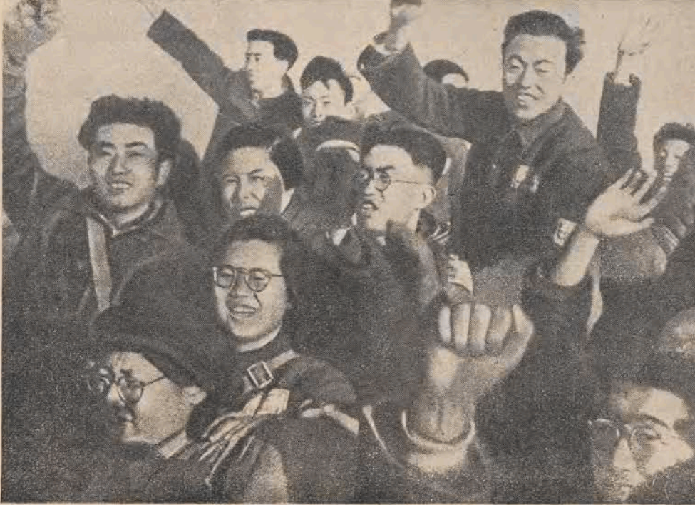
כינעזישע סטודענטן באַגריסן די פאָלקס־ארמיי אין באפרייטן נאַנקין

אין 1944 האָט די פאָזיציע פון די יאפּאנער זיך געווען פארעגערן. זייער מאַראַל איז גע־ווען זייער נידעריק, און די איינוווינער פון דאָרף זיינען געווען אזוי פאָרייניקט, אז זייער אומלעגאלע מאַכט האָט איצט געקאָנט ארויס קומען אויף דער אויבערפלאַך און אָפּן פאר־וואַלטן מיטן דאָרף. די אַרטיקע „אדמיניסטראַט־ציע“ פון די פארעטערישע באַאמטע האָט נאָך עקזיסטירט. קיינער האָט זיך שוין אָבער מיט איר נישט גערעכנט. עס איז געמירנדעט געוואָרן א פאָרין פון פרויען, וועמענס פרעזידענט עס איז געוואָרן די אמאָליקע בעטלערין האַן־היסוסונג. זי איז אויך אויפגעוויילט געוואָרן אלס די בעס־טע ארבעטהעלדין אויף א מאַס־מיטינג פון דער גאַנצער געגנט, וואָס איז דורכגעפירט גע־