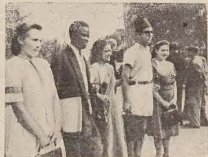
פויילישע מיידלעך נעמען אויף די יוגנט-פארשטייער פון זרום - אפריקע און מאראקא