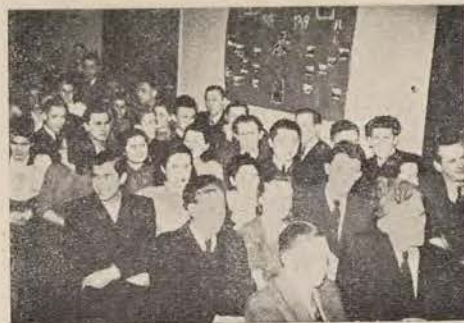
אן אַלגעמיינע פּרודאַמלונג

דער-גרעסטער זאַל אין הויז איז מיט גע-שמאַק איינגעאַרדנט געוואָרן אַלס אַן אַלגע-מיינער קלוב. אין די אָונטן טרעפט איר דאָ