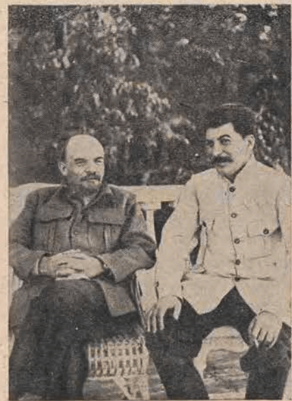
Twórcy Armii Radzieckiej

W dniu święta bohaterskiej Armii Radzieckiej przyrzekam jeszcze pilniej i lepiej uczyć się i pracować, by w ten sposób spłacić Jej mój dług wdzięczności za ocalone życie i przywróconą wolność.