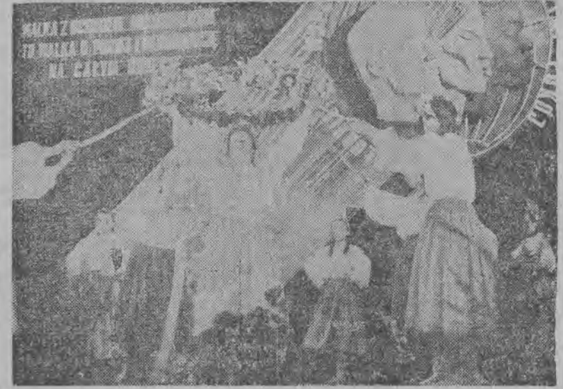
Piękne występy baletu dziewczęcego z PZPB Nr 2 zachwycają młodzież i starszych