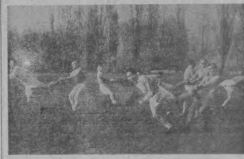
Trening piłkarski jest dość skomplikowany. Piłkarze ŁKS Włókniarza w czasie codziennych zajęć

Rewanżowy mecz o mistrzostwo ligi koszykowej pomiędzy lokalnymi rywalami Spójnią i ŁKS Włókniarzem odbędzie się w sobotę, o godz. 19 w sali „Ogniska”. Na przedmeczku spotkają się zespoły o mistrzostwo klasy B Okręgu Łódzkiego.