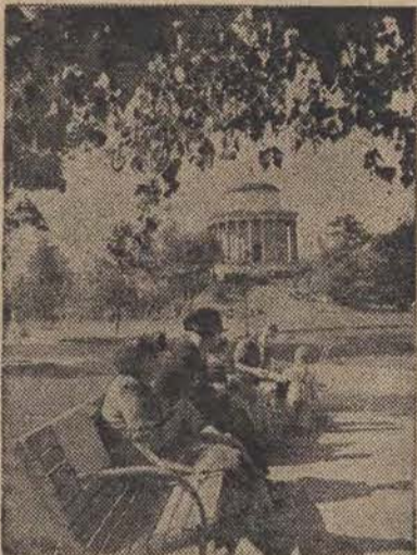
Slicznie wygląda Ogród Saski w nowej szacie. Artykuł o odbudowie Warszawy na str. 4-ej.