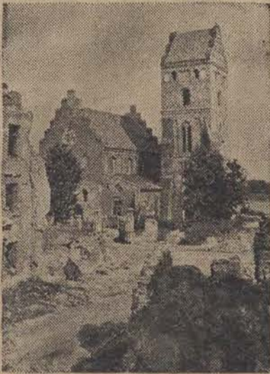
Nowo odbudowany zabytkowy kościół Panny Marii na Nowym Mieście.