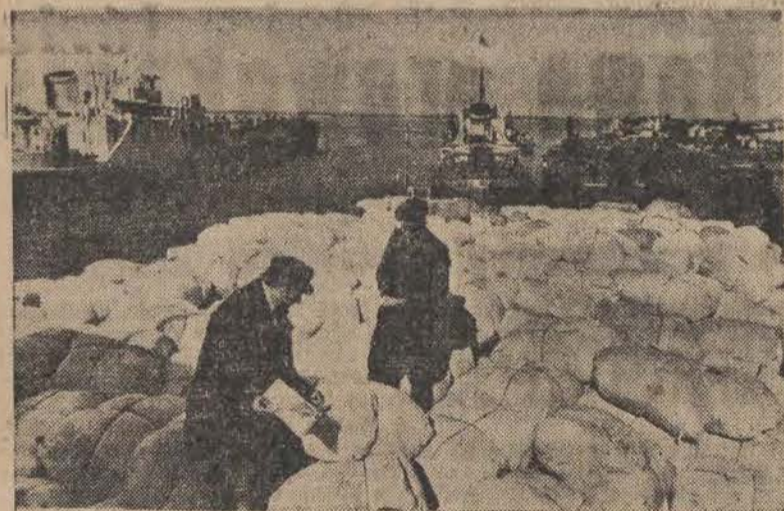
Równocześnie z budową wielkiej Elektrowni Stalingradzkiej przystąpiono do budowy drugiego giganta — wielkiej Elektrowni Kujbyszewskiej. Na zdjęciu — przyczółek „Kujbyszewhydrostroju”. Towary przemysłowe przeznaczone dla budowniczych „Kujbyszewhydrostroju”.

W dalszych planach, jednak również jeszcze w okresie Planu 6-letniego, przewiduje się budowę gazociągu okrężnego naokoło Warszawy, który obsłużyć będzie zakłady przemysłowe, leżące poza miastem.