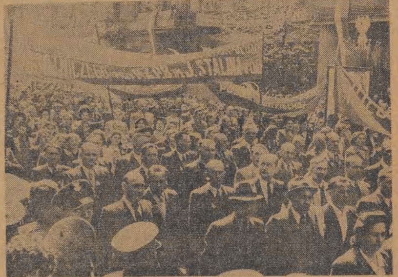
Pochód włókiarzy otwierała załoga Państwowych Zakładów Przemysłu Bawełnianego im. Józefa Stalina.