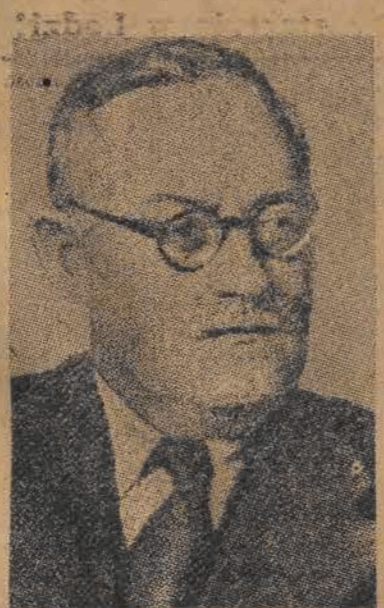
Panie Przewodniczący Centralnego Rządu Ludowego! Panie Premierze Państwowej Rady Administracyjnej Panowie!

W historii stosunków radziecko-chińskich wpisana dziś została nowa, doniosła karta. Podpisane zostały dziś dokumenty o ogromnym historycznym znaczeniu — układ o przyjaźni, sojuszu i pomocy wzajemnej, porozumienie w sprawie chińskiej czangczuńskiej linii kolejowej, portu Arthura i Dajrenu, porozumienie w sprawie długoterminowego kredytu gospodarczego.