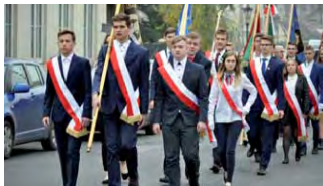
Po uroczystościach w auli ZSP 1 pocztę sztandarową oraz osoby biorące udział w uroczystości przeszli pod pomnik Józefa Piłsudskiego przy ul. Podrzecznej w Łowiczu.

Później uczniowie wystąpili z akademią patriotyczną, piosenki patriotyczne śpiewał chór oraz uczniowie Studia Artystycznego „Star”, które działa w gmachu szkoły. Zwieńczeniem było złożenie kwiatów przed pomnikiem marszałka Józefa Piłsudskiego przy ul. Podrzecznej. mak