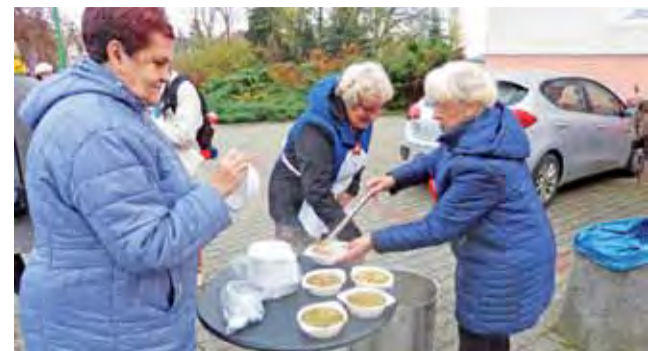
Zupa rozdawana była 12 listopada przed wejściem do Zacisza przy ul. Kaliskiej. Następnego dnia częstowano nią na działkach przy Bolimowskiej.

Po wysłuchaniu akademii gości zostali zaproszeni na poczęstunek ciastami, które z okazji 100. rocznicy odzyskania niepodległości przez Polskę również przybrały barwy biało-czerwone. aa