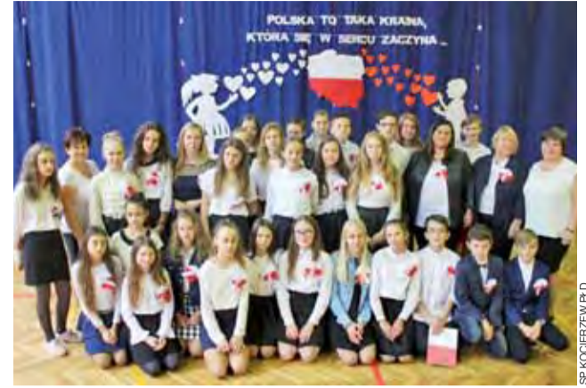
Po wspólnym odśpiewaniu hymnu Polski, przyszedł czas na pamiątkowe zdjęcie uczniów szkoły w Kocierzewie Płd.