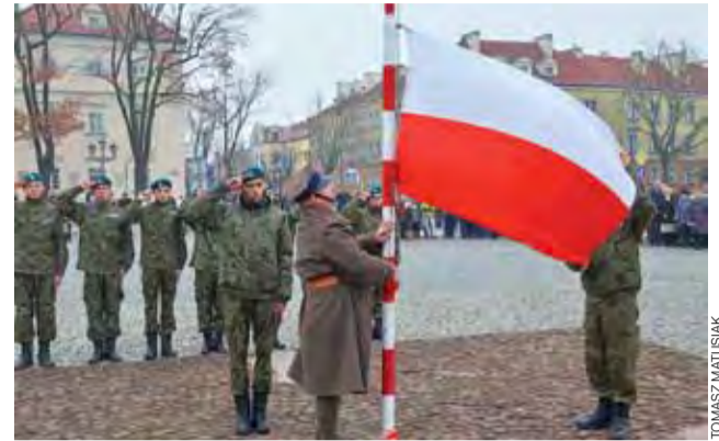
Poczet flagowy na Starym Rynku.

Łowicz | Procesja św. Wiktorii w biało-czerwonej scenarii