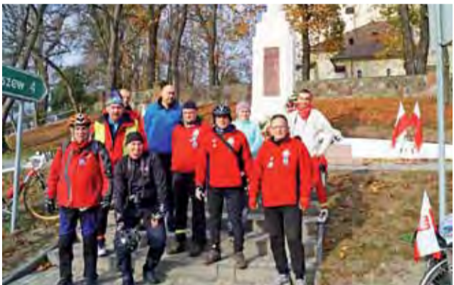
Uczestnicy rajdu przed pomnikiem poległych w walkach o wolność i niepodległość w latach 1918-1920 w Domaniewicach.