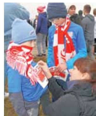
Wśród startujących nie zabrakło dzieci z bolimowskiego klubu sportowego Foot-Bol-Aki.