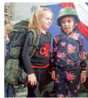
Podczas spotkania z rekonstruktorami uczniowie mieli okazję przymierzyć wojskowy sprzęt.

Brali udział w zajęciach ukazujących historię odzyskania nie-