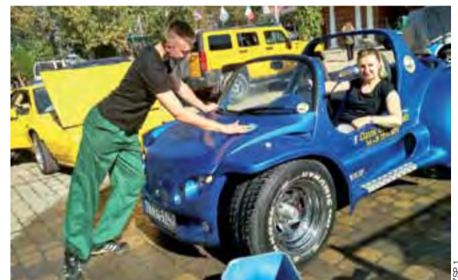
Podczas praktyk był czas zarówno na pracę, jak i zabawę – np. podczas pozowania do zdjęć w samochodach, które naprawiali.