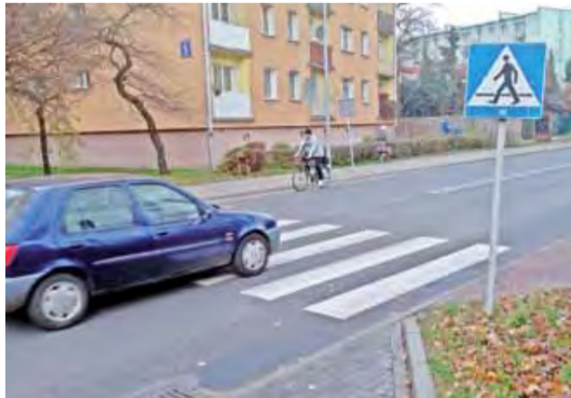
Na tym przejściu dla pieszych została potrącona kobieta.