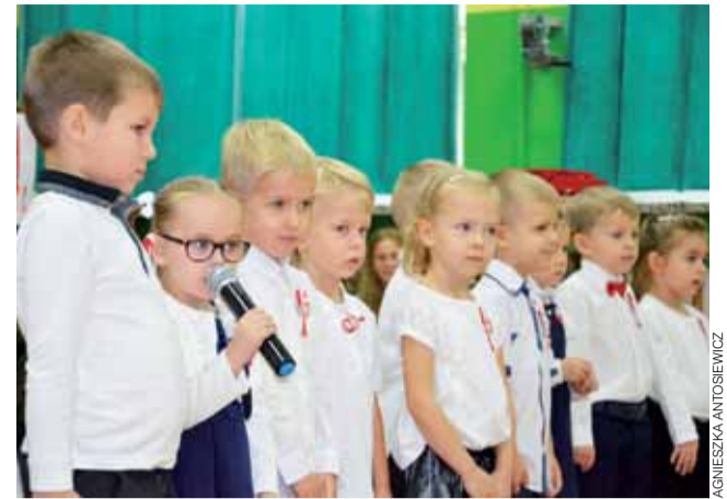
Wiersze i piosenki na 100-lecie odzyskania niepodległości przez Polskę w Szkole Podstawowej w Popowie.

Taka forma świętowania Niepodległości sprawdza się w gminie Zduny. Rok temu po mszy św. mieszkańcy mogli wysłuchać koncertu pieśni patriotycznych, które Zespół Śpiewaczy Ksinzoki wykonał w gwarze łowickiej. aa