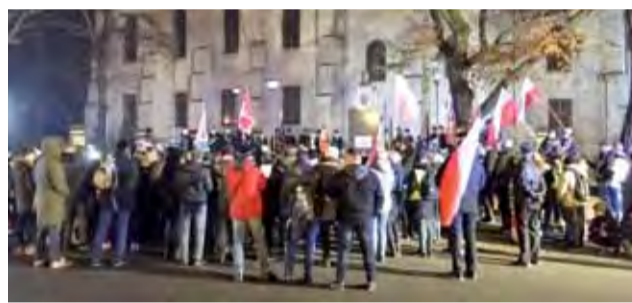
Finał rajdu przy pomniku marszałka Piłsudskiego pod ZSP nr 1.