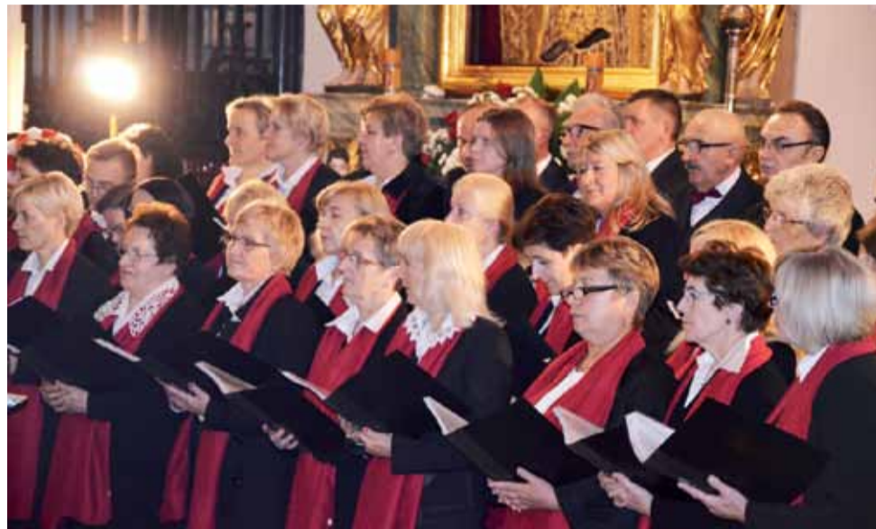
Pieśń „Boże coś Polskę” w wykonaniu chórów była najlepszym wprowadzeniem do ogólnej myśli spektaklu.