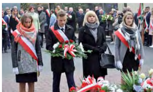
Wśród wielu delegacji byli również i przedstawiciele II Liceum Ogólnokształcącego w Łowiczu.

Podczas akademii była też okazja do wręczenia nagród zwycięzcom szkolnego konkursu: „Co wiem o historii szkoły i jej patronie?”, który odbył się pod koniec