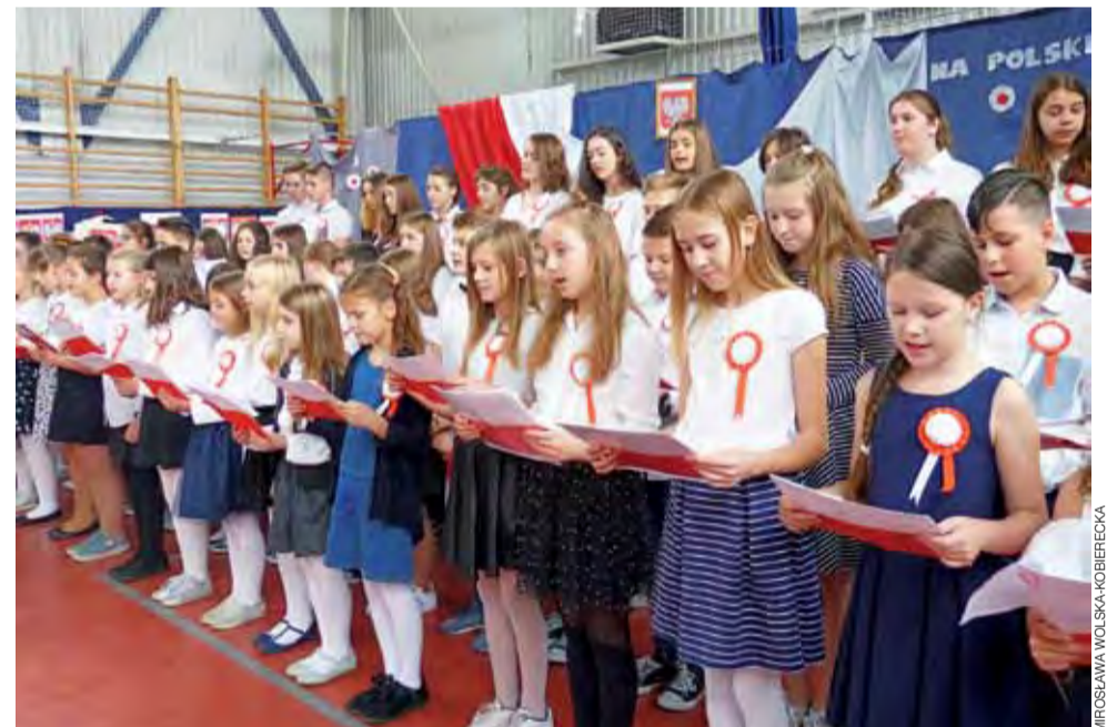
Chór szkolny, dla potrzeb wyjątkowego koncertu, rozrósł się do składu 50-osobowego.

W dalszej części koncertu z okazji 100-lecia odzyskania niepodległości zabrzmiały również takie utwory jak np. „Rota”, „Marsz Pierwszej Brygady”, „O mój rozmarynie”, „Rozkwitały pąki białych róż”, „Przybyli ułani”, „Szara piechota”, „Dziewczyna z granatem”, „Warszawo ma” i „Mury”. Piosenki przeplatane były komentarzem czytany przez uczniów, uzupełniali go dokumentalne filmy i zdjęcia pokazywane na ekranie.