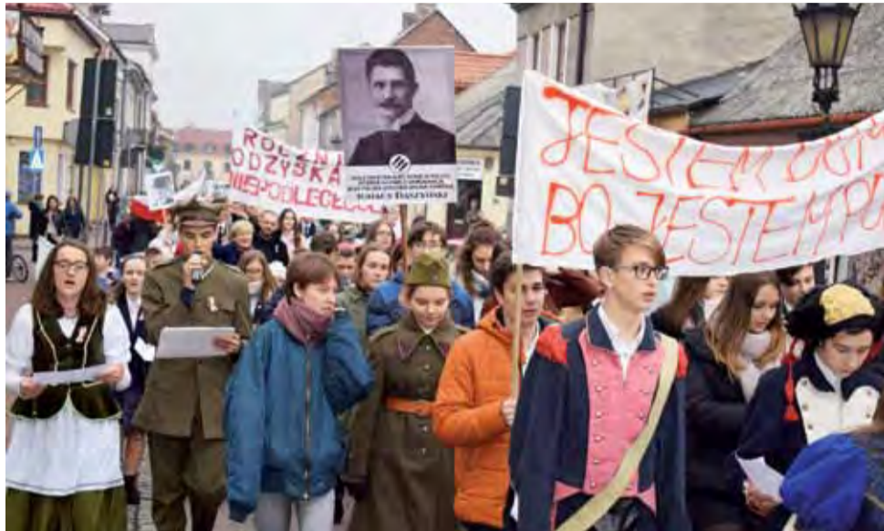
Niepodległościowy pochód zmierza ulicą Zduńską na Nowy Rynek. Widoczny fragment baneru z napisem „Jestem dumny, bo jestem Polakiem”.

Przemarsz został w tym roku zorganizowany w piątek, 9 listopada. Przed jego wyjściem, o godzinie 11.11, jak w większości polskich szkół, na dziedzińcu odśpiewano w pełnym brzmieniu Mazurka Dąbrowskiego. Uczniowie zarówno szkoły podstawowej, gimnazjum, jak i liceum, szli przez miasto z biało-czerwonymi flagami, portretami ważnych dla Polski historycznych postaci, grając i śpiewając patriotyczne pieśni. Wielu z nich zaprezentowało się w historycznych kostiumach z bo-