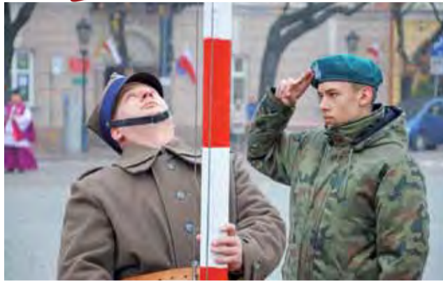
Wyniesienie na maszt flagi państwowej podczas odśpiewania Mazurka Dąbrowskiego na Starym Rynku w Łowiczu.