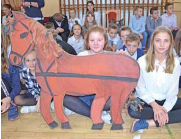
Kasztanka – klacz, na której jeździł marszałek Piłsudski, to jeden z rekwizytów, jakie wykonali na szkolny happening uczniowie SP 4.

Wesołym akcentem było, kiedy w trakcie układania puzzli na szkolną uroczystość dotarł bur-