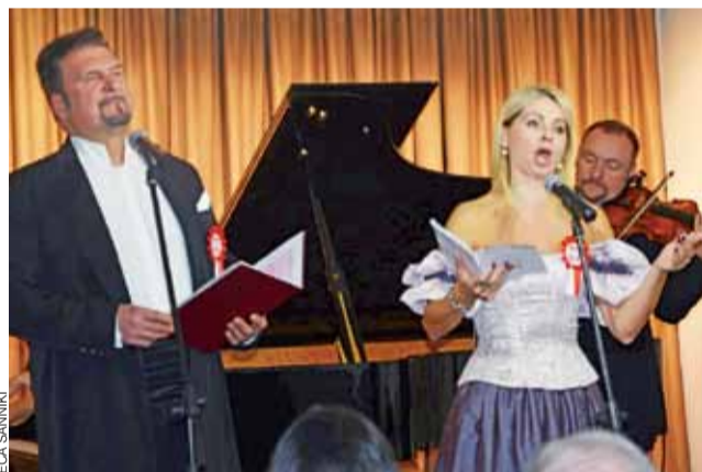
Koncert w pałacu w Sannikach miał charakter patriotyczny.