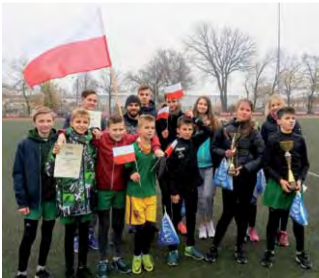
W Łowiczu biegacze z Pijarskiej zdominowali Szalety Olimpijskie dla Niepodległej.