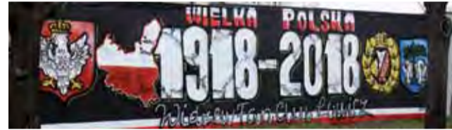
Mural na murze posesji przy ul. Gen Klickiego w Łowiczu.

Zostało ono w większej części sfinansowane z pieniędzy pochodzących ze składek członkowskich w fanclubie. Kibice już dawno temu opodatkowali się w wysokości 20 zł miesięcznie. – Składki wykorzystujemy nie tylko na organizowanie wyjazdów, ale również i takie inicjaty-