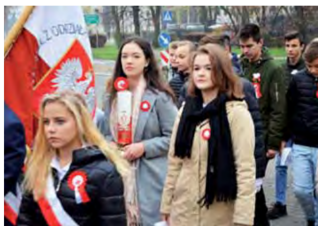
W procesji idą uczniowie Szkoły Podstawowej nr 7 w Łowiczu.

Przy wynoszeniu na maszt flagi państwowej wszyscy zgromadze-