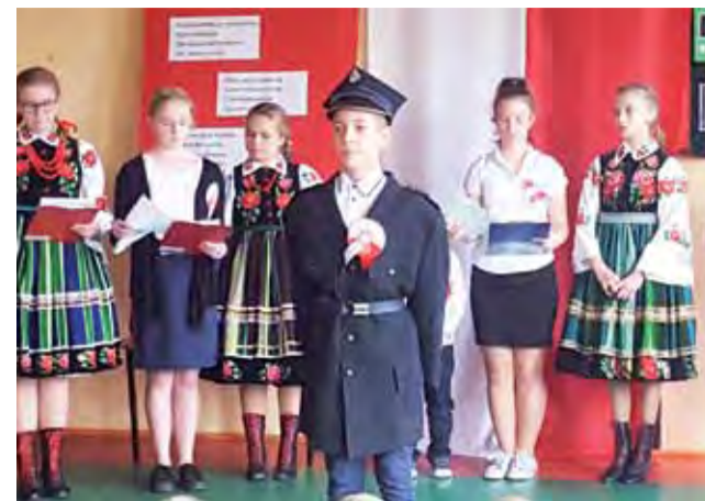
Uczniowie Szkoły Podstawowej w Gągolinie Płd. zaśpiewali pieśni patriotyczne w gwarze łowickiej.