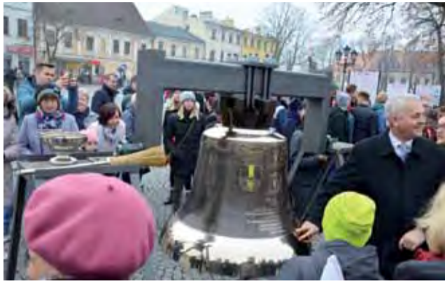
„Piekny!” - mówiło wielu mieszkańców Łowicza i okolic oglądając dzwon „Victoria”.