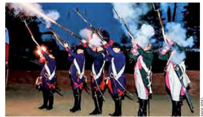
Grupa historyczna Guttstadt zapewniła oprawę historyczną zawodów.

– Miniony sezon był bardzo mocny i wyczerpujący fizycznie i psychicznie. Było wiele wyścigów na limicie przyczepności i umiejętności. Udało się zdobyć Puchar Polski, Mistrzostwo Polski Centralnej, brązowy medal Mi-