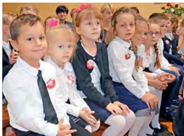
Stroje galowe i symbole narodowe – pierwszoklasiści gotowi do świętowania niepodległości.

8 listopada uroczyste obchody z okazji 100-lecia odzyskania niepodległości przez Polskę odbyły się w Szkole Podstawowej w Zielkowicach.