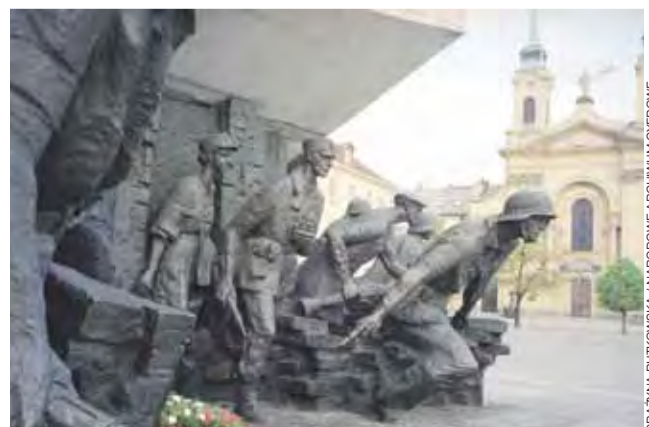
Warszawa, 1996-1997. Pomnik Powstania Warszawskiego na placu Krasińskich.