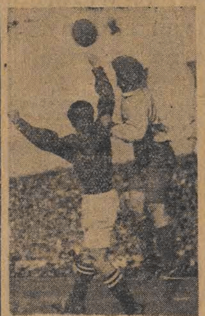
Fragment meczu Polska — Bulgaria, rozegranego w Warszawie w ur. r.