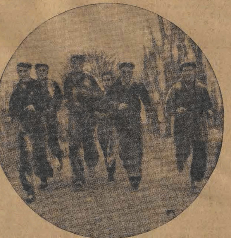
Wczoraj w Parku Ludowym kontynuowano w dalszym ciągu Marsze Jesienne. W marszach wczorajszych wzięło udział 245 uczestników, którzy nie mogli startować w dniu 15 października.