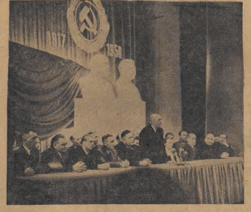
Robotnicza Łódź uroczysto obchodziła 33 rocznicę Wielkiej Rewolucji Październikowej. Na zdjęciu prezydium Centralnej Akademii w Teatrze im. Jaracza.