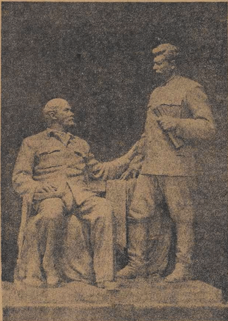
Może artykuł ten przyczyni się w części do bliższego zapoznania nas z życiem wielkiego Lenina. Elekroć przypomnimy sobie dzisiejszy dzień i dzisiejszą naszą gazetkę z paroma zdaniem o Leninie, nie zapomnimy o Jego słowach wypowiedzianych w obli-