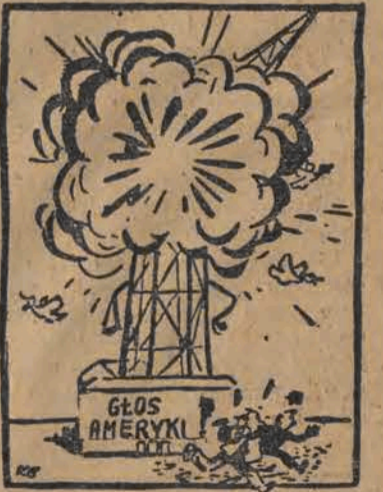
Eksplozja „bomby kłamstw”

Jedna z anten radiowych „Głosu Ameryki” pękła na skutek nie wyjaśnionej eksplozji.