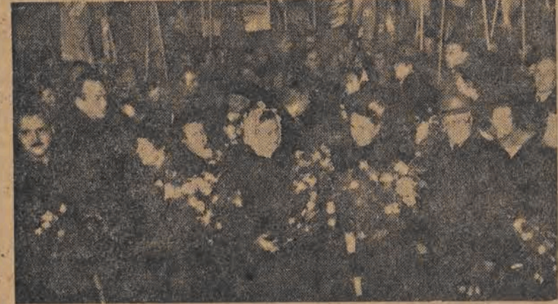
Dnia 13 bm. wieczorem przybyli do Warszawy na Kongres Pokoju delegaci Związku Radzieckiego, Chin, Korei oraz delegat antyfaszystowskich emigrantów jugosłowiańskich. — Na zdjęciu: powitanie delegacji na Dworcu Głównym w Warszawie. Na pierwszym planie delegaci radzieccy; pierwszy z lewej — Konstanty Simonow.