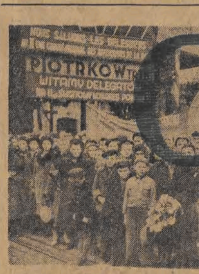
Stary gród trybunalski zaciągnął wielotysięczną Wartę Pokoju w oczekiwaniu na przyjazd zagranicznych delegacji.