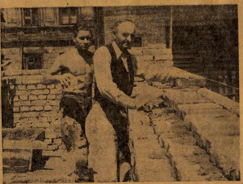
Pracownicy w zakładzie przemysłowym.

W zakresie artykułów przemysłowych bezpośredniego spożycia produkcja tkanin bawełnianych wyno-