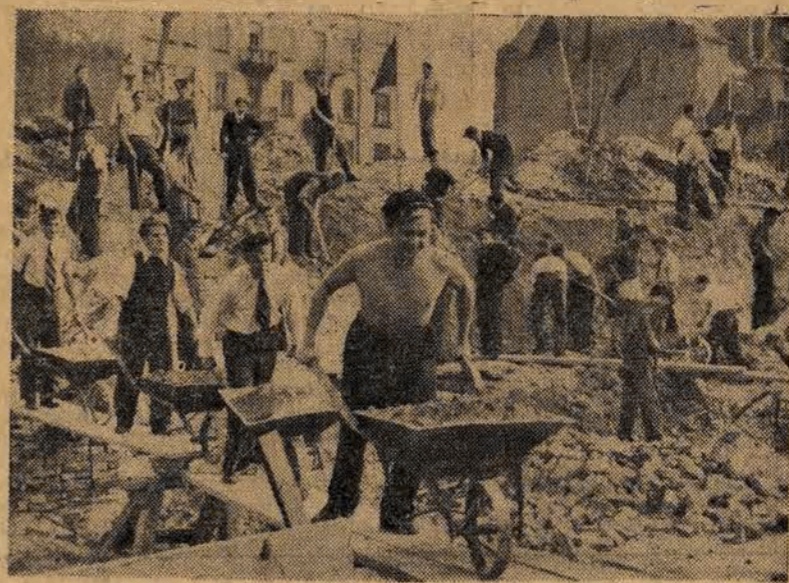
Pierwszą niedzielę roku akademickiego poświęcili warszawscy studenci ochotniczej pracy przy odbudowie. Na zdj.: studenci pracują przy usuwaniu gruzów z Trasy N-S.

ROK III (VI) ŚRODA, 11 PAŹDZIERNIKA 1950 ROKU 280