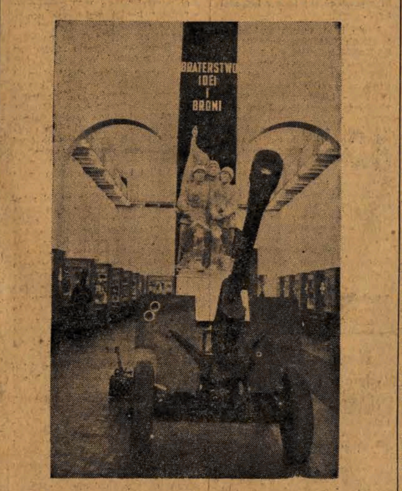
Dnia 6 bm. z okazji 33 rocznicy Wielkiej Rewolucji, w Muzeum Wojska Polskiego w Warszawie nastąpiło otwarcie wystawy pn. „Polsko - radzieckie braterstwo broni”. Na zdjęciu: Fragment wystawy.