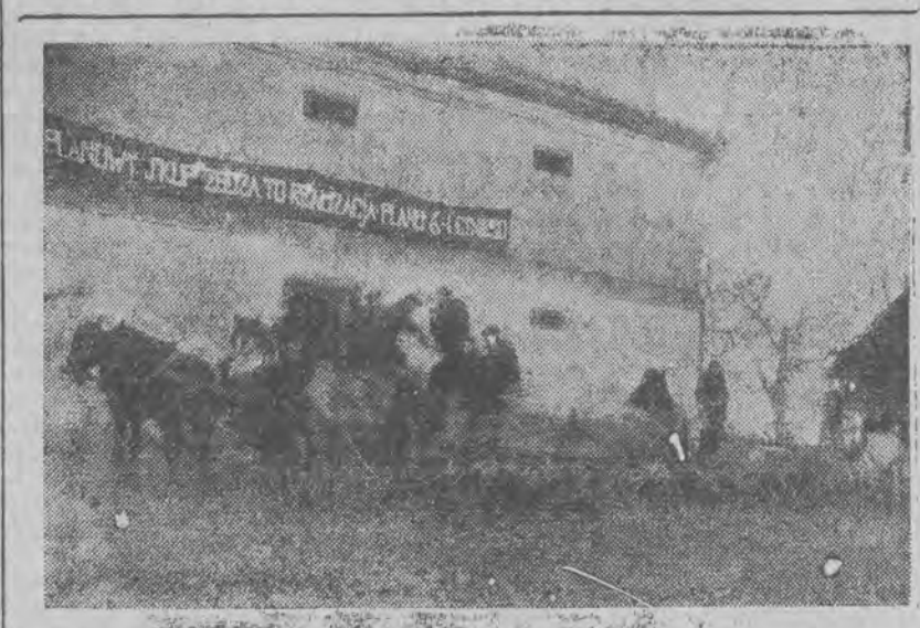
Chłopi z Tychowa, pow. łódzki, odstawił manifestacyjnie nadwyżki zbożowe na punkt skupu

W myśl uchwały, zakłady, których produkcja przeznaczona jest bezpośrednio na potrzeby miejscowej ludności oraz na potrzeby przemysłu kluczowego znajdującego się w najbliższym zasięgu terenowym, zostaną przekazane pod zarządek rad narodowych.