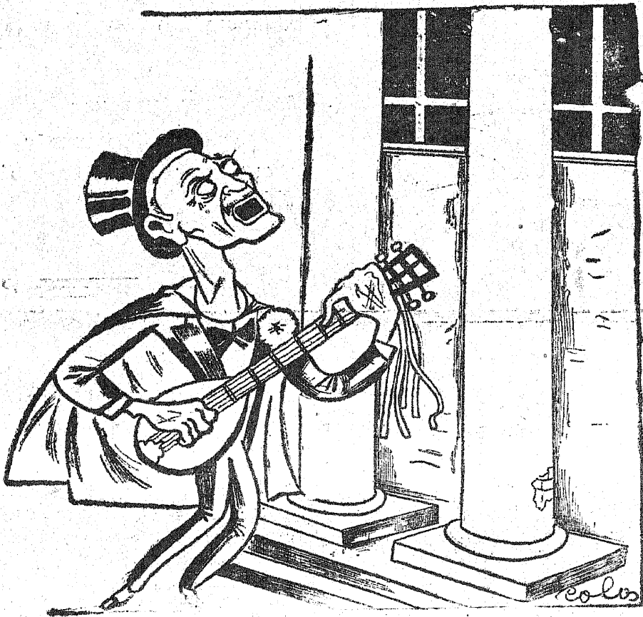
Daszyński: Komam herab, o Madonnal.